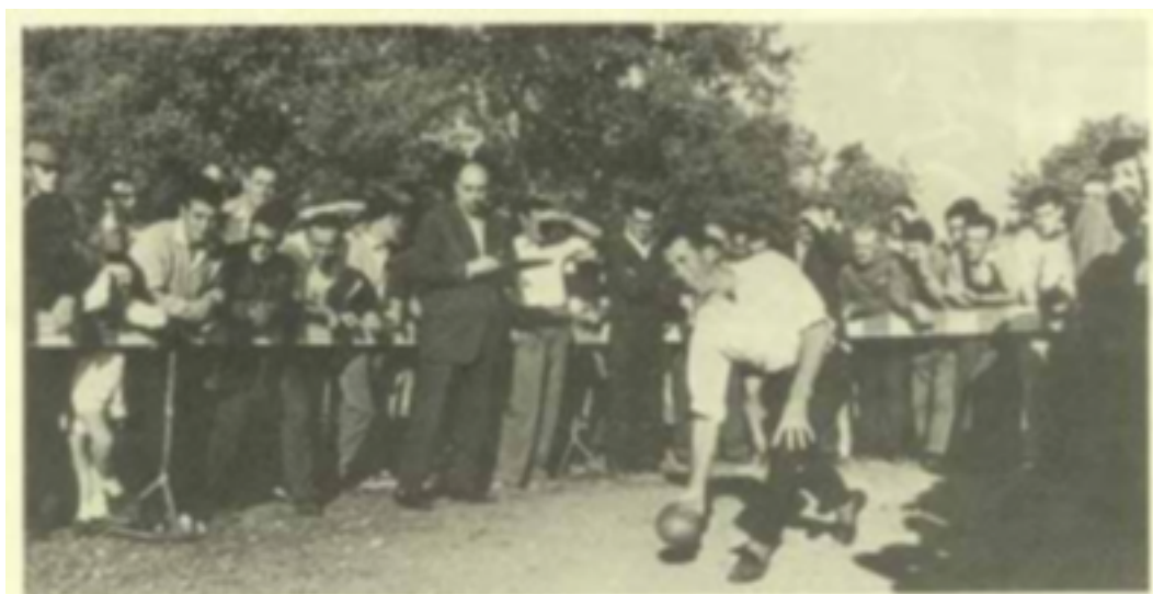
2. tirada de bolos antigua

realizar un ejercicio físico. La Iglesia personificó el "Kegel" como el Mal y para atraer a los feligreses les invitaba a participar en un juego de "palos" dentro de la iglesia o posiblemente en los claustros. Los que fueran capaces de dar al "Kegel" habrían d