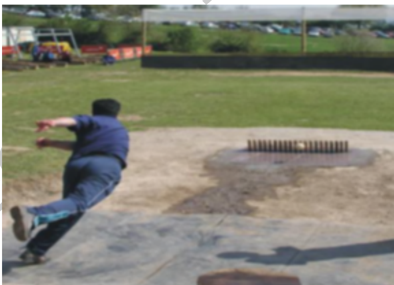
9. Lanzamiento bolo celta

o subir. En la fase de bajar, cada jugador lanzará la bola contra los bolos desde la "poya", con el fin de derribar el mayor número de bolos y pasarlos más allá de la "raya de 10" o pasar un bolo por del