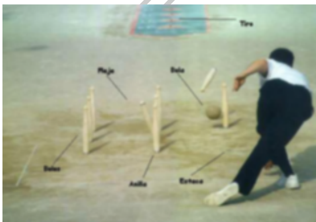
8. Lanzamiento en bolo palma

El bolo-palma es la modalidad de bolos que mayor complejidad presenta.