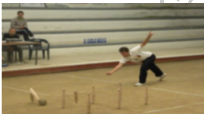
Nº12 Competición Bolo Burgalés

El juego de los bolos ha sido durante centurias el preferido de los hombres burgaleses. En la provincia de Burgos se jugaba, y se sigue jugando, a los bolos de tres maneras: burgalés, pasabolo y tres tablones.