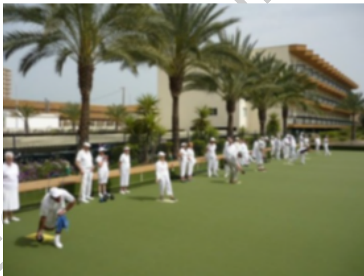
10. Lanzamientos bolo sobre césped

Bowls (también conocido como Bowls sobre hierba o Bolo césped) es un deporte de precisión cuya meta es hacer rodar unas bolas de radio ligeramente