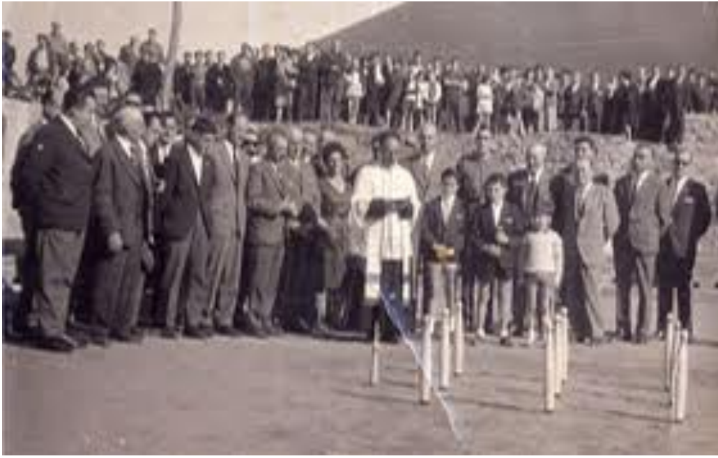
3. Partida de bolos antigua

En 1722, en la villa de Ampuero, se dicta " que ningún vecino pueda ocuparse en el juego en día de trabajo, ni de día ni de noche, como