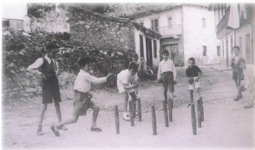
4 Niños jugando a los bolos

Después del conflicto bélico, el país quedó asolado y las prioridades de los ciudadanos se dirigieron hacia su reconstrucción, dejando la práctica de cualquier actividad deportiva o lúdica en un segundo plano. Sin embargo, se produjo un hecho singular e importantísimo para las pretensiones de los bolísticos: Las nuevas concepciones deportivas del régimen ganador de la contienda civil.