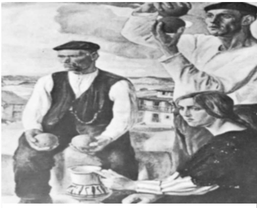
1. Jugando a los bolos

Para conocer los antecedentes de la FEB se debe de retroceder hasta el segundo decenio del siglo pasado cuando los juegos de bolos habían alcanzado cierto esplendor en el norte peninsular, principalmente en la provincia de Santander