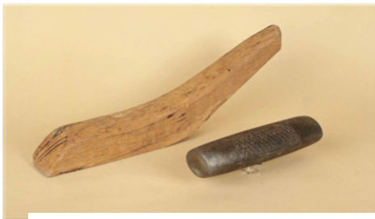
Nº13 Materiales Bolo Calva

Era jugado por pastores, quienes para entretenerse lanzaban una piedra a un cuerno de vaca. A medida que el tiempo fue pasando, el juego se modificaba: se