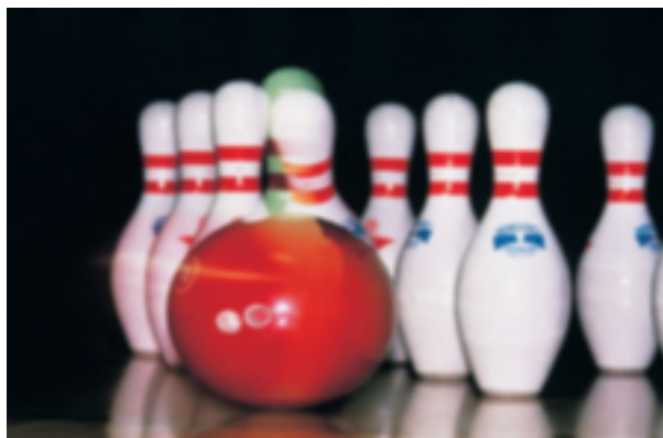
Nº7 Bola derribando

El bowling es un deporte que se realiza en recintos cerrados, el que