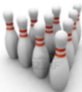
Nº 5 Bolas de Bowling

La bola La bola más liviana es de 6 libras, mientras que la más pesada es de 16. Una bola de bolos tiene 27 pulgadas (40.5 cm) de circunferencia. El diámetro es de 8,5 pulgadas (21.6 cm).