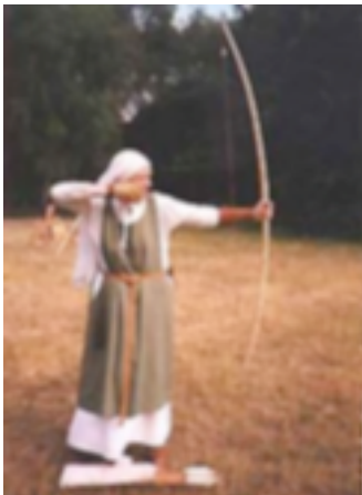
6. Mujer con el arco

Tiro con Arco. El más importante de todos tuvo lugar en 1673, en Yorkshire, Inglaterra y fue el Ancient Scorton Silver Arrow Contest, que aún persiste en la actualidad. Con el paso del tiempo las mujeres también practicaron este deporte y la primera vez que una de ellas entró a formar parte de una sociedad de arqueros fue en 1787.