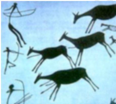
1. Cazando animales

Los materiales con los que estaban contruidos aquellos primitivos