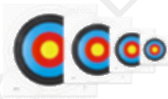
30. Aire libre