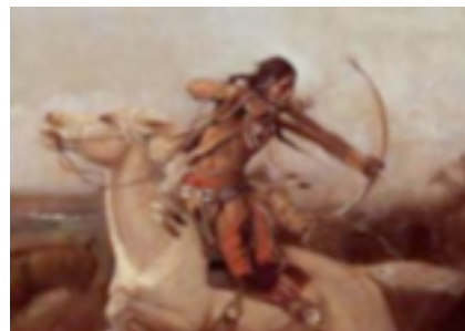
7. Indio arquero

Curiosamente fue la guerra civil de los Estados Unidos la que impulsó el interés por el tiro con arco. Cuando la guerra terminó, la Unión prohibió a todos los soldados de la Confederación el uso de las armas de fuego. Por esta razón, dos hermanos, Will y Maurice Thompson,