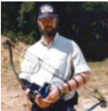
10. H.W.Allen con arco moderno

utilizó el aluminio para construir las flechas. La uniformidad y ligereza de este material mejoró notablemente los resultados de los arqueros. El segundo tuvo lugar en 1966, cuando H.W. Allen inventó el arco compuesto. Este arco utiliza dos poleas decentradas (es decir, que no están sujetas al cuerpo del arco por su eje central) que van colocadas en los extremos del cuerpo, y gracias a las cuales se puede reducir la tensión de la apertura y el peso del arco. Estos arcos se han hecho