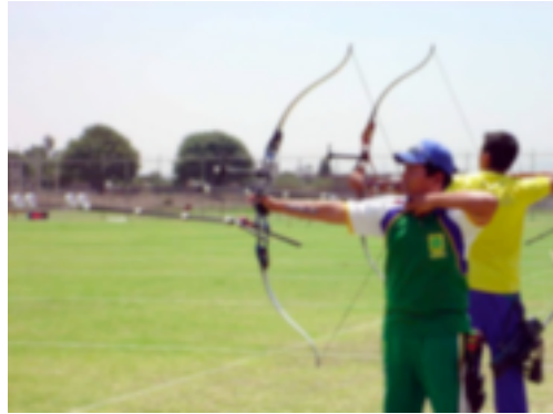
28. Estándar (serie española)