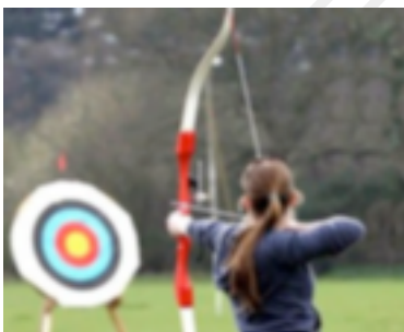
16. Precisión y puntería

El arco también puede ser considerado como el primer instrumento construido por el hombre primitivo de la Península Ibérica, que ha permanecido siempre a su lado en el largo camino de su evolución y desarrollo. El arco fue tenido en gran consideración por nuestros lejanos antecesores no solo como arma ofensiva, sino también en competiciones y torneos, tirando al blanco, en ardorosas luchas para exaltar las dotes de habilidades y precisión de los concursantes.