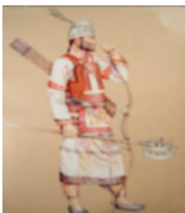
13. Indumentaria del antiguo arquero

El tiro con arco alcanzó rango olímpico en París, en 1900, aunque la inexistencia entonces de un organismo internacional que estableciera un reglamento único explica la supresión de este deporte del programa olímpico.