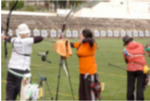
35. Campeonato al aire libre

Gestiona: Club de Tir amb Arc Pardinyes.