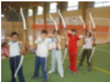
22. Escuela de tiro con arco