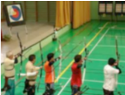
22. Club deportivo de tiro con