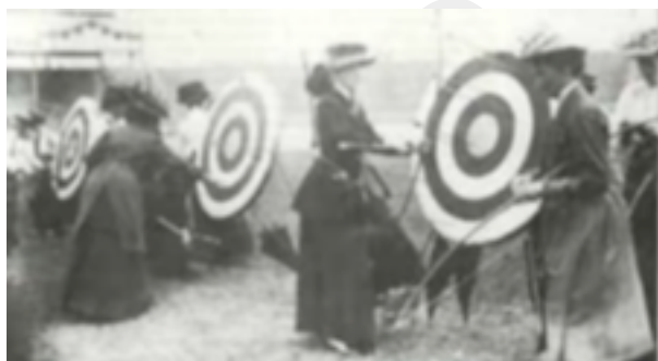
8. Primeras competiciones de tiro con arco

La primera vez que el tiro con arco apareció en unas Olimpiadas fue en París, en 1900, como homenaje al guerrero mítico Hércules, al que se consideraba el primer arquero de la Historia. En los Juegos Olímpicos de San Luis (1904) y los de Inglaterra (1908) se tomaron en serio esta modalidad, aunque luego cayó en el olvido. Tuvieron una representación fugaz en Bélgica (1920) aunque aún tendrían que pasar otros 52 años hasta que el tiro con arco se consolidase como deporte olímpico.