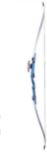
24. Recurvado (tradicional)