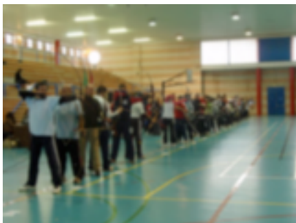
34. Competición en sala.