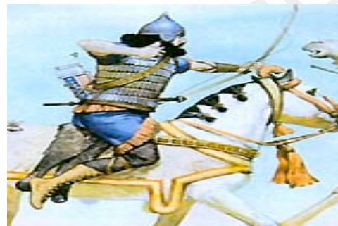
2 y 3. Arqueros luchan montados en carro y caballo

arcos eran mucho más potentes que los utilizados por los egipcios y, además, contaban con la gran ventaja de poder dispararlos desde un caballo. Fue la pieza clave que les permitió expandir su imperio. Otros pueblos crearon impresionantes máquinas de guerra al hacer que los caballos tirasen de carros en los que iban los arqueros.