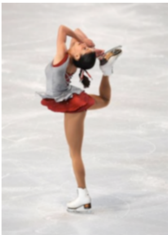
2. Patinaje sobre Hielo