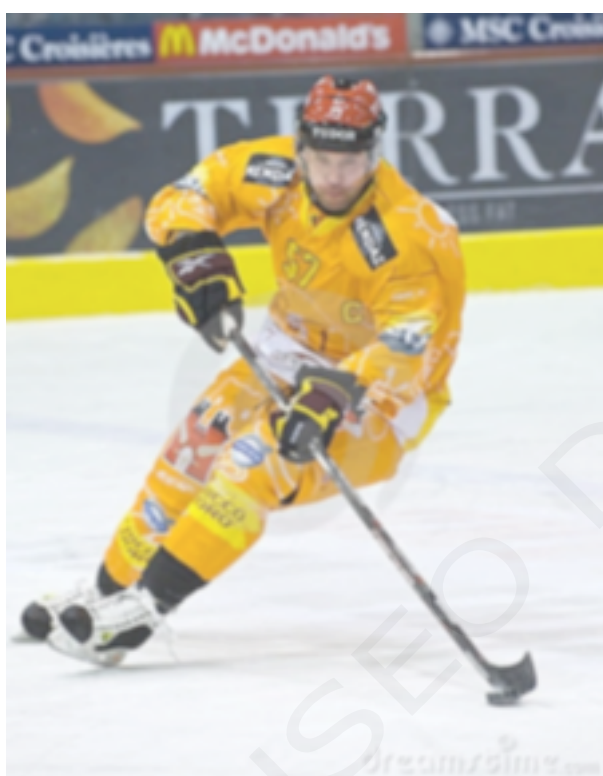
1. Hockey sobre hielo.

temporada. Ambos clubes encontraron dificultades económicas y se encontraban sin pista, patrocinadores ni fondos para los desplazamientos. El Aramón CH Jaca se reincorporó al campeonato en la temporada 2008-2009 con patrocinadores y presupuesto renovados.