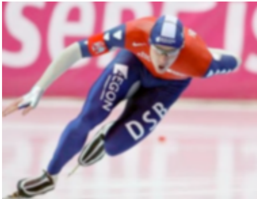
3. Patinaje de Velocidad

Se rige por la misma federación internacional que el patinaje artístico sobre hielo, la ISU.