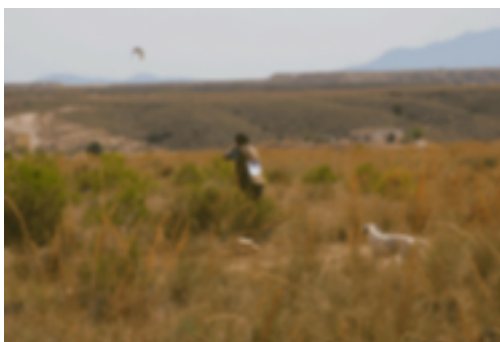
28. Cazador en el campo

La prueba se desarrolla con caza salvaje o sembrada (perdiz o faisán) en terrenos naturales y en donde el cazador, con su perro, efectúa un turno de veinte minutos, pudiendo utilizar cuatro cartuchos y únicamente puede abatir dos piezas de las consideradas puntuables.