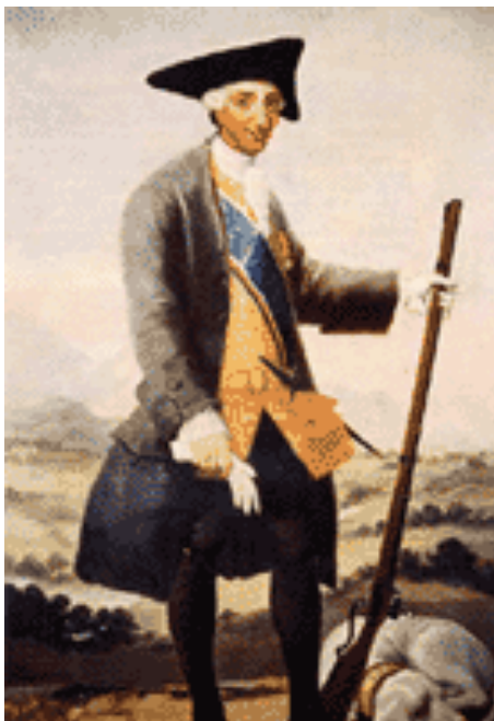
2. CARLOS III CAZADOR

La Revolución Francesa de 1789 constituyó un punto de inflexión que dinamitó los ya insostenibles cimientos del llamado Antiguo Régimen. El absolutismo, defensor de privilegios aristocráticos y disfrazados culturalmente con el nombre de Ilustración, no tardó en extrapolarse a otros países europeos, uno de ellos España. Esta reflexión, resulta realmente importante porque también afecta a la caza, pues ésta deja de ser un deporte casi exclusivo de la nobleza. Los dos últimos siglos, con revoluciones, guerras y dictaduras en nuestro país, han servido para consolidar a la caza como una de las actividades deportivas, sociales, culturales y económicas más en alza de nuestra singular piel de toro. Además, mejoras en las armas de retrocarga (escopetas y rifles) y en su munición, aparición de múltiples complementos para el cazador, normativas legales específicas de caza (vedas, licencias de caza, permisos de armas, especies a cazar, perros, etc.) y, sobre todo, creación de órganos de representación de este colectivo, de entre los cuales destaca la Federación Española de Caza, que está realizando una magnífica labor un sinfín de la caza, los cazadores y los hábitats.