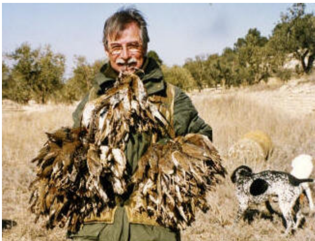
3. CAZADOR CON SUS PRESAS