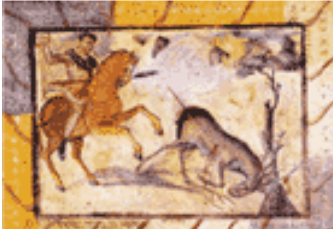
1. MURAL ROMANO MÉRIDA

En la Antigüedad era un auténtico paraíso para la caza debido a las condiciones medioambientales y que estaba escasamente poblado. Junto a las especies que conocemos actualmente también convivían hienas, chacales,