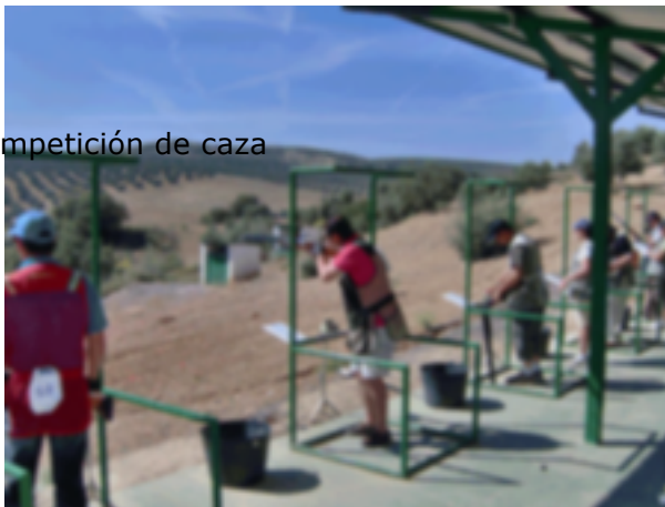
37. Competición de caza

La Comisión Directiva del Consejo Superior de Deportes (CSD) en su sesión del 20 de Febrero de 1.996, acordó la inclusión de la modalidad de Compak Sporting en los Estatutos de la Real Federación Española de Caza, lo que conlleva la autorización exclusiva para la organización