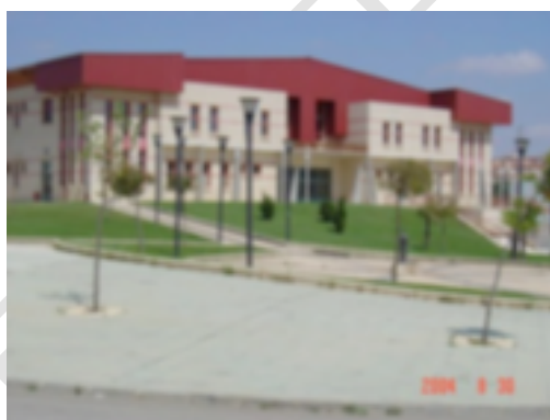
10. Residencia del CETD de Soria