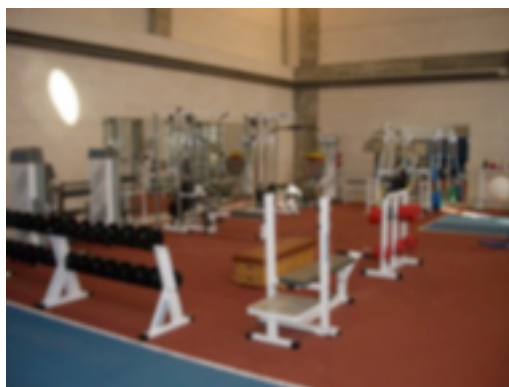
Figura 9. Gimnasio del CTD de Soria