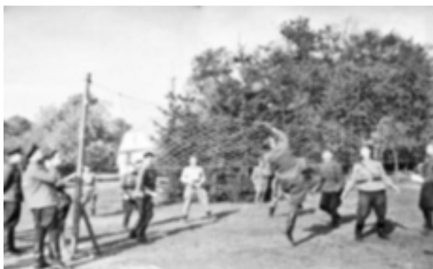
1. Primeras imágenes del voleibol

El voleibol fue creado el 9 de febrero de 1895 por el director de la Escuela de Educación Física de la Asociación Cristiana de Jóvenes (YMCA) William George Morgan; en la ciudad de Holyoke, del estado de Massachusetts (Estados Unidos).