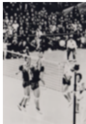
4. Juegos Olímpicos

En la competición celebrada por primera vez en Tokio 1964 participaron 10 equipos masculinos y 6 femeninos. Los vencedores fueron la selección japonesa en mujeres y el combinado de la URSS en categoría masculina. La victoria japonesa supuso un aumento de la popularidad del deporte en el país nipón.