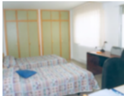
7. Dormitorio CETD DE Palencia