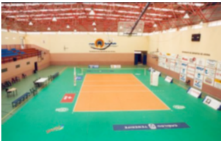
Figura 12. Pista del CETD Voley-Playa Arona