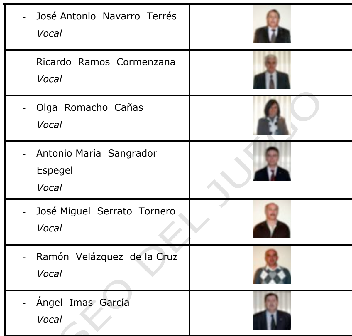
Tabla 1. Junta Directiva de la RFEVB