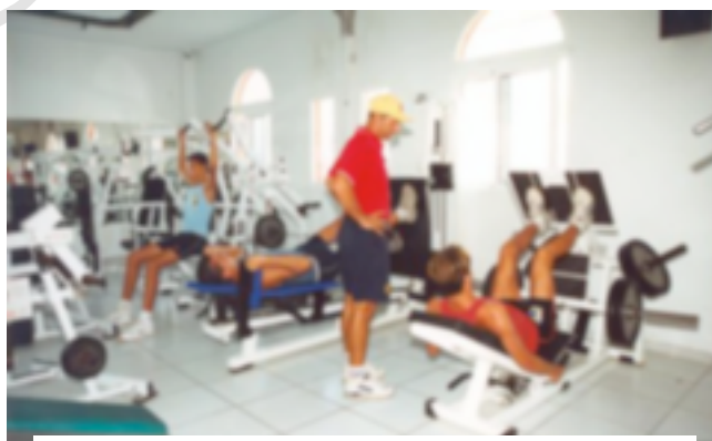
12. Gimnasio CETD Voley-Playa Arona