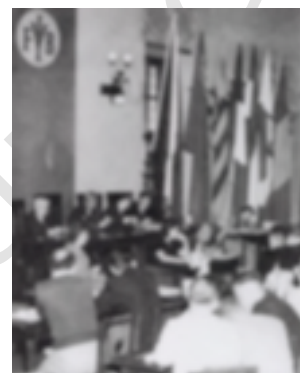
2. Fundación del FIVB, París 1947