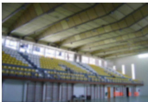
11. Pista del CTED de Soria