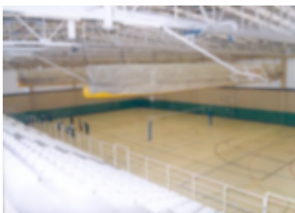
8. Pista del CETD de Palencia