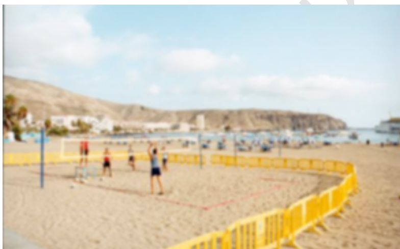
Figura 13. Pista del CETD Voley-Playa Arona