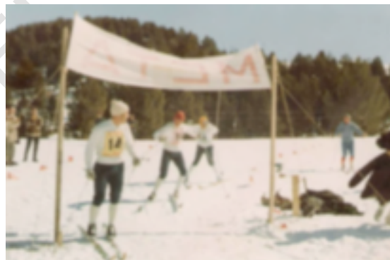
3. Esquí de fondo. 1978

La Real Federación española de Deportes de Invierno comporta las siguientes Modalidades: Esquí Alpino, Esquí de fondo, Biatlón, Esquí Artístico, Snowboard, Musingh, Telemark, Bosleigh, Luge. Los presidentes que ha tenido hasta ahora la Federación de esquí en estos años son los siguientes: