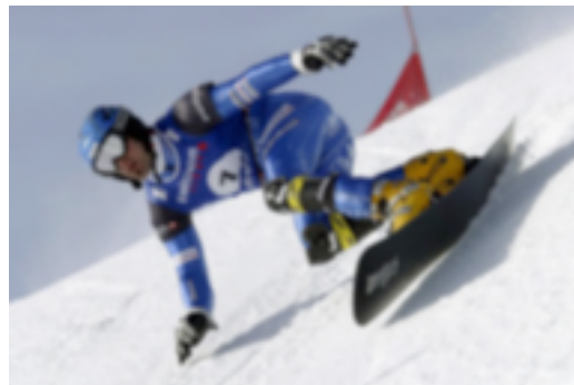
Foto 7. Snowboard. Paralelo

Actualmente, son muchos los lugares donde pueden realizarse dichos Programas de Formación, ofreciendo a los demandantes una mayor accesibilidad y comodidad a la hora de realizarlos. Sin embargo, no todos ellos tienen forma en las tres modalidades: