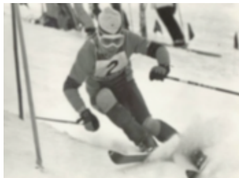
1. Francisco Fernández Ochoa. Sapporo'72. ORO

Desde los años 20 se practica en España deportes de invierno (Guadarrama, Pirineos, Picos de Europa, Sierra Nevada, Gredos, la Sierra de Alcaín y otros). Ya en 1929 La Real Sociedad de Alpinismo Peñalara, edita un manual escrito por E.Selmid. Lo practicaban grupos concretos, no era una práctica generalizada, grupos que, en su búsqueda de nuevas formas de vida y recreación, encontraron en la montaña y el excursionismo un nuevo medio para expresar sus inquietudes y satisfacer sus ideas. La mayoría de ellos estaban formados por autodidactas y esquiadores de países nórdicos y alpinos desplazados a España generalmente por motivos de trabajo. La primera expedición importante en la Sierra de Guadarrama se realizó en 1855. En 1868 se realizaban ya numerosas expediciones, organizadas por científicos alemanes, franceses, ingleses e italianos. La Península Ibérica era, por tanto, objeto de la atención de exploradores y científicos europeos (y españoles), conocedores de la existencia de unos parajes aún poco estudiados y abiertos por ello a la investigación.