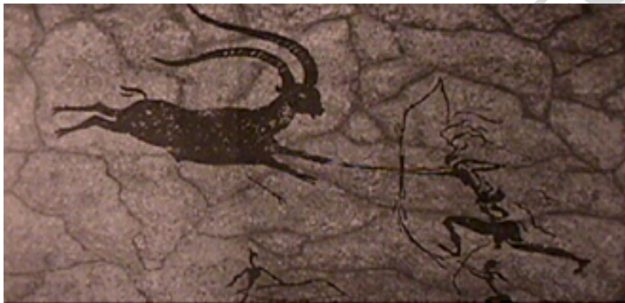
44. Escena de caza, cueva Remigia, Castellón