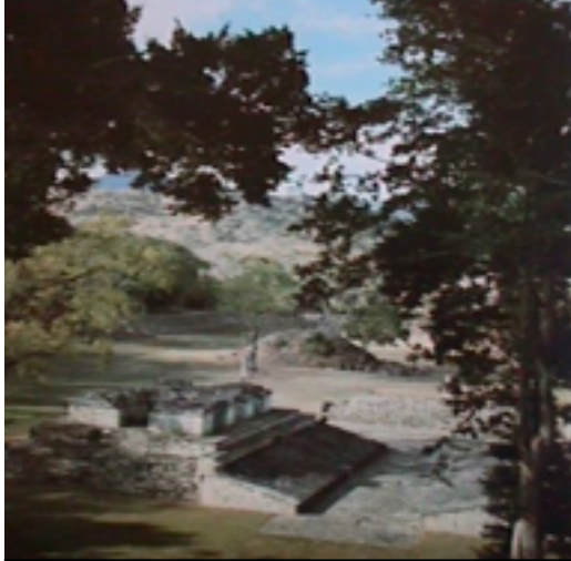
37. Pista de juego de pelota de Copán

3.1 EL JUEGO DE PELOTA MESOAMERICANO 7 . Es el ejemplo mejor documentado del deporte prehistórico, debido a su amplia