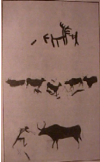
43. Toros prehistóricos

5. 1 En la historia de los pueblos prerromanos peninsulares distinguiremos dos etapas: la prehistoria propiamente dicha, como etapa más larga y menos conocida, durante la cual los hombres de la península evolucionan muy lentamente de una economía y sociedad cazadora-recolectora (Paleolítico) a una economía y sociedad agrícola y ganadera (Neolítico) que empieza a usar los primeros metales (Eneolítico); y la etapa de las colonizaciones históricas (primer milenio a.C.) que a través del comercio de los metales, introduce a los pueblos hispanos en los mercados del Mediterráneo dominados por las grandes culturas urbanas del Próximo Oriente y del Egeo.