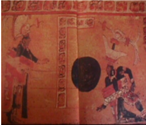
39. Jugando con una pelota

prehistórica donde el juego prospera, es el de la cultura Hohokan (sur de Arizona). Aquí encontramos campos de juego datados a partir del 800 d.C., pero el juego caería en desuso a partir del siglo XV, junto con otros elementos culturales. Esto acontecería