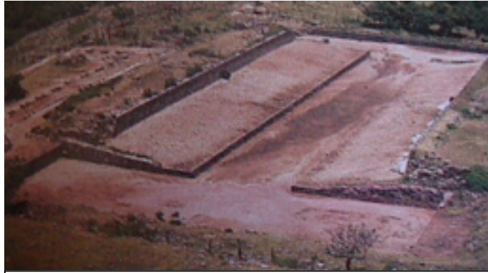
40. Campo de juego de pelota de xochicalco

Por el enfoque histórico, puede constatarse la relación entre todos los juegos de pelota indígenas norteamericanos desde los juegos prehistóricos del suroeste. Han sido clasificados por Stewart Culin (1907) en 1º juegos de raqueta, 2º Shinny, 3º Doble bola, 4º carrera de pelota, 5º fútbol, balonmano, malabarismos, lanzamientos. Todos comparten unos rasgos comunes que son los mismos que distinguen al juego de pelota clásico: el uso de una superficie despejada y nivelada, con una meta marcada con postes en el centro o límite y con falta de limitación en los bordes; la existencia de dos bandos