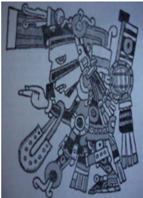
38. Azteca con el distintivo de jugador de pelota

juego. Entre los elementos variables hay que señalar: la dimensión y forma de la cancha, las reglas de juego, los equipos y las representaciones artísticas. La cancha más generalizada, consistía en una superficie rectangular, pavimentada y delimitada por cuatro muros inclinados, rematados por sendas plataformas. Tres bloques de piedra dispuestos en la superficie del terreno de juego, servían de marcadores. Los campos de juego tienen forma de "I", y sus dimensiones varían, desde los 10 metros para la disputa mano a mano entre dos jugadores, hasta pistas inmensas, como la de Chichen Itza; como ejemplos podemos citar: Copán, Palenque y Tikal. Pese a todo ello el juego de la pelota será un factor importante en la vida de otros pueblos como Toltecas y Aztecas, donde los restos arqueológicos de canchas son menos abundantes.