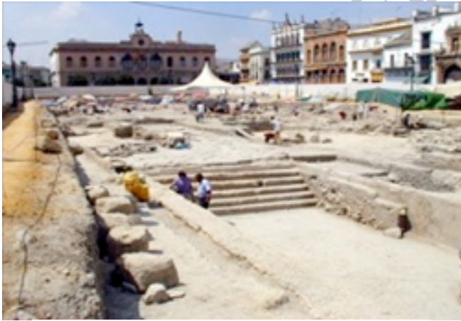
Ilustración 4. Restos excavaciones. La Amazona se expone actualmente en el Museo de Écija junto a otros materiales diversos, muchos de ellos también de gran valor, entre los que sobresalen el torso de un atleta, las piernas de un hombre, una cabeza con casco y diversos vestigios de restos arquitectónicos y epigráficos.

Encontrada en las excavaciones de El Salón, la Amazona de Écija es una escultura que destaca por su excepcional calidad técnica y artística. Alcanza los 2,11 metros de altura, pesa más de media tonelada y fue trabajada en mármol blanco de importación, en una sola pieza, y sin pulimentar.