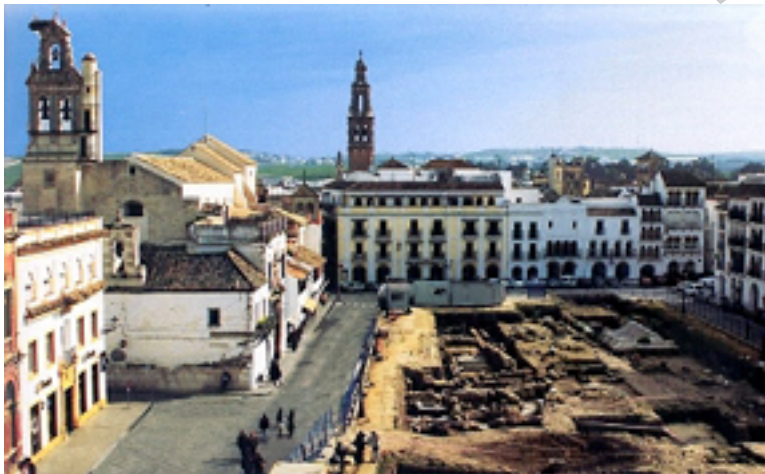
Ilustración 1. Excavaciones, plaza Écija.

Existen abundantes vestigios que nos hablan de la ocupación tartésica y turdetana de la antigua Écija, sobre todo en la zona