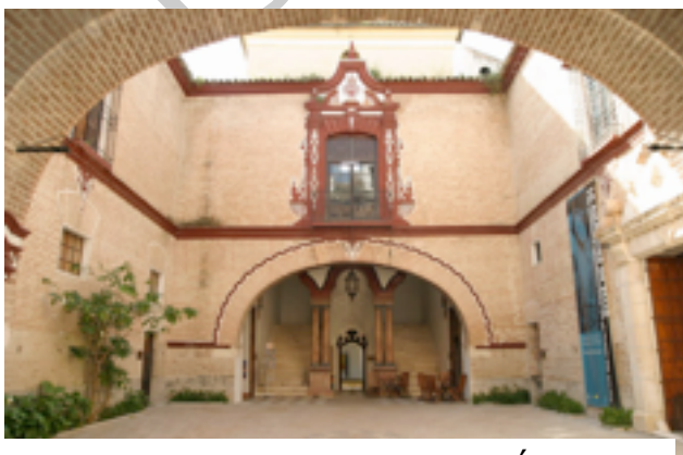
Ilustración 1 2. Patio museo Écija