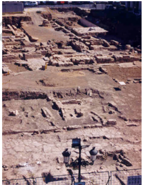
Ilustración 3. Excavaciones.

En las excavaciones que se realizaron en el solar de la Plaza de España de la ciudad, también conocida como El Salón, en pleno corazón de Écija, con la finalidad de construir unos aparcamientos subterráneos, han venido aflorando unos interesantes vestigios del pasado romano y musulmán de la población, entre los que sobresalen los restos de las termas romanas de Astigi, destacando una natatio o piscina de 23,80 metros de longitud y la palestra o zona no techada destinada a la práctica de ejercicios de atletismo. La Amazona herida, objeto de este estudio, apareció el día 7 de febrero de 2002, precisamente en esa natatio, como luego tendremos ocasión de profundizar.