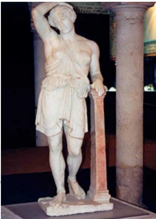
Ilustración 7. Escultura Amazona

En nuestros tiempos se piensa que existen tres representaciones escultóricas de amazonas que podrían responder al modelo que creó Policleto. Del primero, existe una copia en el Museo Vaticano; del segundo, existe otra en los Museos Capitolinos, y del tercero, finalmente, conocido como Amazona Sciarra se habrían conservado cuatro ejemplares, entre ellos la imagen