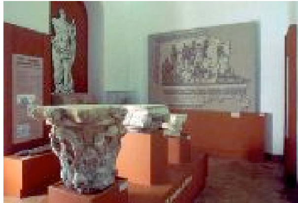
Ilustración 14 Sala de mosaicos

La sala de los mosaicos se abre en la planta superior del palacio de Benamejía, y tiene alrededor de 250 metros cuadrados, de los que 180 se reservan para la rica variedad de piezas de la vieja Astigi. Pero