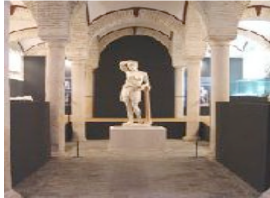
Ilustración 11. Amazona

El Museo cuenta con cuatro salas de Arqueología en las que se exhiben tesoros de gran valor artístico y cultural. Destacan la interesante colección de piezas metálicas