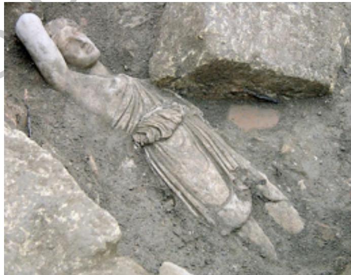
Ilustración 5. Descubrimiento amazona. desearan ocultar esta bella imagen clásica, para evitar así su destrucción. A fin de cuentas no hemos de olvidar que Astigi fue

Ese deseo de evitar su destrucción puede estar relacionado, posiblemente, con la llegada de los cristianos al poder. Para la nueva religión oficial del Imperio las termas estaban consideradas como los templos del paganismo. Los filósofos cristianos no dudaron en lanzar críticas feroces contra los edificios de baños públicos, en los que se acumulaba, según ellos, el placer y la lujuria. En un contexto de odio oficial de los nuevos poderes contra las termas es posible que un grupo de personas