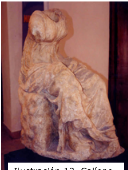
Ilustración 13. Calíope.

Llama también la atención entre los fondos del museo una pieza de más reciente incorporación que nos ofrece la imagen en mármol de Calíope, la musa de la poesía épica y madre de Orfeo. Es una escultura que se ha fechado en los siglos I ó II de nuestra era y que reproduce un modelo griego del siglo II a.C.