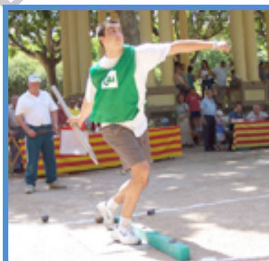
Figura 12: Participante en el tiro de reja

El juez de 'pies' no cantará 'tiro' hasta que no lo interprete así el Juez de 'caída'.