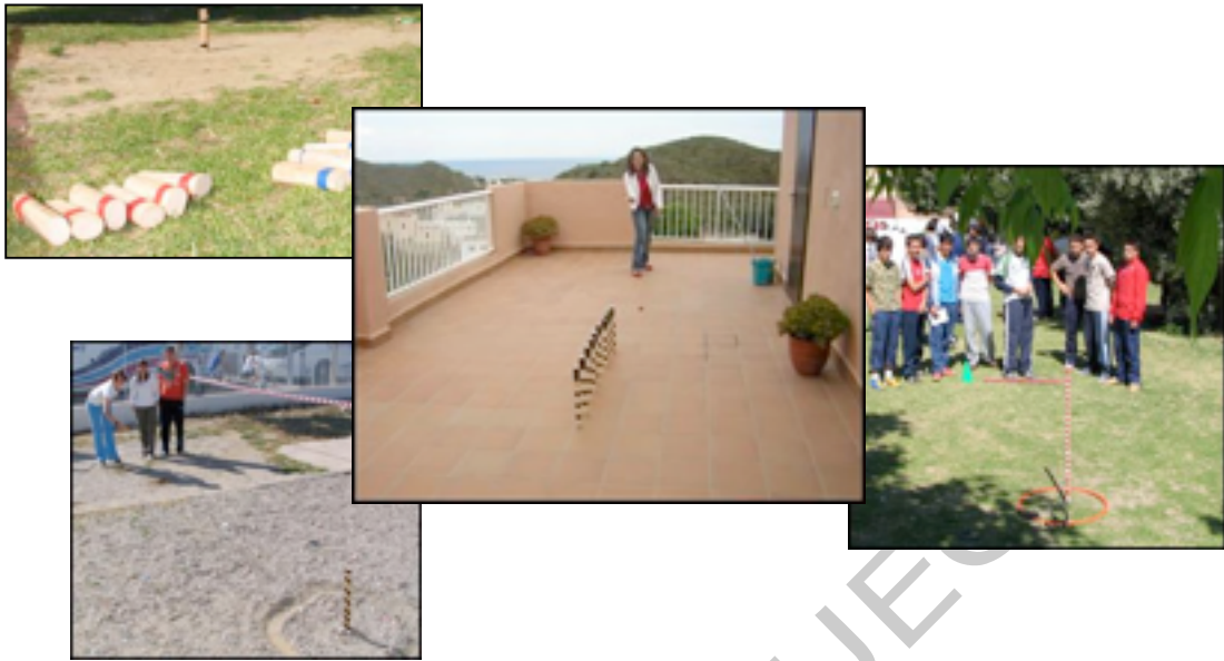
Figura 8, 9, 10 y 11: Fotografías de los juegos tradicionales de lanzamiento a distancia

El contenido de este tipo de juegos es arrojar un objeto de mayor o menor peso a la mayor distancia posible.