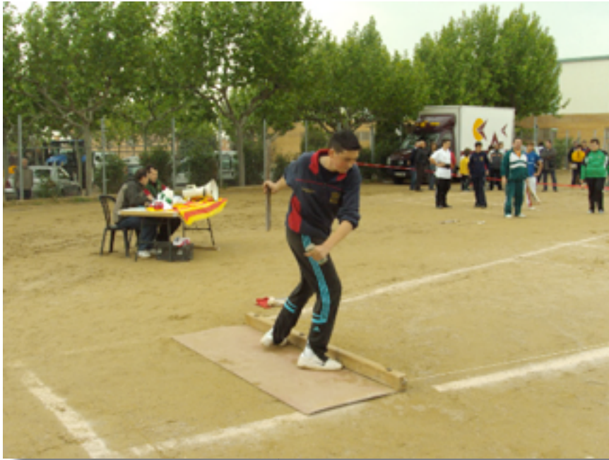
Figura 13: Participante en el tiro de reja

No se sabe el resultado de la apuesta. Calatorao, al igual que este pueblo de Huesca, estaba poblado de moriscos y cristianos, dominando en número de habitantes los primeros, de manera que este relato es un claro ejemplo de lo que aquí pudo pasar.