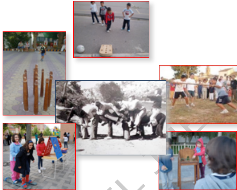
Figura 2, 3, 4, 5, 6 y 7: Fotografías de los juegos tradicionales aragoneses