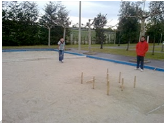
Imagen 10: línea de valoración

Finalmente la raya afecta también a la bola por cuanto es necesario que ésta la supere. En caso contrario no tendrán validez los bolos derribados, lo que en el argot de este juego se denomina bola morra o nula y perderá el derecho a ejecutar la segunda de las acciones del juego, el birle.