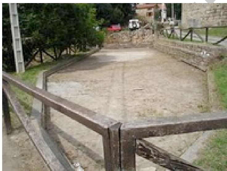
Imagen 8: Bolera

En la descripción del campo de juego habrá que citar tres elementos básicos: el pas de tiro, la losa y la línea que determina la puntuación de las acciones.