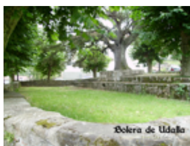
Imagen 5: Bolera de Ullada

Si se tienen en cuenta las peculiaridades de Trasmiera, se puede afirmar que las características de este juego han debido cambiar muy poco debido a la presencia de zonas rurales con una mínima evolución en su modo de vida en las últimas décadas, por lo que se puede concluir que el Pasabolo Losa es un producto etnológico de esta zona, la cual ha sabido mantener en el tiempo una idiosincrasia propia en su actividad lúdica.