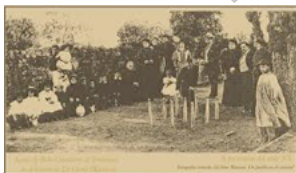
Imagen 13: Juego del pasabolo losa a principios del siglo XX

La revitalización del Pasabolo Losa pasa por una coordinación de iniciativas y esfuerzos entre los miembros del colectivo de peñas, jugadores, ayuntamientos, Federación y, en última instancia, pero no con menos responsabilidad, a través de la Consejería de Cultura y Deporte del Gobierno Regional como garante de las manifestaciones de la idiosincrasia y la cultura de una comarca concreta de esta comunidad. Como he dicho, el futuro del juego pasa por la captación de jugadores desde las edades más tempranas mediante Escuelas de Bolos y competiciones escolares, para lo cual se necesita el apoyo de los estamentos citados.