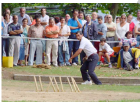
Imagen 11: competición de pasabolo losa

Cada jugador de los dos equipos lanza una bola óvala de madera de encina desde la elevación situada en un extremo de la bolera (zona de tiro o pas de tiro ) con el fin de golpear los bolos y proyectarlos fuera de la raya. Por cada bolo que rebase la línea se contará un valor de 10. Si algún bolo no logra superar la raya, este tendrá una puntuación de 1 por cada bolo derribado. Si desde el Tiro la bola da exclusivamente al bolo central y lo derriba, este vale 2 y si lo saca de la raya vale 11. A continuación se realiza el birle, es decir, se lanza de nuevo la bola donde esta se ha detenido y en esta acción tiene que tocar la tierra situada antes de la losa. Cada bolo derribado en el birle