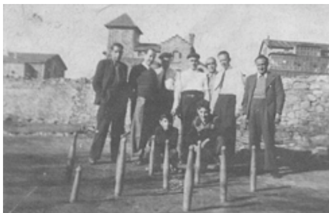
Imagen 2: Peña bolística

localidades como Gama o Seña (Laredo). La consolidación de esta unidad geográfica y administrativa en la Trasmiera actual contribuyó a la conservación del juego mediante la unidad etnográfica existente en la citada zona.