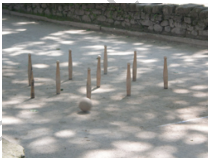
Imagen 6: Bolos y bola