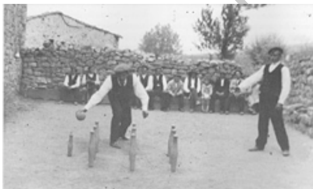
Imagen 1: Partida de pasabolo losa

La modalidad de Pasabolo Losa o Ruedabrazo o Pasabolo Trasmerano debe la primera de sus denominaciones a la superficie en que se encuentran ubicados los bolos -una piedra lisa- y al movimiento rotatorio que efectúa el brazo a la hora de impulsar la bola que impactará en los bolos. La segunda de las designaciones responde al área geográfica donde se practica esta modalidad: la comarca de Trasmiera en Cantabria.