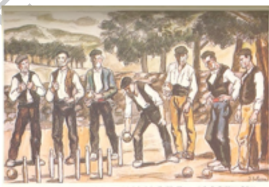
Imagen 4: Juego de bolos

Otras investigaciones determinan que ya en el S. XIII, en territorio francés, un juego llamado carreu donde, servía de meta un objeto puntiagudo levantado sobre una piedra cuadrada. Así, esta actividad consistiría en una piedra con marcas para ubicar bolos, dato fundamental que descubre un tipo de bolo losa que se introduciría en la Península Ibérica por el suroeste de Francia siguiendo el camino francés de las peregrinaciones a Santiago.