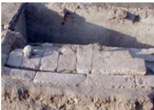
Imagen 3: Bolera egipcia

Otra hipótesis atribuye al juego un origen céltico en tanto que identifica la génesis del juego con la cultura romana que lo introduciría en Europa y concretamente en España a través de sus conquistas. Esta teoría contextualiza el juego de los bolos en lo que se ha denominado la cultura mediterránea.