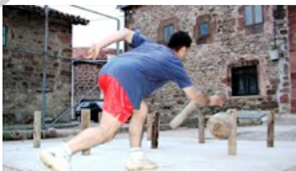
Imagen 12: tiro de pasabolo losa

3.4 EL TIRO: En la acción de tiro el jugador realiza un giro de tronco, con el brazo desplegado hacia atrás, tomando como eje de giro la columna vertebral y manteniendo el eje de caderas en posición perpendicular a la losa, donde están ubicados los bolos.