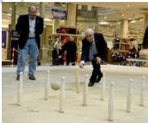
3. Edad en el birle