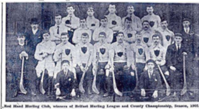
Ilustración 3 .Red Hand Hurling Club 1902

La primera Guerra Mundial en 1914 hizo que la actividad decaiga, principalmente por la imposibilidad de importar los hurleys. Se hicieron intentos con madera de "serbal" (tipo de Fresno) pero fracasaron, por ser estos demasiado duros y tener muy poca