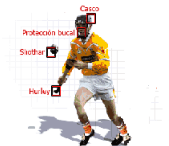
Ilustración 9. Equipamiento.

El uniforme de hurling no es muy diferente al que utilizarías en otros deportes como el fútbol, el rugby o el hockey. Es un deporte rápido y con bastante contacto físico, así que tienes que estar preparado a recibir unos cuantos golpes cuando