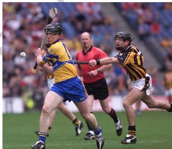
Ilustración 8. Partido de Hurling.