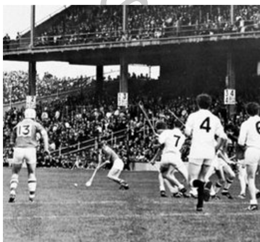
Ilustración 4. Practica de Hurling.

Toda esta década resultó muy intensa, con muchos encuentros y muchos adeptos, pero con la llegada de la Segunda Guerra Mundial en el año 39, nuevamente se hace imposible importar hurleys. Aunque también influyó el conflicto Irlanda - Inglaterra, en esta decisión. En esta segunda ocasión el Hurling desaparece completamente hasta nuestros