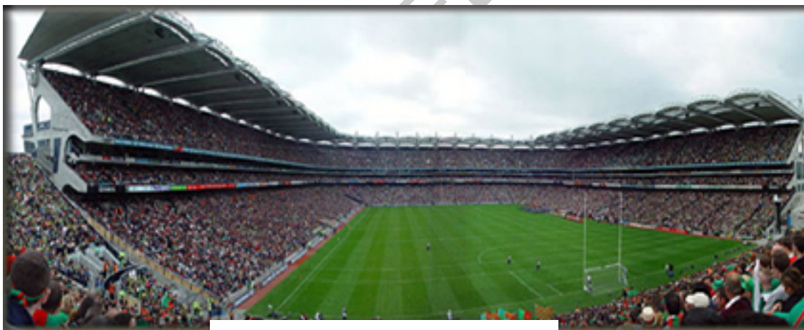
Ilustración 6. Estadio "Croke Parck"

En la actualidad, cada una de las 32 regiones de Irlanda posee su propio equipo y todos los septiembres se juegan las Finales "All Ireland" de fútbol y hurling en el estadio de Croke Park, Dublín. El recientemente modernizado estadio de Croke Park, acoge a multitudes de seguidores, y con una capacidad de más de 80.000 espectadores rivaliza con cualquier otro estadio del mundo.