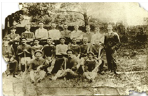
Ilustración 2. Tournafulla Hurling Team around 1900-1910

El primer partido considerado "Oficial" se jugó el día 5 de Agosto de 1900 en lo que hoy es la actual Plaza Irlanda en Capital Federal. Este partido se hizo con 9 jugadores por lado, debido a que esta era la cantidad de palos (hurleys) que pudieron conseguir. El partido demoro 2 horas en comenzar, ya que todos querían jugar y nadie se