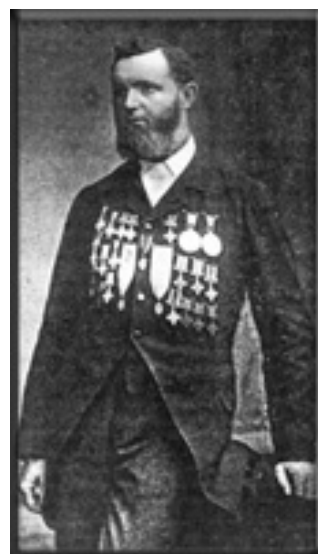
Ilustración 1. Maurice Davin.

En la Irlanda de 1884, la cultura, el idioma y los entretenimientos estaban cínicamente controlados por una asociación inglesa que excluía a las masas de las competiciones que aún tenían lugar. Maurice Davin (del condado irlandés de Carric on-Suir ), que llegaría a ser el primer presidente de la Asociación de Deportes Gaélicos (GAA), escribió entonces: "las leyes bajo las que se sitúan los deportes gaélicos en Irlanda fueron diseñadas por y para ingleses, y no tienen en consideración