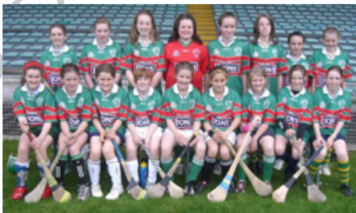
Ilustración 5. Lisnagry School Camogie Team 2010

Luego después casi 70 años, el Hurling Club vuelve a practicar este deporte. En los primeros tiempos, el objetivo es aprender y dejando de lado el concepto competitivo, el club busca con esta actividad seguir apoyando la recreación y formación de los jóvenes participantes. A partir del 2010, está previsto la creación de más equipos, esperando que también sea una disciplina para los adultos que quieran participar.