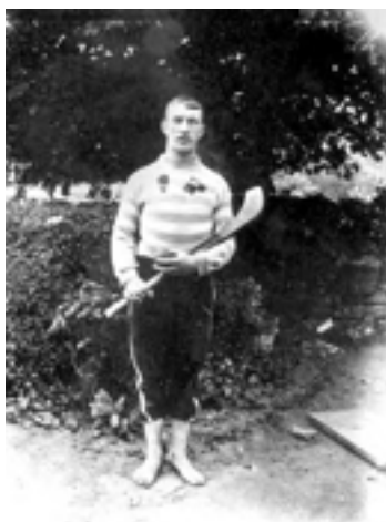
Ilustración 2. Antiguo Jugador de Hurling.

Dentro de los entretenimientos se encontraban deportes tales como el Atletismo, el Hurling o el Fútbol Gaélico.