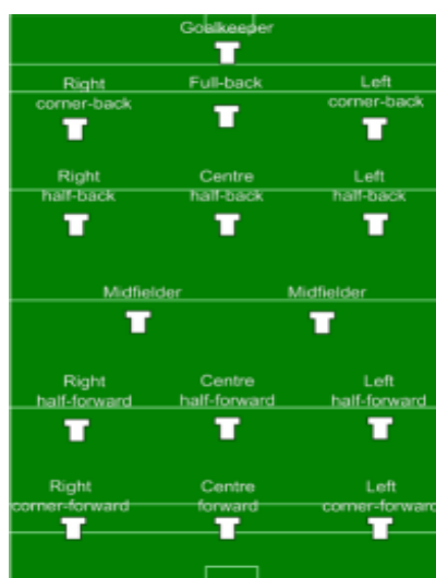
Ilustración 7. Distribución de jugadores

Los encuentros o partidos realizados entre los dos equipos tienen una característica muy distintiva de cualquier otro deporte, ésta es la rapidez de su juego en donde se puede apreciar una constante lucha entre los enfrentados, por lo cual se puede ver en un juego de Hurling una gran movilidad entre los jugadores, gran fuerza y un impresionante despliegue físico. Pero cabe resaltar que dentro de las reglas básicas de este deporte de origen celta se prohíbe el contacto físico entre los jugadores pero cuando se realizan estrategias de recuperación de la bola siempre se pueden ver pequeños contactos entre el jugador que tiene la bola en su poder y el stick del contrario que busca la recuperación de la misma.