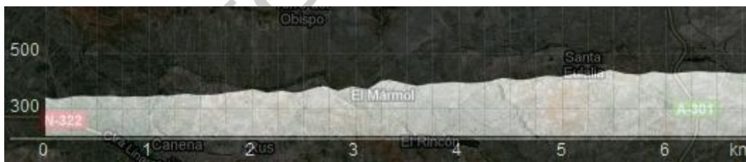
Imagen; N° 7