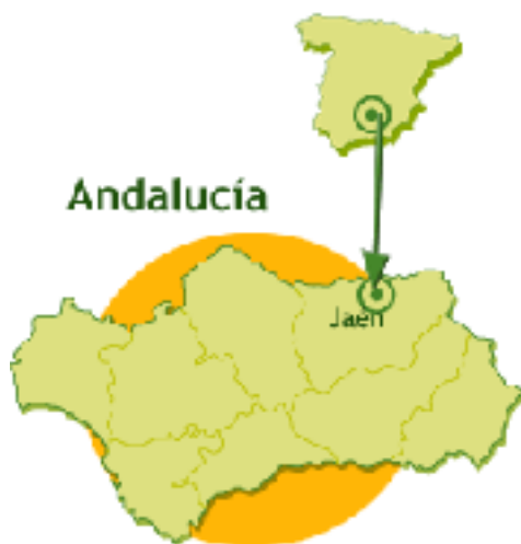
Imagen; Nº 1