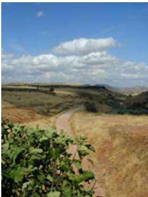
Imagen; Nº 2