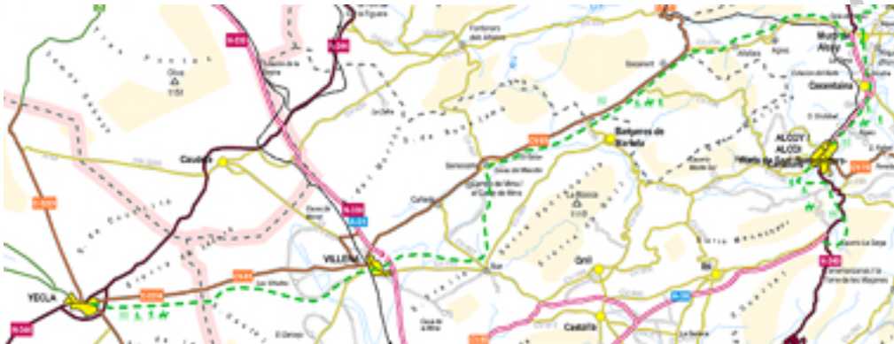
Imagen 2. Mapa Vía verde Xixarra