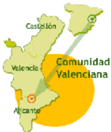
Imagen 1. Itinerario Vía verde Xixarra tramo III