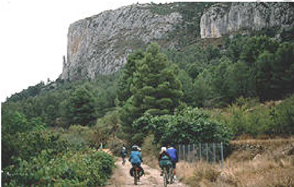
Imagen 4. Flora Vía verde del Xixarra tramo III

Castillos de Villena, Biar y Banyeres. Viaductos de Alcoi. Cascos antiguos de Bocairant, Villena y Biar.