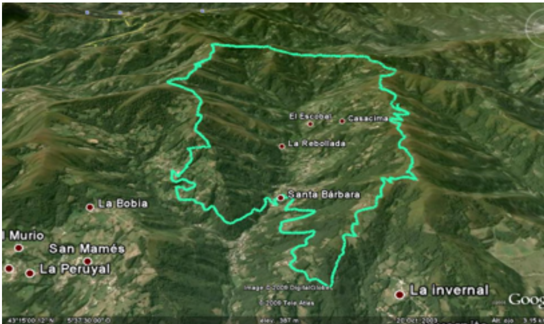
Figura 3. Mapa de la via