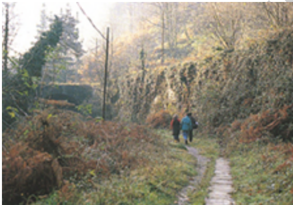
Figura 1. Senda de la via verde

Sin caminar más de 100 metros se adentra en el entorno de bosques y prados, o podrán darse un paseo por la vera del Río Santa Bárbara, o subir al mirador de la Polaura, les hará revivir el