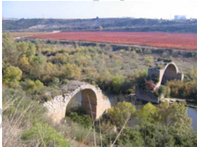
4. el puente romano Mantible

Como lugares interesante para visitar hay que señalar: La Iglesia parroquial, antiguas bodegas, el puente romano Mantible S II a. c y el mirador.