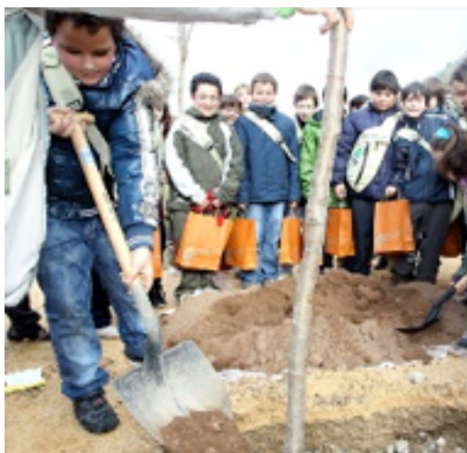
7. Alumnos del centro escolar Vicente Ochoa

organizada por la administradora de infraestructuras ferroviarias en este evento se plantó todo tipo de árboles y especies vegetales tales como: arbustos almendros, pinos y encinas. El objetivo de esta actividad fue mejorar el paisaje y reducir el CO 2 contó con la participación de jóvenes de 5º y 6º de primaria del centro escolar Vicente Ochoa. (www.rioja2.com)