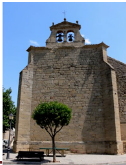
5. Iglesia parroquial