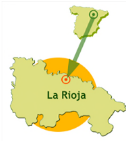
1 mapa de La Rioja