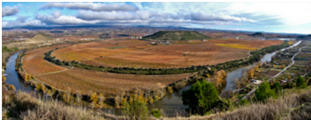
6. meandro del río Ebro