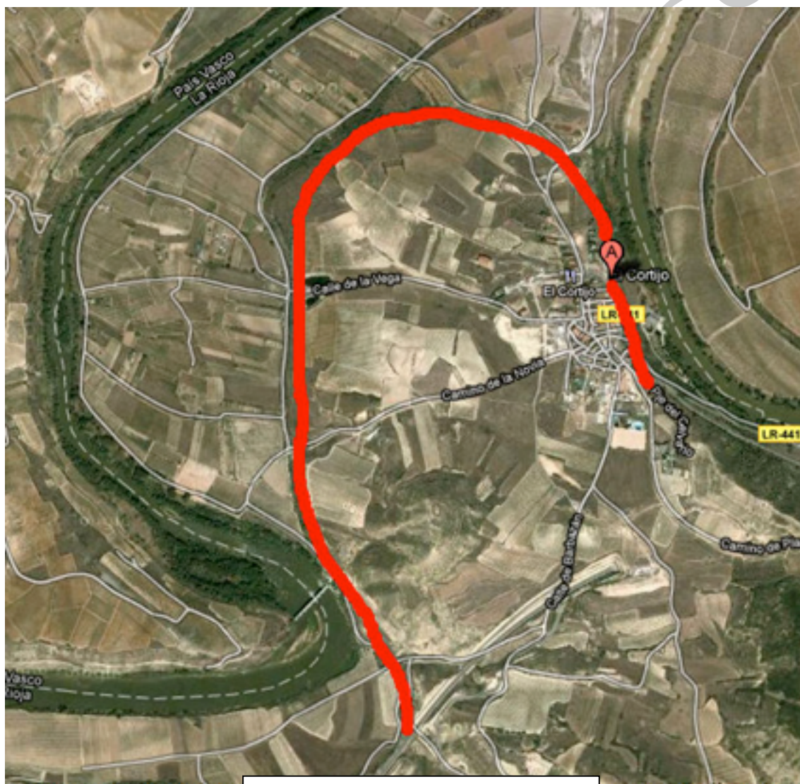
2. mapa de la vía verde el cortijo