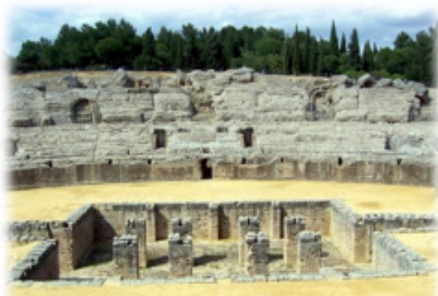
3. Yacimiento Arqueológico de la Vía Verde

En el kilómetro 3 comienza la Vía Verde Itálica. En el kilómetro 3,5, la vía verde pasa por debajo del viaducto de la línea de ferrocarril Sevilla-Huelva. Si usáis bici, debéis desmontar en ese tramo, ya que aún aquí hay muchas travesías de ferrocarril y caminos de grava. En el kilómetro 5, tras Santiponce, llegamos al YACIMIENTO ARQUEOLÓGICO DE ITÁLICA. Si deseáis tomar un desvío para visitarlo, debéis tomar la N-630 norte hasta Guillena.