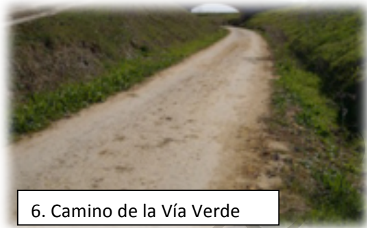
6. Camino de la Vía Verde

Si hay algo que caracteriza la Vía Verde de Itálica es la espectacularidad de su paisaje y la diversidad de especies. Durante todo el recorrido es muy frecuente que nos encontremos multitud de aves, principalmente cigüeñas blancas, milanos, mochuelos y aguiluchos cenizos. Para los amantes de la naturaleza esto