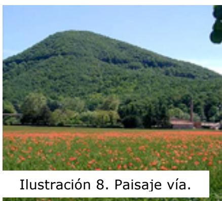
Ilustración 8. Paisaje vía.