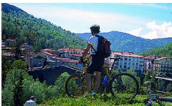
Ilustración 5. Vistas de la venta en los puntos de información de la ruta y en la web.

Bajo el título "Los Secretos de las Vías Verdes" el Consorcio de Vías Verdes de Girona ha editado sendas guías sobre las Vías Verdes del Ferro i Carbó, Carrilet I y Carrilet II. Con las Vías Verdes de Girona como eje, las guías nos proponen