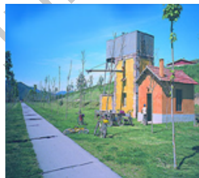
Ilustración 2. Descanso

Infraestructura: Vía Verde. 3 puentes. 1 túnel. Cómo llegar: Ripoll, Media Distancia de Renfe, línea Barcelona-Puigcerdá. (*) Consultar las condiciones de admisión de bicicletas a bordo de los trenes.