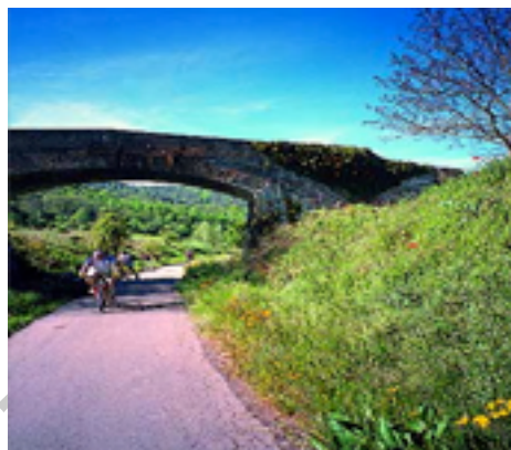
Ilustración 4. Puente en la vía

Al otro lado del túnel, la vía abandona momentáneamente la vecindad del río. En esta zona se ha asfaltado todo el ancho de la vía, permitiendo el tránsito de vehículos rurales hacia algunas masías próximas, fincas que se aprovechan ahora del magnífico puente de hierro que el ferrocarril usaba para cruzar el Ter. Este puente, situado a 6 Kms. de Ripoll, se ha adaptado para el paso de vehículos, junto a los cuales cruzaremos a buena altura el sobrado