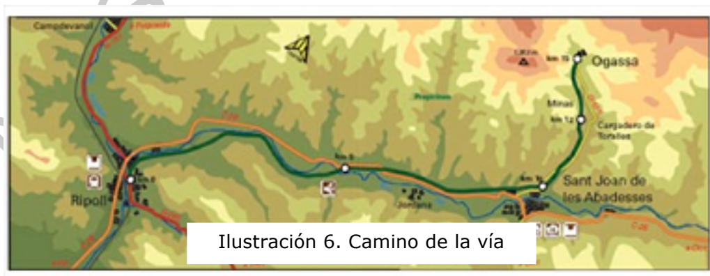
Ilustración 6. Camino de la vía

En este mapa podemos observar los kilómetros de trayecto que sigue esta vía y los pueblos del primer y último kilómetro.