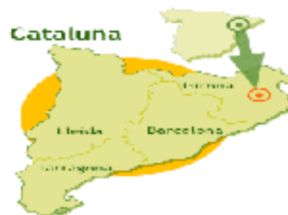
Ilustración 1. Mapa

Monasterio de Sant Joan, Iglesia de Sant Pol y Puente Gótico en Sant Joan de les Abadesses.