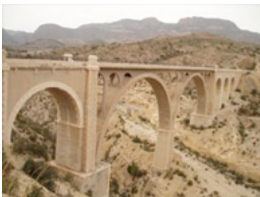
Imagen; Nº 5

Tras un nuevo paso a nivel con un camino agrícola asfaltado, la vía, flanqueada nuevamente por palmeras, se interna en una de las trincheras más impactantes del recorrido (km 9). Realizando una amplia curva hacia la izquierda, la altura de las paredes arcillosas de este desmonte y dos armoniosos arcos pertenecientes a sendos pasos superiores de caminos agrícolas serán toda una bendición si el sol aprieta. Este paraje es conocido en la zona como Plá Aceituna .