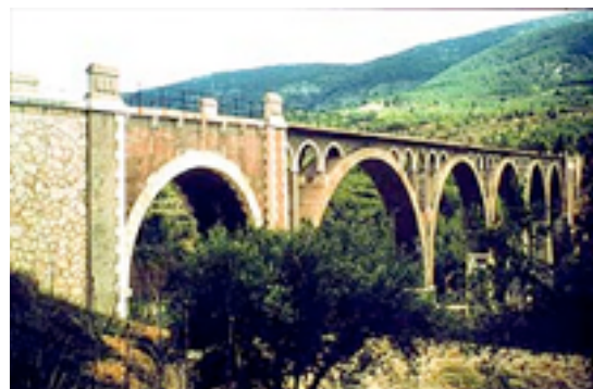
Imagen; Nº 2