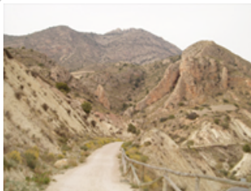
Imagen; Nº 6

Entre ramblas y el dominio del pino carrasco, nos topamos en los km 14, 7 y 15,7 con los siguientes túneles, que se correspondían con los túneles 22 y 23 de los 24 túneles que llegó a tener el antiguo ferrocarril de Alicante a Alcoi.