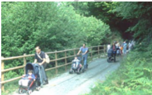
Ilustración 8. Camino a Andoain.

Cambia también el paisaje, que se va cerrando progresivamente en paralelo a las aguas del río Leitzarán. A 1 km de la muga, y a 50 metros de la Vía Verde, se encuentran las Minas del Plazaola o Bizkotx, minas que dieron origen al ferrocarril del Plazaola. Muy recomendable la visita para los amantes de la arqueología industrial.