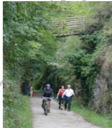
Ilustración 7. Camino a Leitza

La estación de Plazaola, el primer término del ferrocarril minero, coincide con la muga , la linde entre Navarra y Guipúzcoa, que supone también el fin de la Vía Verde acondicionada. El resto de la ruta prosigue por un trazado transitable sin dificultad (aunque sin acondicionar) hasta la localidad de Andoain. No obstante, en breve, esta parte del recorrido por tierras vascas, regalará las mismas bondades que el tramo navarro, gracias a las labores de recuperación que está llevando a cabo el Ayuntamiento de Andoain. Prueba de ello es la reciente iluminación de los túneles del tramo guipuzcoano.