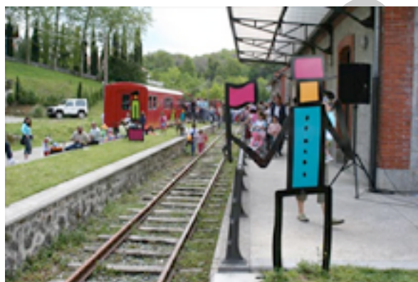
Ilustración 13. Estación de Uitzu.

Lekunberri desde Pamplona y San Sebastián por A15