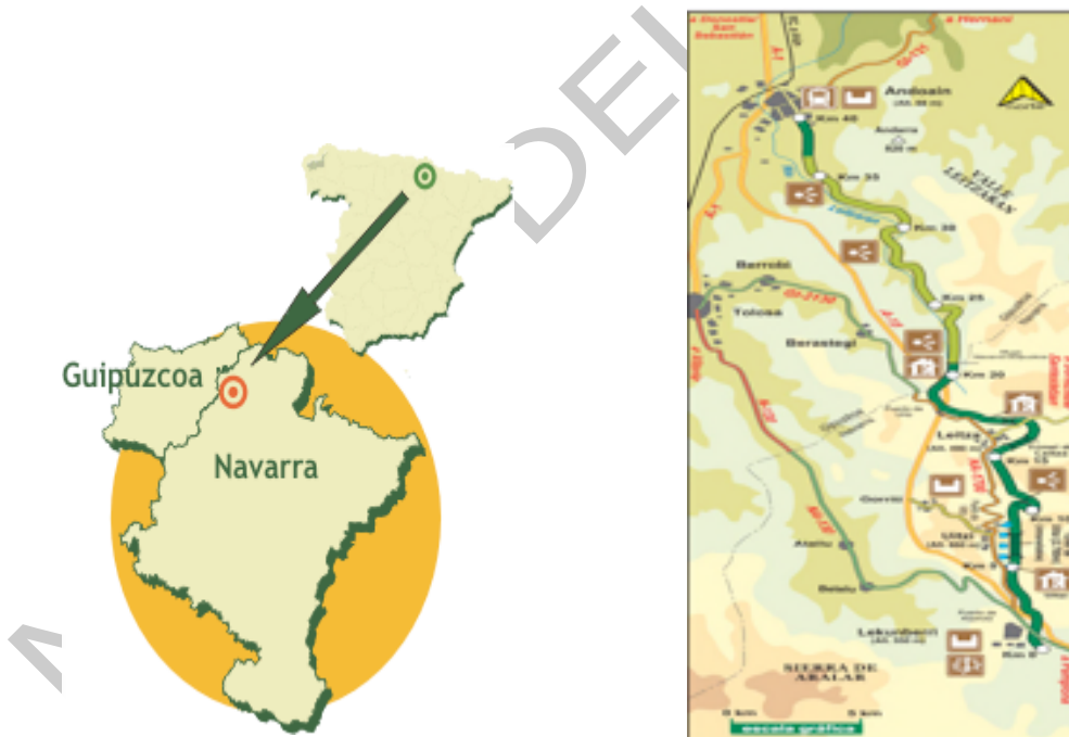
Ilustración 10. Mapa de la vía verde