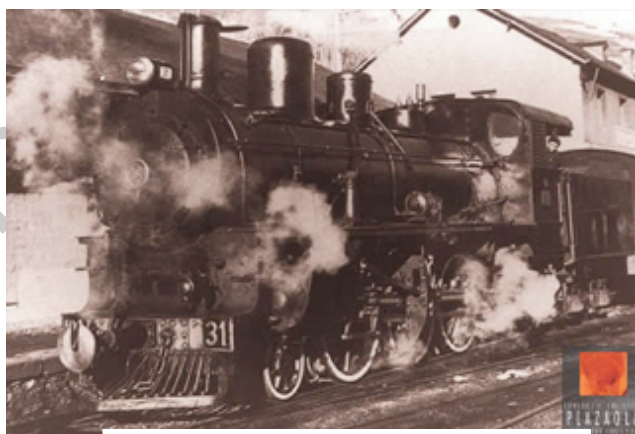
Ilustración 1. Tren del Plazaola

Este primer trazado fue el soporte para una ulterior ampliación en 1914 hacia San Sebastián y hacia Pamplona. El nuevo ferrocarril, de ancho métrico, se diseñó para viajeros y mercancías, teniendo siempre una modesta historia. Tras la guerra civil la situación económica de este ferrocarril, que no era muy espléndida, fue tornándose crítica. Por fin, las riadas del año 1953 se llevaron algunos puentes del ferrocarril y parte de la vía, circunstancia que sirvió como excusa definitiva para el cierre del ferrocarril.