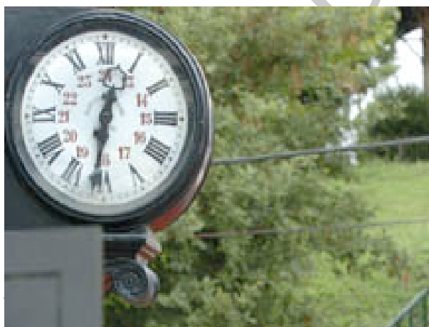
Ilustración 4. Reloj de la estación del Plazaola

Situamos el punto de inicio en la capital del valle de Larraun, concretamente en la estación de Lekunberri. Restaurada con mucho gusto acoge la Oficina de Turismo y el Consorcio Turístico del Plazaola, un buen lugar sin duda, para aprovisionarse de buena y práctica información sobre la Vía Verde y toda esta zona. Y otro aliciente más (sobre todo para los más pequeños): en el mismo entorno de la estación se ha recuperado un antiguo