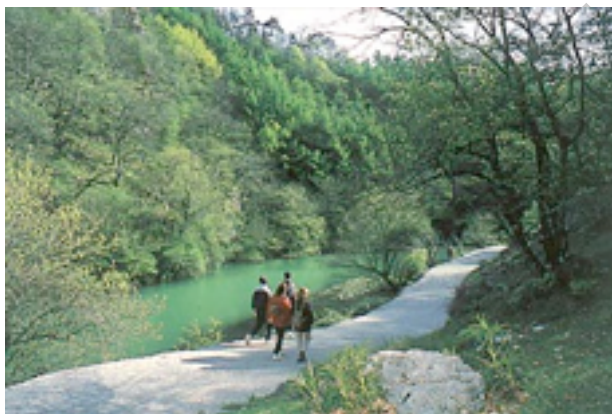
Ilustración 5. Camino por el valle de Larraun

En el Km 5 encontramos los primeros edificios de la estación de Uitz, situada en la entrada del túnel del mismo nombre, de 2,7 km. Tras dos años cerrado por las obras de recuperación finalmente