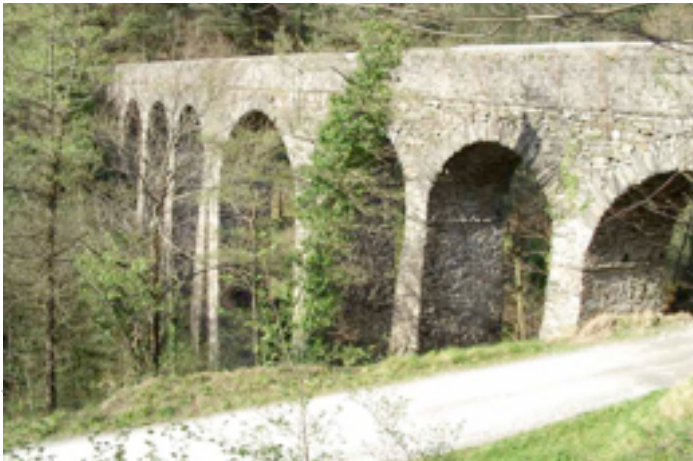
Ilustración 3. Acueducto de Ameraun.

GOBIERNO DE NAVARRA.- Sistema de Información territorial de Navarra SITNA