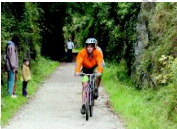
en Ilustración 15. Paseo cicloturista.

Se establecieron, un primero, segundo y tercer premio en metálico, de 600, 500 y 400 euros, respectivamente, así como 10 accésit consistentes en un lote promocional de Vías Verdes (DVDs, Guías de Vías Verdes, camisetas, etc.) valorado cada uno de ellos