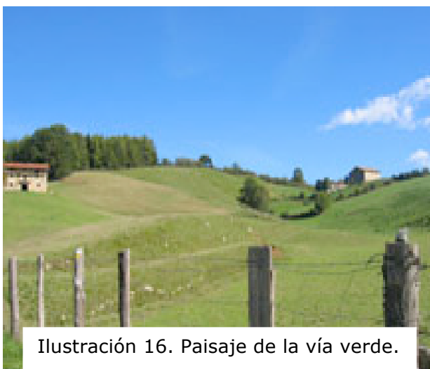
Ilustración 16. Paisaje de la vía verde.

Almonzar en Olloki y meta en el CVL hacia las 12:00 h. Paseo de unos 20 km de ligera subida la mitad y ligera bajada la segunda mitad.