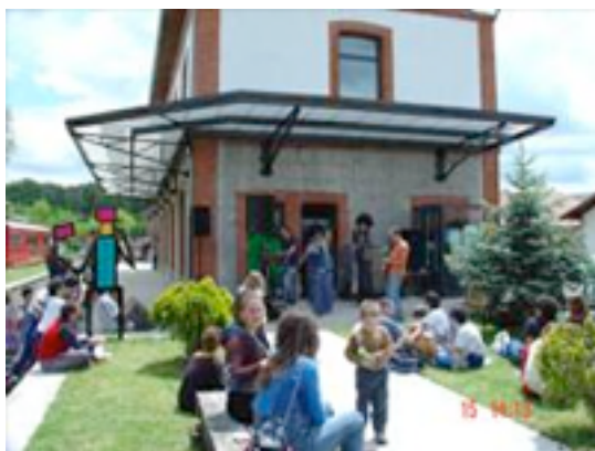
Ilustración 6. Estación de pueblo de casonas de piedras y ornamentos de flores. Otros dos túneles, también iluminados, nos darán paso al túnel de Tellería, que actualmente se encuentra hundido. Tras varios años descendiendo a una carretera para retomar la traza original, finalmente el verano del 2010 se abre un camino alternativo al túnel sin desnivel ni peligro para los usuarios.

Al otro lado del túnel se encuentra la estación de Leitza, con dos de sus edificios rehabilitados en 2009. Se prevé un uso turístico de los mismos para 2012.