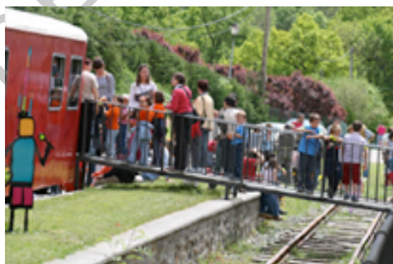
Ilustración 12. Visita al tren del Plazaola