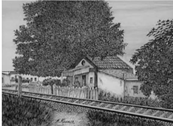
Imagen 2 Casa guarda

denominado "La Rehierta" hasta Sanlúcar, unos 4 Km. de raíles.