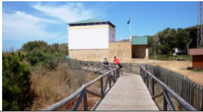
Imagen 7 Sendero peatonal Rota-Punta Candor

Ya en el Pinar de la Costa, el Ministerio de Medio Ambiente, ha construido un sendero peatonal de madera que se adentra en el extenso y largo pinar hasta Punta Candor. La prohibición de ciclar por sendero es patente en tanto en cuanto se nos llama la atención por parte de la Policía Local de Rota, lo que nos lleva a modificar el itinerario previsto.