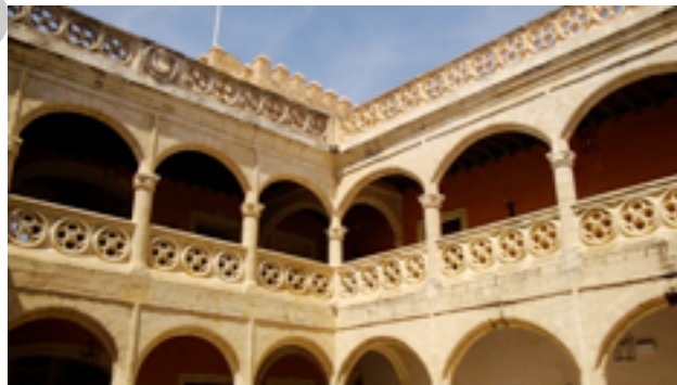
Imagen 6 Patio interior del Castillo de Luna, Rota

La placa data de 1892 y se encuentra en uno de los muros de la actual Casa Consistorial o Castillo de Luna. Junto a la misma, encontramos la reproducción en bronce de una carabela que recuerda a los otros tantos marineros de la ciudad que vivieron la aventura del Nuevo Mundo. Realizamos una nueva parada en esta ocasión para contemplar el interior del Castillo Palacio de Luna, mandado a construir por Alfonso Pérez de Guzmán "El Bueno" (1295-1303), sobre los restos de un ribat musulmán del siglo XI (un lugar consagrado por los musulmanes a la oración como lo son los monasterio cristianos) y que pasó a ser propiedad de la familia Ponce de León, al constituirse el castillo como dote matrimonial de la hija de Guzmán "El Bueno" con Fernán Ponce de León. Desde entonces, el Castillo de Luna perteneció a la familia Ponce de León hasta que en 1909, hace ahora 101 año, el Marqués de San Marcial lo compró por 15.000 pesetas (90€) para usarlo como residencia de verano. El alcalde de Cádiz, José Ramón de Carranza, lo compraría en 1943 acondicionándolo como Hospital para las monjas de María Auxiliadora, quienes lo donaron al Ayuntamiento de Rota en 1982.