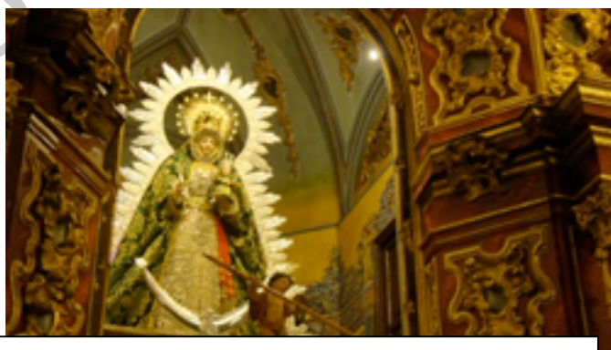
Imagen 4 de la Virgen Nuestra Señora de la