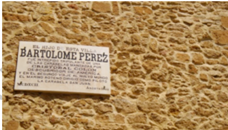
Imagen 5 Placa IV Centenario descubrimiento

Junto a la Iglesia de la O encontramos una placa conmemorativa que nos recuerda la ligada historia de la ciudad de Rota con el descubrimiento de América, de donde fueron muchos de los marineros que se embarcaron en tal épica aventura. Entre ellos uno muy joven que llegó al Nuevo Mundo en la carabela "La Niña" y que un año después volvería a Rota para tripular, una de las 12 carabelas de Cristóbal Colón -la carabela San Juan- durante su segundo viaje al Nuevo Mundo: Bartolomé Pérez.