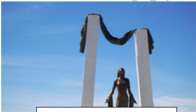
12 Monumento a la cantante Rocío Jurado, Chipiona

El faro de Chipiona que hoy visitamos con nuestras bicicleta desde Rota es el más alto de España y uno de los más alto de Europa. Su altura aproximada desde la base es de 69 metros, 62