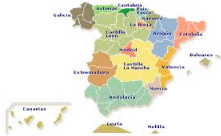
15-2 Localización de la vía verde