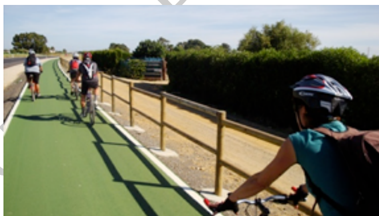
14. Carril bici desde Costa Ballena-Rota, paralelo a la carretera Chipiona-Rota-El Puerto