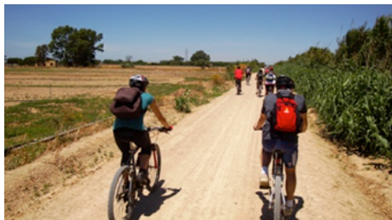
9 Camino Natural de Rota o Vía Verde de la Costa Rota-Chipiona

Dejamos la playa y nos adentramos de nuevo por el pinar un par de kilómetros hasta llegar a una bolsa de aparcamiento. Desde aquí iniciamos una marcha por carretera hasta cruzarnos con las vías pecuarias Camino de las Cañas e Hijuela de los Atunes, buscando el antiguo trazado del ferrocarril de la Costa o también llamado Camino Natural de Rota o Vía Verde de la Costa Rota-Chipiona. Una vez en él, lo seguimos todo recto hasta Chipiona.