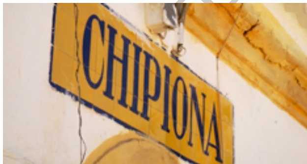
3El grupo junto al Castillo de Luna, en Rota.

Así que propuse recorrer en bicicleta la Costa Noroeste de Cádiz, la franja de litoral entre la Rota y Chipiona visitando los siguientes hitos monumentales y naturales: la Iglesia de la O, el Castillo de Luna, la playa de la Almadraba y los corrales de pesca de Rota, el antiguo trazado del "tren de la Costa" así como el Santuario de Nuestra Señora de Regla y el Faro de Chipiona. A 12 amigos deruteros les gusto mi propuesta. Un recorrido de unos 50 Km. aprox. en bicicleta que nos llevará buena parte del día por senderos de madera, vías pecuarias y calles céntricas de ambas localidades.