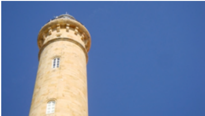
11. Faro de Chipiona

entrar en él. Por este motivo y desde tiempo muy remotos, los habitantes de esta zona sintieron la necesidad de construir una torre o faro que sirviera de orientación y dirección a los navegantes para poder tomar la entrada al río.