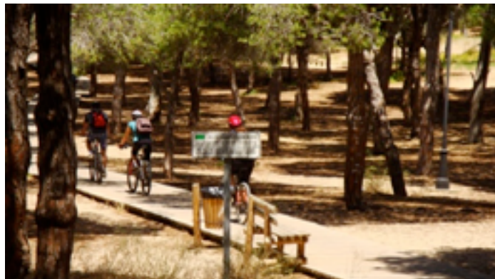
Imagen 7-2 Sendero peatonal Rota – Punta Candor

interior del recinto. Cuando se produce la bajar, los peces se encuentran atrapados en unas pequeñas lagunas puesto que el agua ha salido del corral por unos pequeños caños practicados en sus paredes al efecto. Así, el corralero (el mariscador), sólo tiene que capturar los peces que cree convenientes en estas pequeñas lagunas.