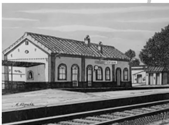
Imagen 1 estación de chipiona

En junio de 1852 se recibe en el Ayuntamiento de Chipiona un escrito del Gobernador de la Provincia en el que pedía se suscribiera nuestro municipio al Ferrocarril de Sevilla. La Corporación, acuerda que en vista de lo provechoso que para Chipiona sería este proyecto, se podría vender para colaborar en este proyecto "El Pinar de la Villa o la Dehesa de yeguas y potros".