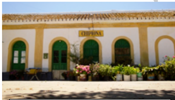
10 Estación de ferrocarril de Chipiona

Ya en Costa Ballena optamos para la el viaje de ida seguir los pasos del antiguo ferrocarril. La Vía Verde de Chipiona-Costa Ballena por más que nos la quieran vender, dista mucho de lo que debe ser una vía verde. El paseo no es cómodo por las numerosas piedras de tren (las que se utilizan para sujetar las vías) que aún existen sobre el trazado. No obstante es una opción viable en tanto en cuanto nos quita del intenso tráfico entre Chipiona y Costa Ballena.