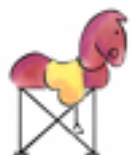
Figura 11 Vías verdes. www.google.es/imgres?imgurl=http://www.viasverdes.com

altimétrico. http://www.google.es/imgres?imgurl=http://www.lacoctelera.com