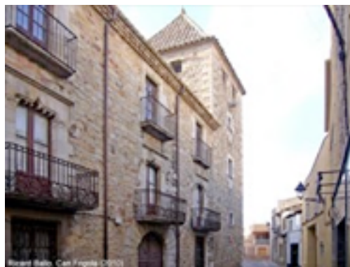
Figura nº 15

El castillo de Cassà (castrum de Catiano) es documentado el 1116. El 1352 debía de pertenecer al rey porque este año Pere III vendió a la ciudad de Girona la jurisdicción del castillo de Cassà para redimir