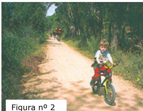
Figura nº 2

El recorrido sobre el antiguo trazado del carrilet de Sant Feliu tiene su inicio en el corazón de la capital provincial, Girona, en la calle Emili Grahit, junto a la glorieta de los Països Catalnas. Desde este punto, el itinerario abandona la ciudad junto a las aguas del Onyar.