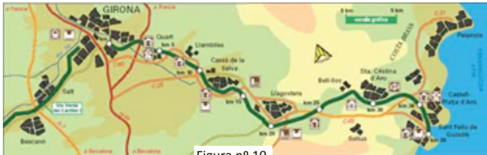
Figura nº 10