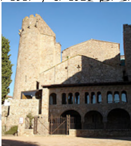
Figura nº 20