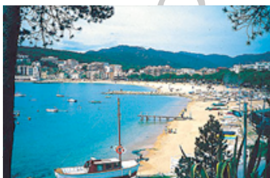
Figura nº 9

En un futuro este tramo será recuperado. Entonces, el viajero