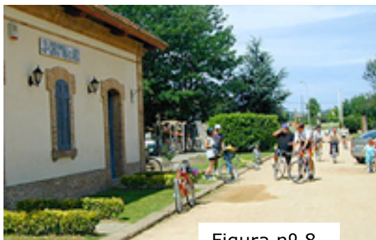
Figura nº 8

penúltima etapa: Castell d`Aro. El perfil del campanario y las almenas del castillo dan la pista de esta localidad, cuya pequeña estación, situada en el km 35, reserva una de las sorpresas más gratas del recorrido.