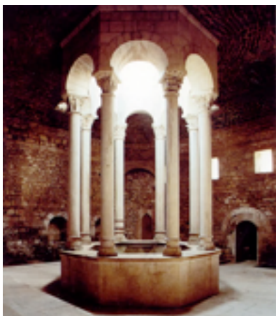
Figura nº 13