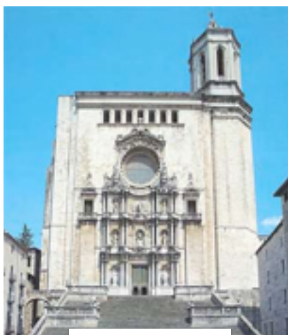
Figura nº 12