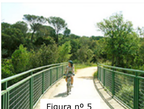
Figura nº 5

Llebrers (km 10). Finalmente se alcanza el polígono industrial de Cassà de la Selva, que se cruza por un carril bici en color verde, sobre la acera, que da acceso al centro de la población. Allí se encuentra la Estación de Cassà de la Selva (km 14) que, como en los otros casos, aombra por su impecable estado de conservación. Algunas traviesas ferroviarias definen los caminos