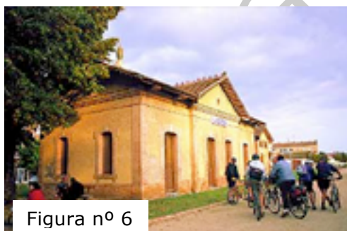
Figura nº 6

Tras superar el polideportivo, a unos 700m, la vía se topa con la carretera C-253, vial de elevado tráfico que ocupó un tramo de casi 3km del original trazado ferroviario. A pesar de la molesta y poco tranquilizadora vecindad de los coches, se ha construido un carril bici a orillas de la carretera que permite avanzar sin problemas. Desde aquí se podrá gozar de las incomparables perspectivas del infinito bosque que tapiza las quebradas montañosas vecinas.