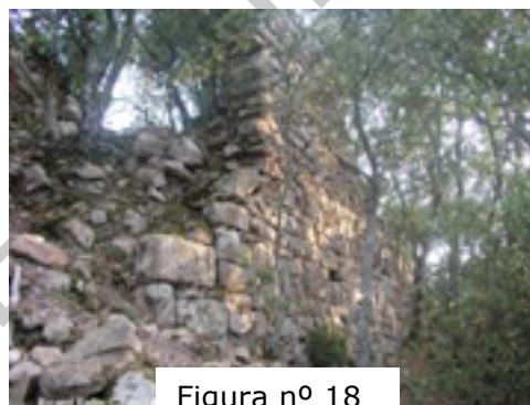
Figura nº 18