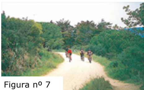
Figura nº 7

En medio de esta foresta, 9km más debajo de Llagostera, se