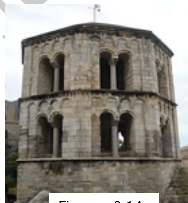
Figura nº 14

La iglesia de Sant Feliu acoge la capilla dedicada al santo patrón de Girona, Sant Narcís, conocido como el santo de las moscas por la aparición milagrosa de aquellos insectos que surgieron de su sepulcro que finalmente y según la leyenda, para expulsar las tropas francesas durante el sitio del año 1285.