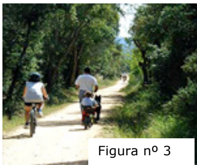
Figura nº 3

En 1.5 km se llega al Barrio de la Creueta, donde el ferrocarril también dio servicio a una fábrica de harinas. Desde aquí la Vía Verde sigue un recto terraplén que atraviesa una hermosa vega a orillas del Onyar, río al que se llega tras el esquivé que la Vía Verde hace de la autovía de ronda de Girona. En este punto, la vía verde ha propiciado la recuperación del antiguo puente ferroviario, desmantelado tras la clausura del ferrocarril y suplido por una nueva pasarela ahora para caminantes y ciclistas.