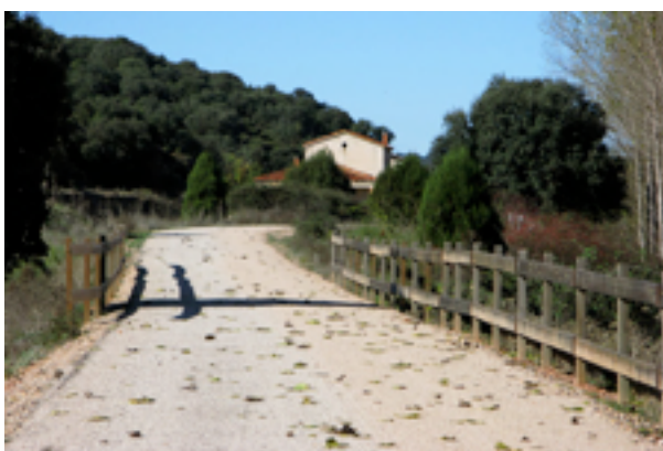
3: Tramo de vía

Es el objetivo del Programa Vías Verdes, desarrollado desde 1993 por el anterior Ministerio de Obras Públicas, Transportes y Medio Ambiente y actualmente por el Ministerio de Medio Ambiente y Medio Rural y Marino, en colaboración con ADIF, RENFE Operadora y FEVE. Participan muy activamente las Comunidades Autónomas, Diputaciones y Ayuntamientos, así como grupos ciclistas, ecologistas y colectivos ciudadanos.