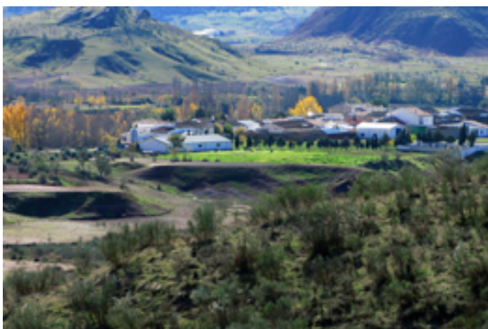
4. Detalle de pueblo desde la vía verde

Las coordenadas exactas en las que se encuentra la ruta son las detalladas a continuación. Estos datos son muy importantes a tener en cuenta para que en el caso de que ocurra algún tipo de accidente o suceso inesperado los servicios sanitarios y la guardia civil sepa donde localizarnos con rapidez.