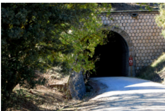
2. Entrada a túnel en la vía verde

El ferrocarril, el medio de transporte más ecológico, nos proporciona nuevas fórmulas de transporte no motorizado a través de los trazados ferroviarios que quedan fuera de servicio.