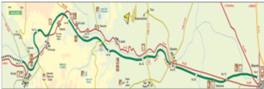
7. Mapa de la Vía