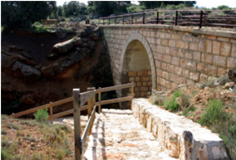
1. Detalle de puente

Según lo encontrado en la página web viasverdes.com relatamos lo siguiente. La Vía Verde de la Sierra de Alcaraz nos sitúa sobre el trazado ferroviario que debía unir las localidades de Baeza (Jaén) y Utiel (Valencia) y que fue abandonado durante su construcción, pero