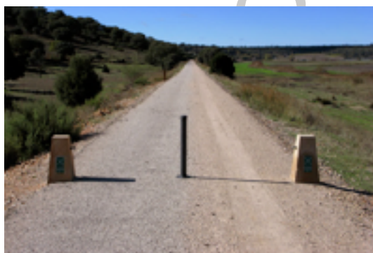
5. trazado de la vía

Antes de emprender camino, el viajero deberá descubrir alguna de las muchas sorpresas que le aguardan en Albacete, entre las que merecen destacarse la Catedral y el Museo Provincial, con importantes secciones de arqueología, etnología, artes decorativas y prehistoria.