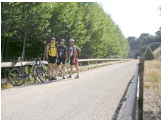
9. Grupo de ciclistas en la vía

Es recomendable para la travesía llevar agua, gorro para el sol, linterna y prismáticos, ya que pueden sernos útiles durante el transcurso de la ruta.