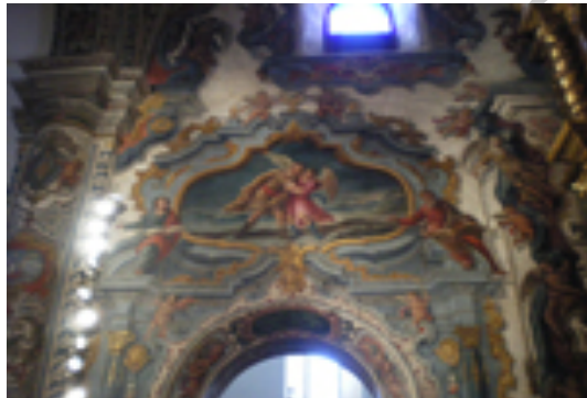
13. murales de J. Corbalán

Plaza de España: Cruz de forja sobre pedestal (fines S. XVIII). Situada en el eje central de la Plaza de España y frente al edificio del Ayuntamiento. Sobre pedestal con escalinatas de ladrillo visto y azulejos (de la misma época que las rejas del coro de la Iglesia Parroquial, la cual, fue realizada por Francisco Ibáñez en 1754).