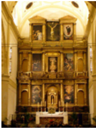
20. Retablo del altar mayor del siglo XVII

de construcción de este edificio debieron empezar en la segunda mitad del siglo XVI, finalizando en las primeras décadas del XVII. Con el nombre de