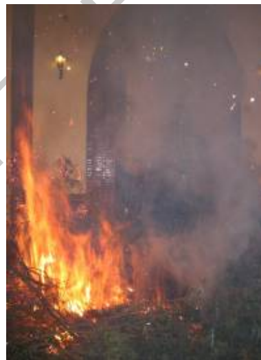
19. San Antonio Abad.

Una de las fiestas más importantes y singulares de Andalucía donde elementos religiosos y populares se entrecruzan, ofreciéndonos un bello espectáculo de participación y convivencia con tiradas de pan y otros artículos a la multitud, en ofrenda al Santo.