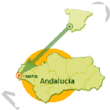
7. Mapa 2