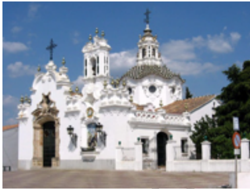
21. Ermita del Santo

barroca sevillana del siglo XVIII es un templo de estilo barroco de reciente