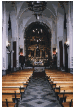
12. Iglesia San Juan Bautista

barrocas. Edificio que destaca por sus ricos elementos en imaginería, retablos, esculturas y orfebrería. Destacamos las pinturas de la capilla mayor que plasmó José Corbalán en 1781. Es uno de los monumentos erigidos con posterioridad a la fundación de la villa (1468).