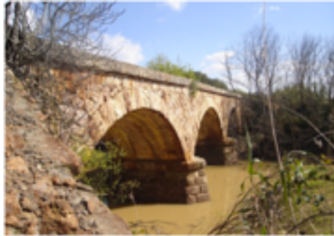
11. Puente romano

Puente Romano del Arroyo Candón (s. III): El Arroyo Candón es