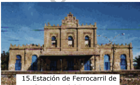
15. Estación de Ferrocarril de San Juan del Puerto.