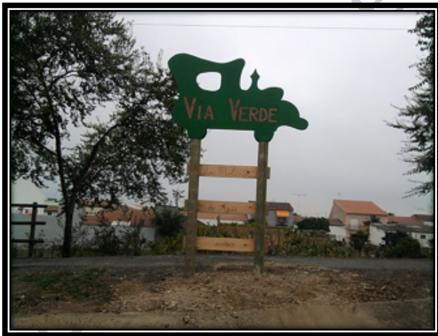
Ilustración 1. Los Molinos del