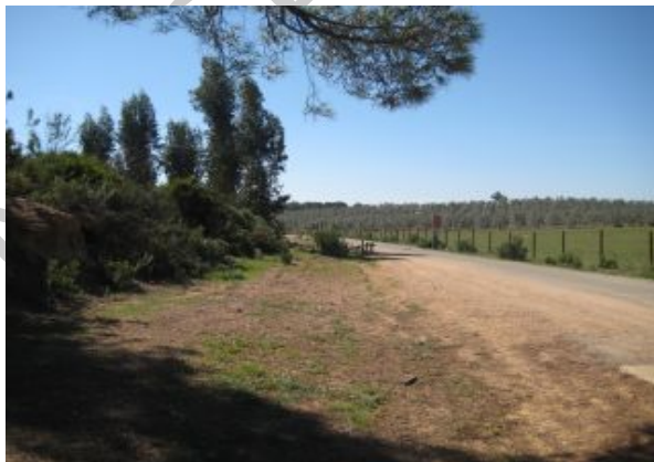
2. Trigueros-Valverde del Camino.

A partir de 2/3 del recorrido la vía verde aparece perfectamente acondicionada con una pista nueva realizada con alquitrán, que nos lleva hasta las inmediaciones del pueblo de Valverde del Camino.