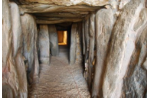
16. Dolmen de Soto.