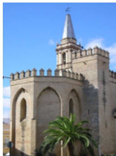
18. La Iglesia Parroquial de San Antonio Abad