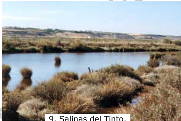
9. Salinas del Tinto.

Su denominación se debe a la producción en otros tiempos de sal marina. Este paraje, patrimonio de San Juan del Puerto, alberga una gran riqueza de fauna y