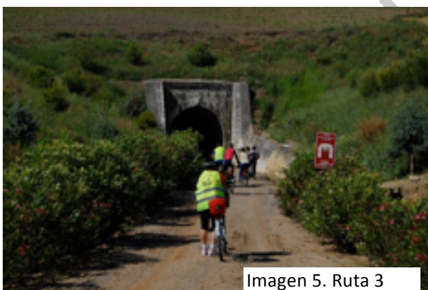
Imagen 5. Ruta 3

dispone de alumbrado por lo que aún a pesar de ser cortito, cuando se circula por la zona central puede resultar peligroso,