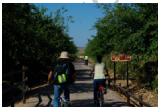
Imagen 3 Ruta 1.

Todos estos puentes son obras de gran simplicidad pero tienen una indudable marca estética de buen gusto. Los actuales puentes datan de la posguerra, época en la que fueron sustituidos los originales metálicos. Tras el puente, la ruta se interna en la Finca La Reina (a 2,5 kms de Valchillón), lugar donde la vía traza las primeras grandes curvas sobre las colinas, a través de las cuales el ferrocarril iba ganando la altura