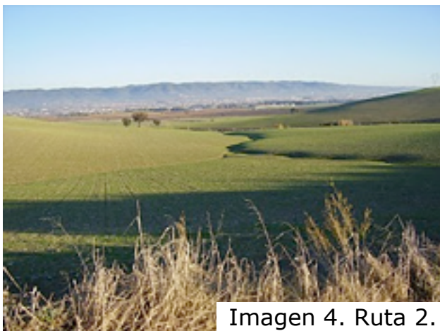
Imagen 4. Ruta 2.

En esta remontada se llega al primer y único túnel de la línea, el túnel de Las Tablas (km 6 del recorrido), el cual fue utilizado para el cultivo de champiñones. (Nota: Actualmente el túnel no