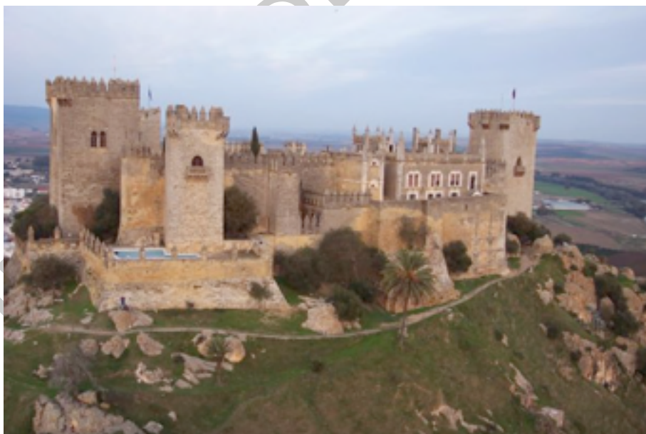
Imagen 12. del castillo.

Aproximadamente a la altura del km 9 de la Ruta, a la derecha del la vía se puede divisar a lo lejos la silueta del castillo de Almodóvar del Campo, en el municipio del mismo nombre, ya en la provincia de Ciudad Real.