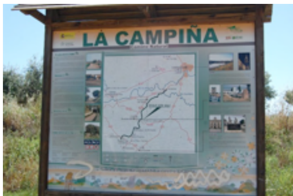
Imagen 2 Cartel.

Desde la estación de Valchillón la Vía Verde se abre camino hacia el sur. El trazado arranca al pie del alto silo de cereal, tomando como referencia la topera final de las vías. Dos kilómetros más