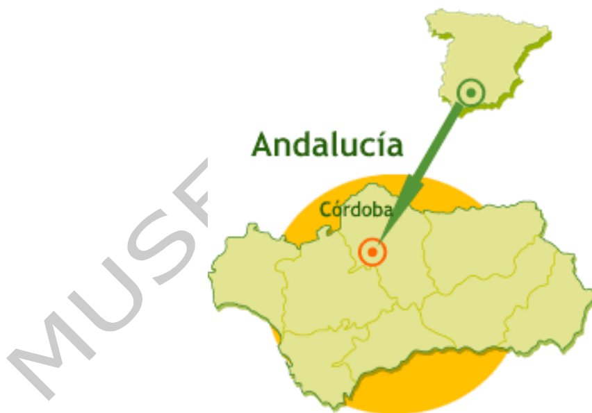
Imagen 10. mapa 2