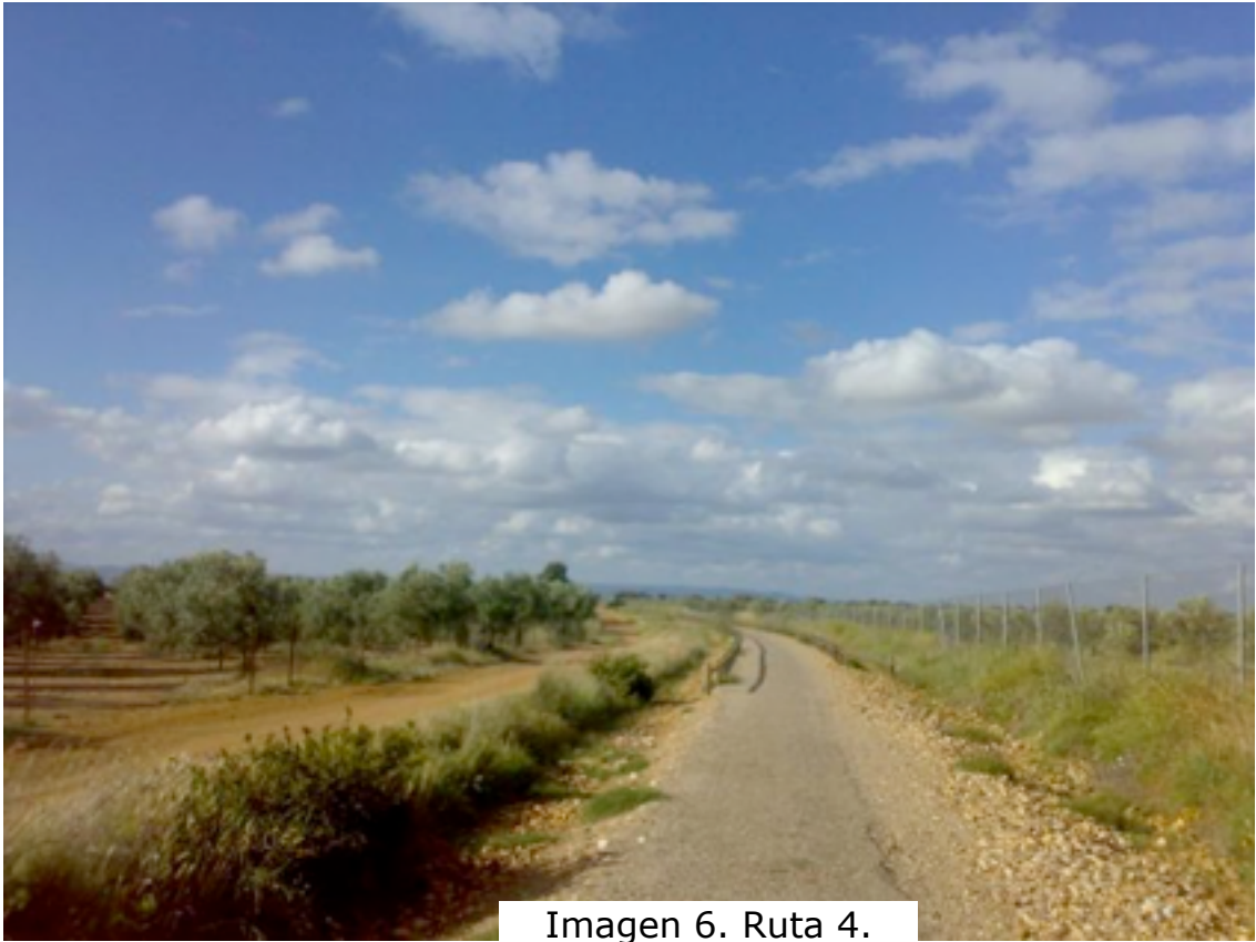
Imagen 6. Ruta 4.

El camino continúa hacia el oeste, y comienza a perder altura al entrar en la vaguada por donde discurre el arroyo de La Marota. Allí, un discreto puente cruza sobre los carrizos del arroyo. Desde este puente, la traza comienza el contorneo de una masa forestal, que conforma el Parque de El Hecho (km 18). Este parque está dotado de zonas de barbacoa y abundantes sombras, muy de agradecer en estos parajes tan expuestos al implacable sol andaluz.