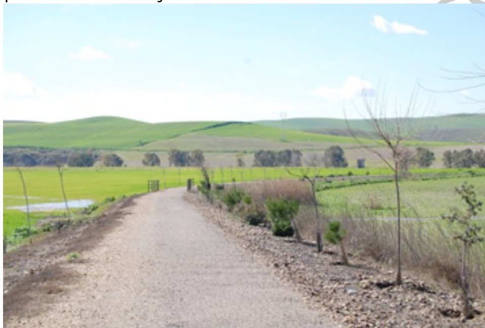
Imagen 8. Ruta

superado el arroyo de Guadalmazán, conducirán al viajero hasta la estación de La Carlota (km 26). En realidad, esta localidad dista 6 km de su estación, siendo La Fuencubierta la población que está situada junto a la vía verde. También la identificación de la estación es casi un reto para los arqueólogos industriales, ya que de ella sólo se conserva en pie la casa de capataz y un pequeño almacén anejo.