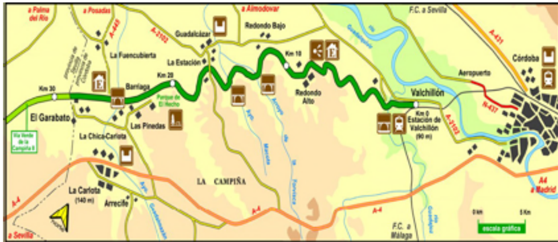
Imagen 9. mapa 1