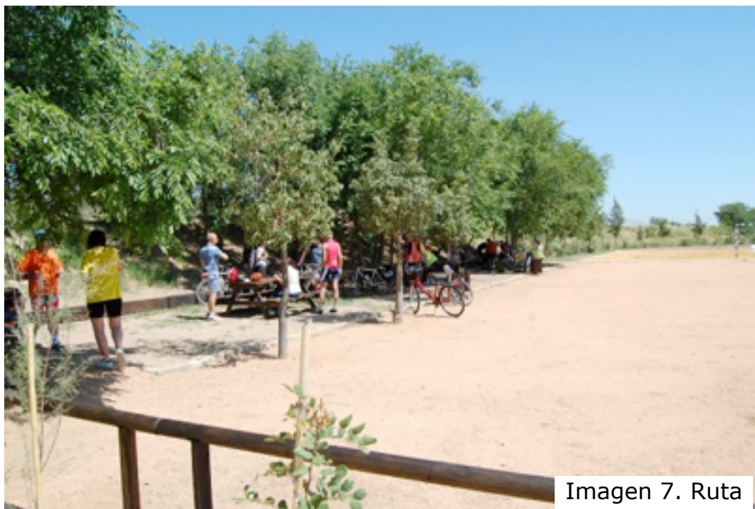
Imagen 7. Ruta

Tras el parque la vía verde enfilea un tramo en el que se pasará junto a un curioso embalse que retiene (si las hubiera) las aguas del arroyo Escorial. Lo peculiar de esta obra es que ha utilizado como dique un terraplén del ferrocarril. A 300 m del embalse, unos rústicos poyetes de piedra son los únicos restos del discreto apeadero de Las Pinedas. El poblado de colonización al que daba servicio (situado a la altura del km 20 de la vía), queda a pocos metros de la traza pero, rarezas de nuestro ferrocarril, el apeadero se dispuso a casi un kilómetro del pueblo. En la actualidad es otra área recreativa.