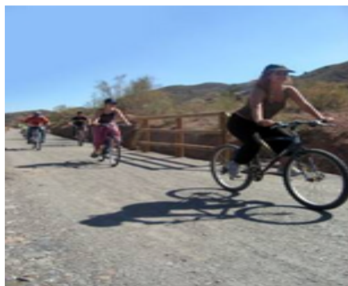
2. Vía diseñada para la práctica deportiva

terrazas de olivos y se adentra en una segunda trinchera alta y curvada. A la salida de esta trinchera (km 4,4) los montes se alejan y ceden el protagonismo a la rambla. El curso seco se abarranca y retuerce, queda aprisionado entre altas paredes terrosas y coloristas.