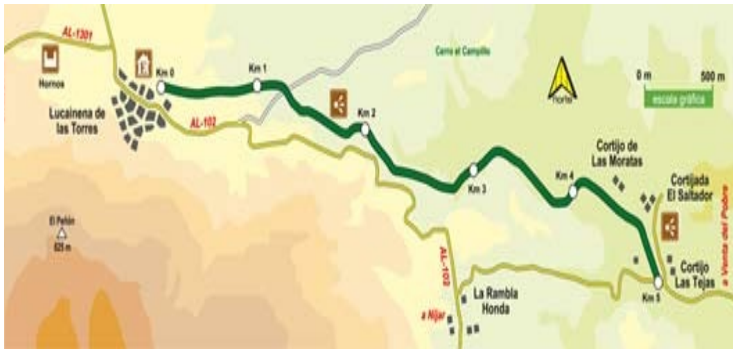
4. Mapa de la Vía Verde.