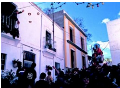
6. Fiesta de San Sebastián

Fiestas en el municipio de Lucainena de las Torres