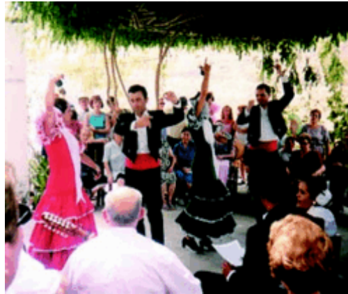
7. Romería de Rambla Honda

celebrada en su honor, se realiza una romería en la barriada de Rambla Honda, acondicionando para la ocasión algunos lugares de dicha rambla.