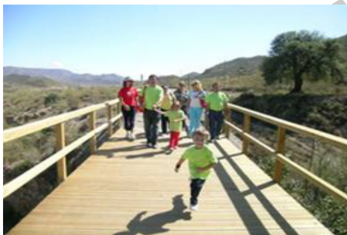
1. Vía para todo tipo de público

principalmente, olivos. Así, se llega a la primera trinchera ferroviaria, en curva y con interesantes paredes terrosas de colores muy vivos. Sin duda, una buena clase de geología mientras se recorre esta vía verde.