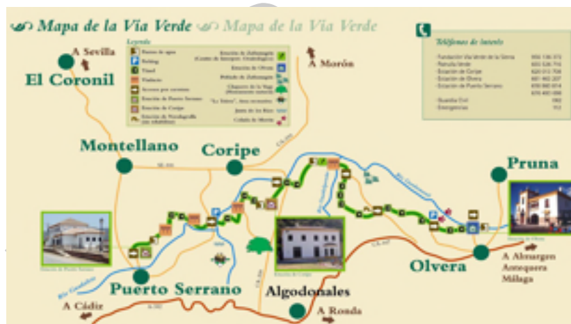
6. Mapa del la vía