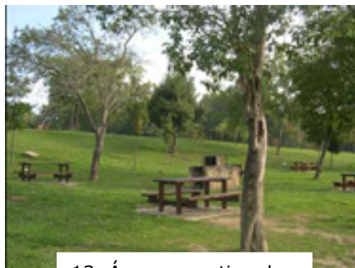
13. Área recreativa de la vía verde de Atxuri.

Mungia cuenta con varias líneas de Bizkaibus que permite una rápida y constante comunicación con las poblaciones vecinas, como la A3517 (Bilbao-Derio-Mungia), la A3518 (Bilbao-Derio-Mungia-Bakio) y la A3516 (Bilbao-Mungia por autopista).