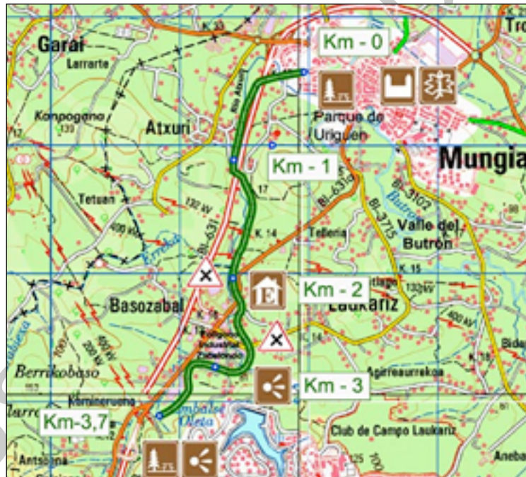
7. Mapa de la vía verde de Atxuri