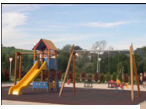
14. Área de juegos infantiles de la vía verde de Atxuri.

Encontraremos juegos infantiles en la parte alta del Parque Uriguen, junto a Landetxo Goikoa, en la parte baja del mismo, junto al aparcamiento, y junto a la vía verde, antes de pasar junto al