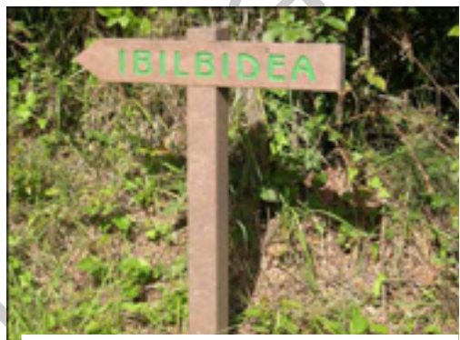
2. Señalización itinerario verde.

El ayuntamiento de Mungia ha diseñado una serie de recorridos que permiten descubrir el casco urbano, la zona rural y los alrededores del municipio. La vía verde de Atxuri se corresponde con el itinerario verde, que se encuentra señalizado con flechas.