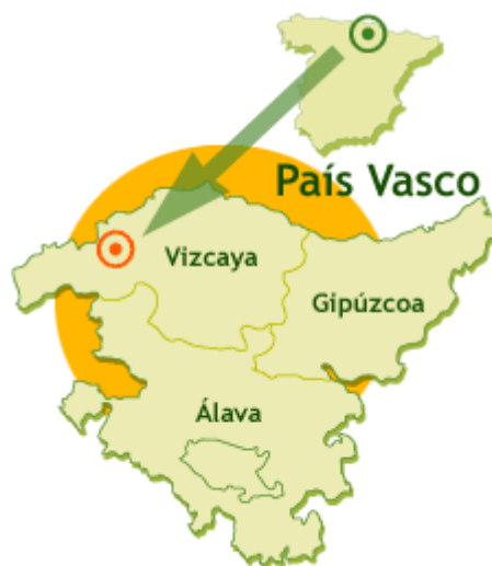
Ilustración 1. Ubicación de la Vía Verde de Atxuri

La Vía Verde de Atxuri de 3,7 Kms. de longitud, se encuentra en la provincia de Vizcaya, uniendo la localidad de Mungia y las estribaciones del monte Artebakarra. Transcurre por el antiguo ferrocarril de campesinos camino de Artebakarra. El pavimento es de asfalto, por lo que el tránsito para usuarios de silla de ruedas ofrece óptimas condiciones. Desde la Vía Verde se puede disfrutar del Valle de Atxuri, el Parque de Uriguen en Mungia y el Valle de But el conjunto monumental de esta localidad.