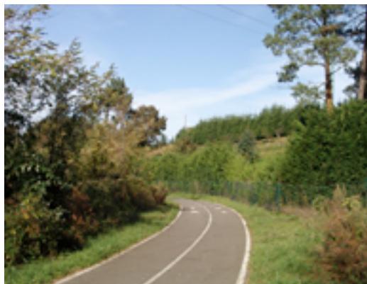
6. Tramo final de la Vía Verde de Atxuri.

Kms. 2 a 3: la vía se tuerce a la izquierda y llega al antiguo apeadero de Zabalondo (Km. 2), en cuya casilla aún habitan los descendientes de aquel antiguo encargado que, al paso del tren, bajara y subiera las barreras en el paso a nivel de la carretera comarcal a Laukariz. Tras cruzar con cuidado, al otro lado de la carretera el carril asfaltado se enfrasca en la rampa más acentuada de toda la ruta, alejándose definitivamente del río Atxuri. La acentuada rampa da paso al giro cerrado en torno al polígono industrial de Zabalondo. Las naves industriales cercenan las vistas al valle y toda nuestra atención se explaya por los prados y ondulaciones de la izquierda. En el rodeo a Zabalondo cruzaremos a nivel, la carretera que sube al embalse de Olena (Km. 2,7), cuyas quietas aguas rodean un bonito camino rural.