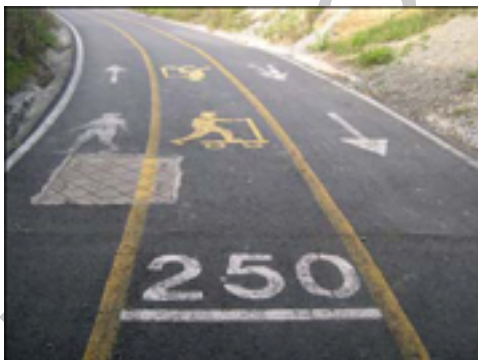
2. Señalización sobre el asfalto

Además, existe señalización horizontal sobre el asfalto que da información sobre la distancia recorrida y la distribución del uso de la vía.