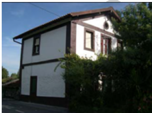
12. Apeadero de Zabalondo