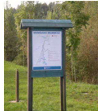
4. Panel informativo sobre los itinerarios del recorrido.

Existen paneles con información sobre los itinerarios a lo largo del recorrido, y un panel con información sobre el casco urbano en el Parque Uriguen.