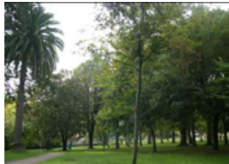
9. Parque Uriguen.

El núcleo urbano de Mungia encierra algunos tesoros arquitectónicos como Torrebillera, antigua casa-torre medieval cuyo aspecto actual es fruto de una remodelación de 1852; el puente románico Goikoetxe, junto al edificio anterior; el Palacio Agirre, alzado a finales del siglo XVIII; las iglesias de San Pedro y Andra Mari, etc.