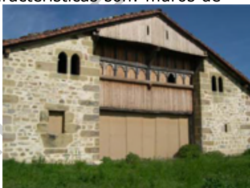
10. Landetxo Goikoa

Construido a finales del siglo XVI, es considerado el caserío más antiguo de Bizkaia. Algunas de sus características son: muros de mampuesto de arenisca, tejado a dos aguas, falta de vanos a ras de suelo, dos ventanas geminadas en la planta superior, empleo de tablas ensambladas en la parte superior de la fachada, etc.