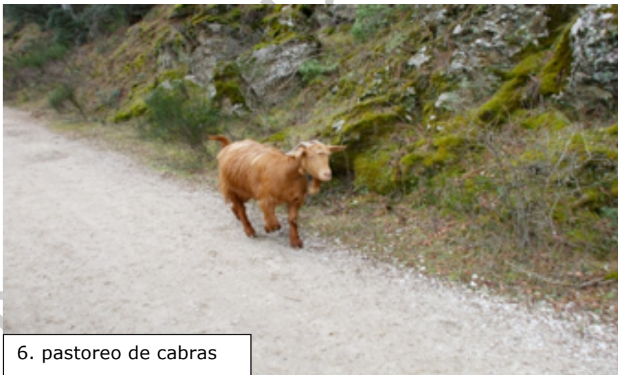
6. pastoreo de cabras

terminar la ruta dio la casualidad que ese día, topamos con un pastor de cabras, aquí podemos observar a uno de nuestros compañeros de via verde.