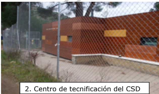
2. Centro de tecnificación del CSD

Todo el recorrido se halla representado por los embalses San Juan y Picadas, entre las poblaciones que tienen un desarrollo más importante destaca San Martín de Valdeiglesias, vinculada a la construcción de la iglesia de Santa María de Valdeiglesias. Durante el siglo XII, el valle medio del Alberche comenzó a