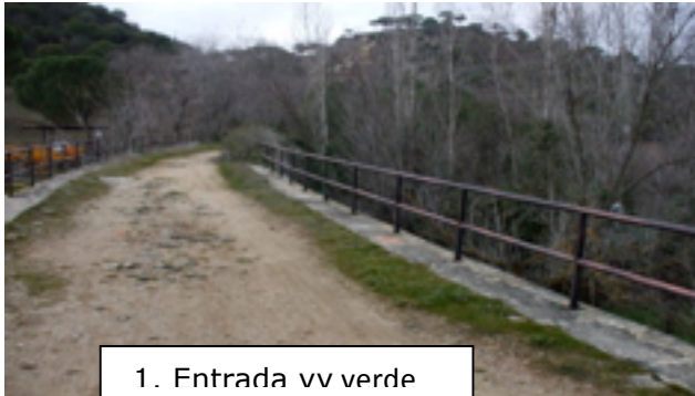
1. Entrada vv verde

Llegue a la vía verde desde la 501, que es la carretera de los pantanos, pasando el río Alberche de donde parte por nuestra izquierda el camino y parking para