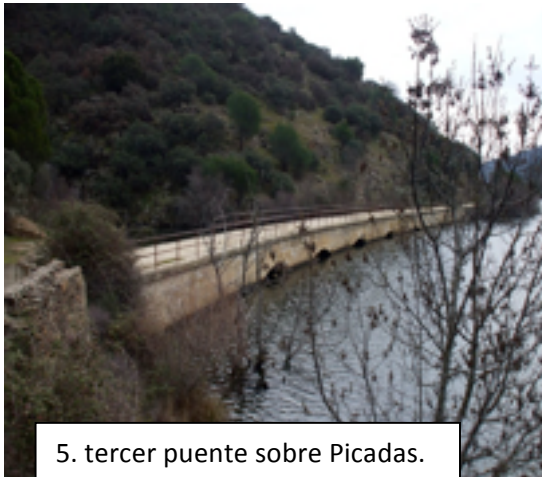
5. tercer puente sobre Picadas.

especies arbóreas, pedaleando de puente en puente pasamos. El embalse forma una especie de "u" entre los montes del otro lado.