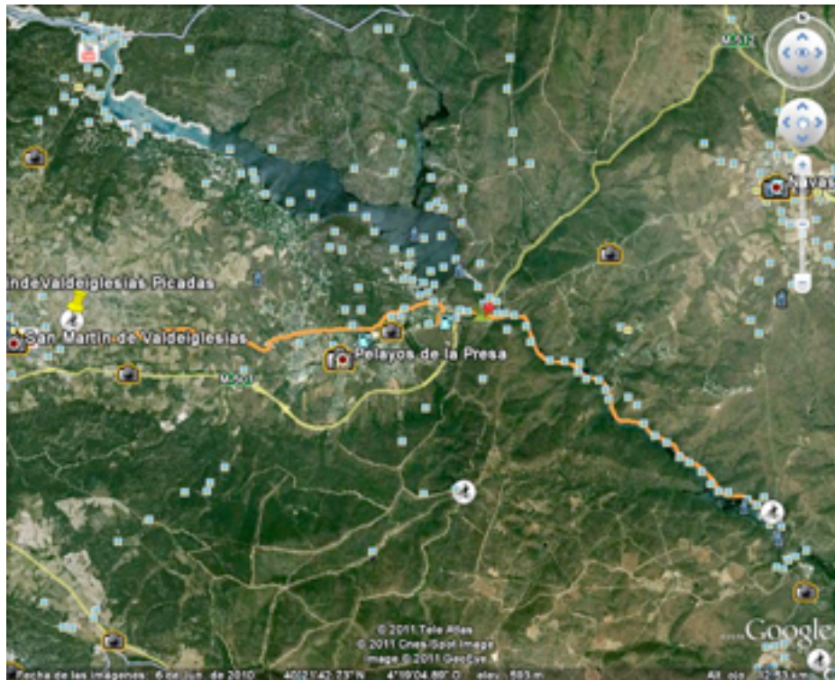
8 via verde vista desde el google maps.