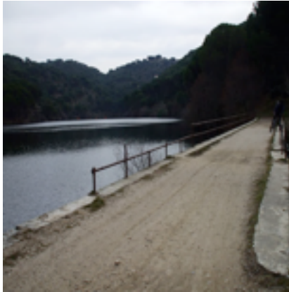
3. Primer puente de a vía

las paredes rocosas de gran riqueza geomorfológica