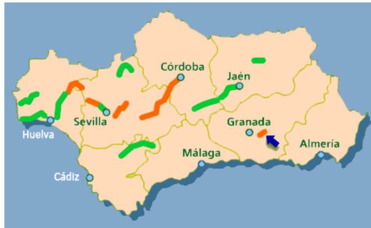
Imagen 5. Mapa vías verdes Andalucía