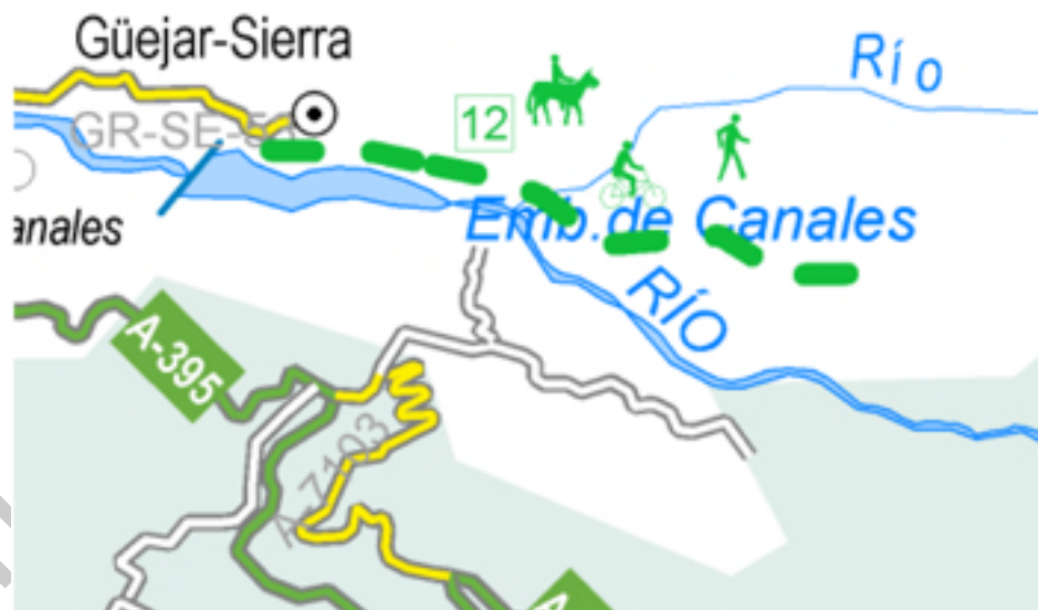
Imagen 6. Mapa Vía Verde Sierra Nevada