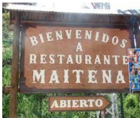
Imagen 8. Restaurante Maitena (Güejar –Sierra)

En este restaurante podrás degustar las típicas “papas con choto”.