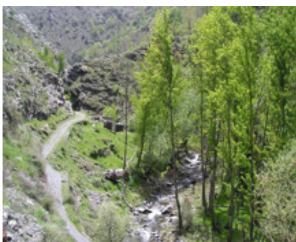
Imagen 3. Río Genil - Maitena

De aquí en adelante la vía sigue siendo estrecha pero en mejores condiciones. Sin embargo, esto también significa que hay más vehículos transitándolo, especialmente los fines de semana y en períodos de vacaciones cuando la gente va a los restaurantes que hay a lo largo de la vía. Así que ten cuidado con los coches, especialmente en los 5 túneles restantes de la vía.