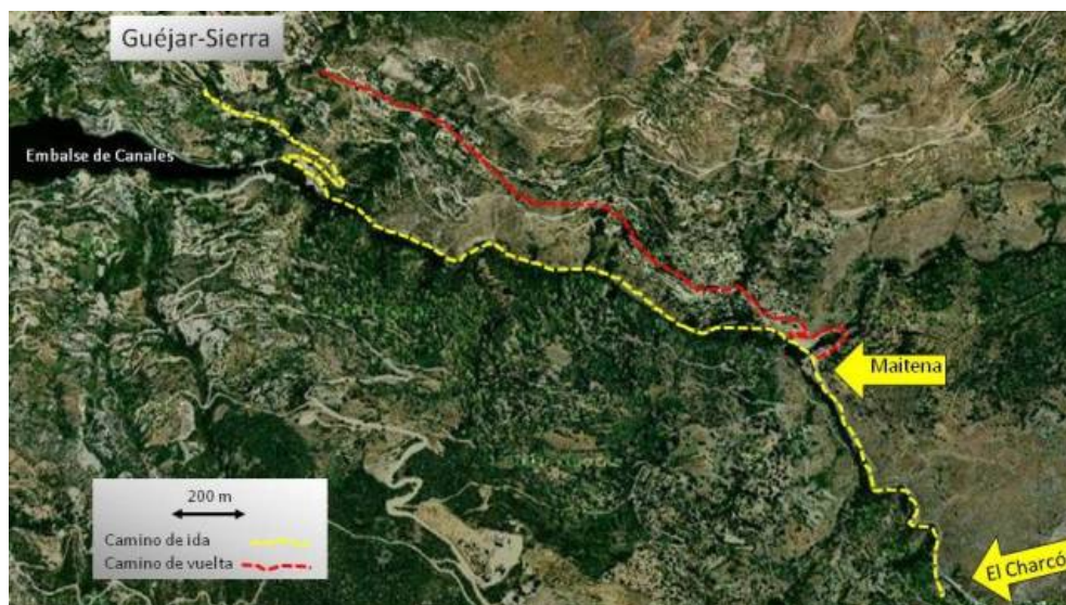
Imagen 7. Perfil topográfico Vía Verde Sierra Nevada