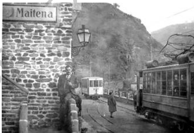
Imagen 1. Antigua Estación de Ferrocarril de Maitena