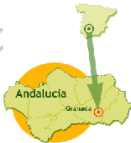
Imagen 4. Mapa general