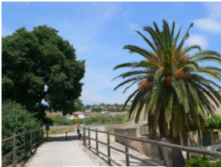
7. Tramo protegido.

Una vez dejado atrás un antiguo puente, se llega a la sede del Parque Natural del Ports para cruzar después una carretera y seguir recto hasta EMD Jesús. Circulando por un tramo compartido con vehículos que cruza el barranco del Vall Cervera, llegamos al área de ocio de Jesús, ubicada en Terrer Roig. En Jesús podemos visitar la iglesia de Sant Francesc (s. XVII) o la casa museo de Enric d'Osso. Se sale de Terrer Roig atravesando con precaución la carretera y se enlaza nuevamente con la vía que nos lleva al pequeño pueblo de Aldover, donde se encuentra la primera estación ferroviaria de la vía.