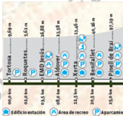
Imagen 11. Perfil topográfico.