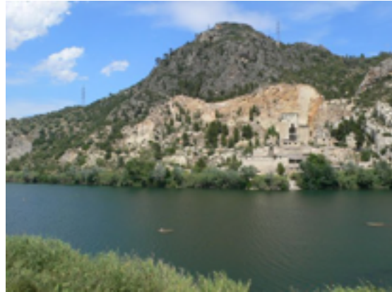
4. El rio Ebro nos acompaña

La ruta sale de Tortosa por el polígono industrial (el inicio no es visible, debe buscarse) y rápidamente entra en Roquetes donde la vía tiene discontinuidades más o menos indicadas. Hasta Xerta y pasando por Aldover, disfrutaremos de un camino casi completamente plano, con múltiples vistas al Ebro y rodeado de campos frutales y de secano. También es fácil encontrar nubes espesas de mosquitos, que serán nuestro desayuno si no vigilamos. En Xerta la vía verde pierde su camino natural y pasamos por debajo de la carretera C-12, cruzamos el pueblo y llegamos a la antigua estación del ferrocarril donde enlazamos de nuevo con la vía (atentos a no pasarse este desvío).