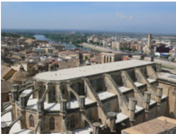
2. Casco antiguo de Tortosa

La vía verde del Baix Ebre coincide en casi todo su recorrido con el antiguo camino de Sant Jaume de l'Ebre, ruta clásica de peregrinaje de las tierras del Ebro hacia Logroño y enlace con el camino de