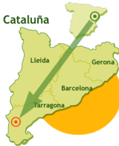
Imagen 10. Situación geográfica.