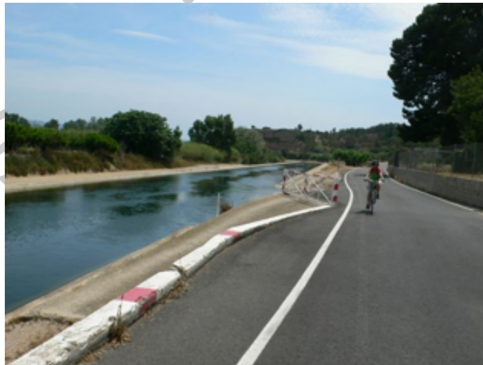
5. Canal paralelo a la vía al pasar Xerta.