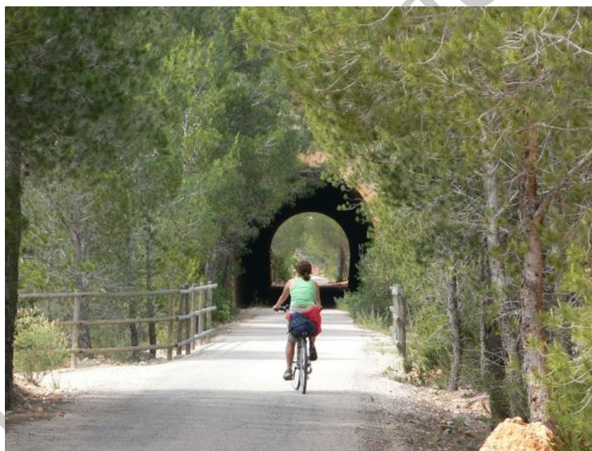
8. Congosto del rio Canaletes

El puente de la Riberola, que nos permite atravesar el río Canaletes, es el punto limítrofe de las comarcas del Baix Ebre y de la Terra Alta, siendo la última estación de la vía del Baix Ebre y la primera de la Terra Alta; El Pinell de Brai.