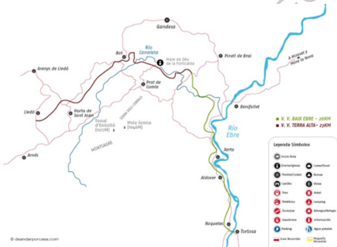
9. Croquis de la ruta.