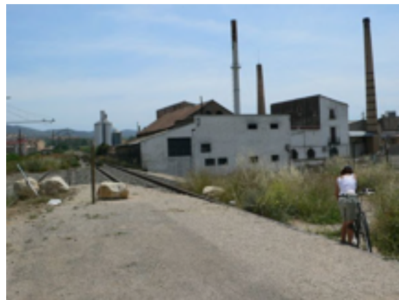
3. Inicio de la vía

Aunque la vía verde se inicia a las afueras de la ciudad vale la pena visitar la Catedral, el Mercado Municipal Modernista y el Castillo de la Suda de origen árabe e impregnarse de un ambiente que cabalga entre el mundo cristiano y el musulmán.