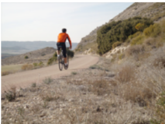
Imagen 5. Paraje del kilómetro 12 del recorrido