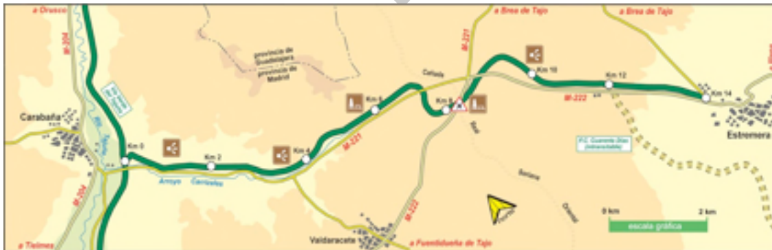
Imagen 7. Mapa general de la Vía