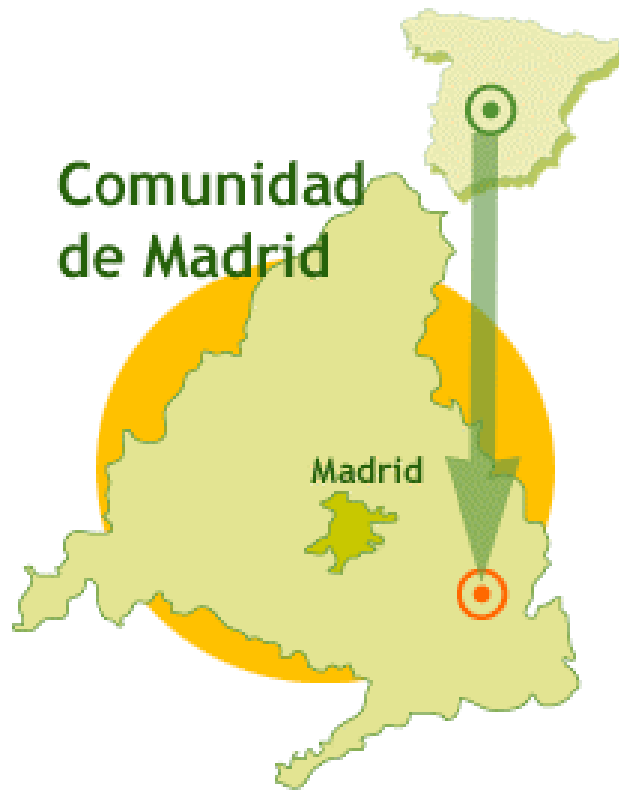
Imagen 6. Ubicación de la Vía