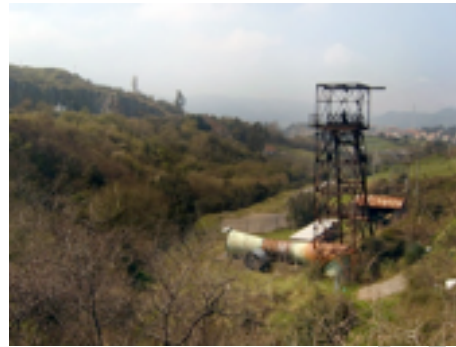
Antigua Torreta de transporte de mineral

Iniciaremos el recorrido en Sestao, en el parque de Ondejeda más conocido popularmente como "Las Camporras", lugar acondicionado con mesas, fuentes, asadores y un buen aparcamiento. Iniciaremos aquí el recorrido ya que aún no está acondicionado el túnel de Sestao, pero este carril continúa hasta Barakaldo en la dirección contraria a la que nosotros tomaremos. Partimos de los aparcamientos dejando las instalaciones deportivas a nuestra izquierda con dirección a la Noble Villa de Portugalete por el Bidegorri inaugurado en 2007, que sin pérdida nos lleva hasta la rotonda de acceso a Portugalete, bajamos el puente y continuamos entre pastos y con el monte Serantes a nuestra derecha hasta llegar a Nocedal, donde un pequeño túnel nos evita el cruce con la carretera de Santander. Llegados a Gallarta, al alcanzar el campo de fútbol, abandonamos el Bidegorri, que continua hasta la Playa de La Arena. Debemos prestar atención a las indicaciones en este tramo, seguimos por la asfaltada vía hasta el cruce con la Avenida El Minero, tomamos la Avenida