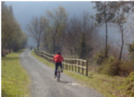
En bici por la vía

paseo encontraremos varios miradores que se asoman ala valle del río Barbadún. Sin posible pérdida continuamos hasta "El Campo", donde se inicia un muy cómodo recorrido forestal de unos 7 km., internándonos en el valle del Barbadun que lo vemos en ocasiones a la derecha de la ruta mientras madroños, alisos, castaños, encinas, robles brezo y argoma nos marcan la ruta. En un claro ya cerca del final en "El Cerco", se pueden ver los restos del cargadero, del tranvía aéreo, depósito de aguas, casa de máquinas y del solar del antiguo hospital minero. Los túneles de "Malpeña" y "Galdames" nos dejan en el amplia área recreativa Atxuriga, perfectamente acondicionada con mesas, bancos, fuentes, asadores y un pequeño bar en verano.