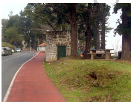
Área recreativa Los Castaños

Nueva y por la carretera local que conduce a la zona industrial "El Campillo", en el primer cruce a la derecha entre viejas minas abandonadas y con una torreta de transporte de mineral a la vista, retomamos "la peatonalidad" y llegamos a "La Balastera", pequeño núcleo surgido al pie de las antiguas minas, que se nos muestran con restos de cargaderos y planos inclinados de mampostería que cuelgan de las laderas. Atravesamos el túnel de "Calcos Viejos" y alcanzamos "Los Castaños" donde una pequeña área recreativa ha sido condicionada con bancos, mesas, fuentes y asadores a la sombra de enormes pinos y eucaliptos. Nos acompañan además en el recorrido especies como mimosas, cerezos o nogales hasta alcanzar el "Túnel del Sobaco" (hay una fuente a la izquierda) de 200 metros, que fue iluminado en la última fase de acondicionamiento, en la parte alta de la bóveda se lee un cartel identificativo.