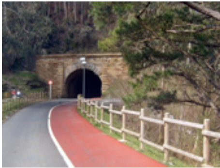
Túnel del Sobaco