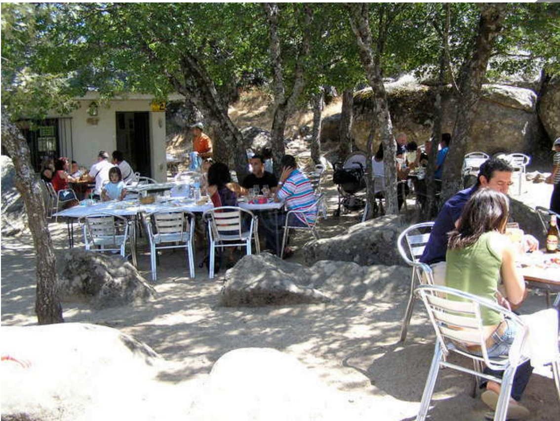
ILUSTRACIÓN Nº 11: EL BAR DE LA SILLA DE FELIPE II

El Bosque de la Herrería es un lugar protegido en el cual se producen aglomeraciones de gente en el único momento o tiempo libre que permite esta sociedad, el fin de semana. En estos días de libertad, las personas que no quieren pasar sus horas de tiempo libre en un centro comercial, se trasladan al campo, con sus familias, hijo, etc.