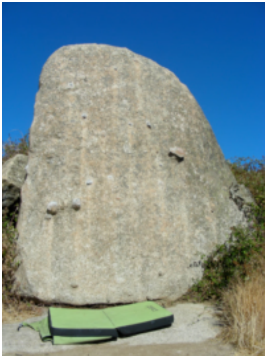
ILUSTRACIÓN Nº 6: ROCA CERCA DEL CARMITA

Este deporte, mejor dicho, modalidad es la “Escalada en Bloque”.