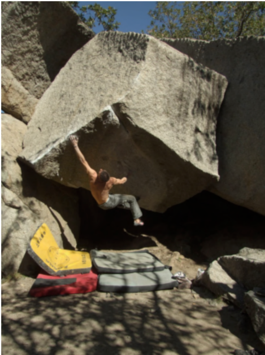
ILUSTRACIÓN Nº 9: EL MOUSTRO DE LAS REGLETAS

Multitud de problemas (rocas para escalar) son conocidos con nombres peculiares como: "EL MOUSTRO DE LAS REGLETAS", "MASIVE ATTACK", ETC.