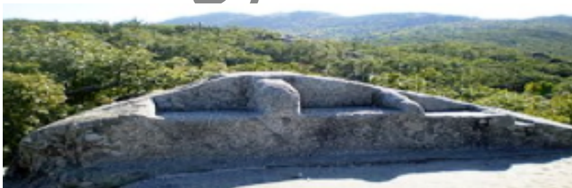
ILUSTRACIÓN Nº 5: SILLA DE FELIPE II

- Silla de Felipe II. Donde, según la leyenda, se sentaba el monarca para ver el avance de las obras del Monasterio, aunque se cree que, en realidad, fue un altar de ofrendas vetón.