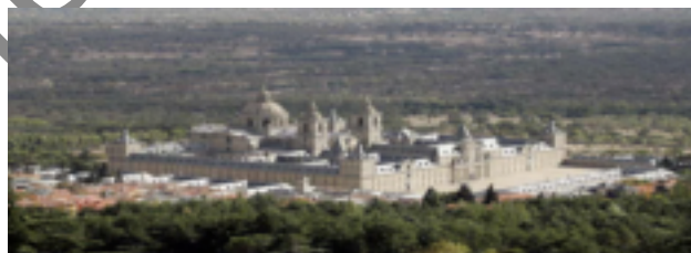
ILUSTRACIÓN Nº 4: MONASTERIO DE EL ESCORIAL

- Monasterio de El Escorial. Este edificio, uno de los principales monumentos renacentistas de España, fue erigido en el último tercio del siglo XVI, sobre la ladera del Monte Abantos, a 1.028 m de altitud. Se debe a un proyecto original de Juan Bautista de Toledo, que fue culminado, tras su muerte, por Juan de Herrera, quien impuso un nuevo estilo arquitectónico, bautizado con su apellido. Ocupa una superficie de 33.327 m 2 y cuenta con 16 patios, 88 fuentes, 13 oratorios, 15 claustros, 86 escaleras, 9 torres, 1.200 puertas y 2.673 ventanas. Su fachada principal tiene una longitud de 207 metros. Entre las partes más destacadas del edificio, figuran el Panteón de Reyes, la Real Basílica y la Real Biblioteca. Desde el siglo XVI, el Monasterio del Escorial ha sido calificado como "la octava maravilla del mundo".