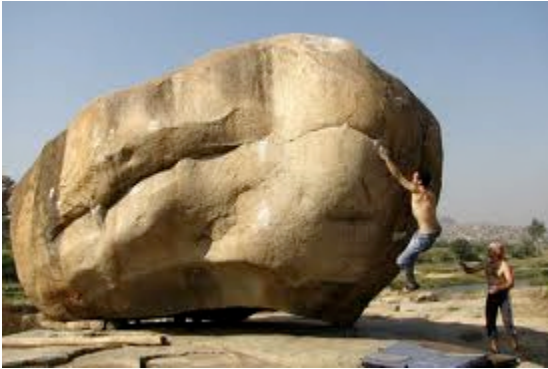
ILUSTRACIÓN Nº 10: ESCALADA EN HAMPI, LA INDIA

Lugares como FONTAINEBLEAU en París, HAMPI en la India, MAGIC GOOD en Suiza.