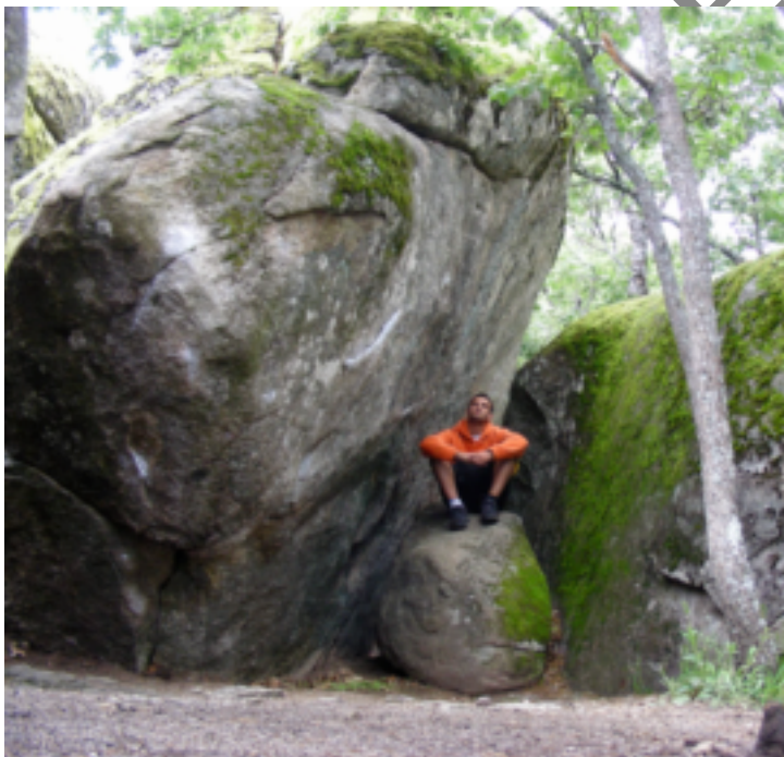
ILUSTRACIÓN Nº 2: CETACEOS