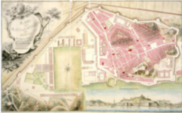
Ilustración 2. Plano de Cartagena y su arsenal (1799)

actividad constructiva y mercantil que hace que su población crezca de 10.000 a 50.000 habitantes.