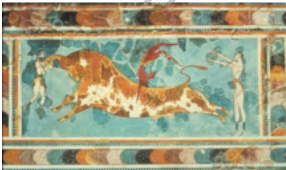
Ilustración 10. Salto del toro.

con objeto de recabar la ayuda y los favores de sus dioses paganos. Aún hoy se puede visitar los restos de un templo de estas características en la provincia de Soria, cerca de Numancia, donde existen evidencias de la celebración de estos ritos. También cabe destacar la influencia grecorromana con su afición por el circo, que tuvo una gran importancia en el sentido de acentuar el carácter de espectáculo y hacer desaparecer el papel que ocupaba como rito y holocausto religioso. Siendo por ello esta ficción circense otro precedente de nuestras corridas de toros. Más adelante, una serie de investigadores (Grant, Huizinga, Mariana, etc.) han descubierto ceremonias de tauromaquia en los circos romanos, como los juegos de toros de Creta, del segundo milenio antes de Cristo, en los que los atletas se apoyaban en los cuernos de los toros en el momento de la embestida, saltaban sobre el lomo de la fiera y caían detrás de ella, donde un segundo atleta los recogía para impedir que cayesen al suelo (tema representado frecuentemente en pinturas como en el palacio de Cnosos, 1500 a.C.)