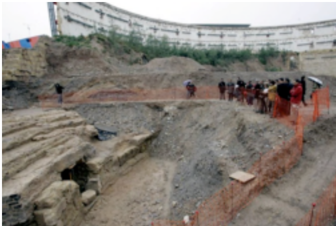
Ilustración 4. Excavaciones.

Pese a esto, el yacimiento, aún se encuentra mayoritariamente enterrado, a falta quizás de que se concluya el gran proyecto arqueológico y turístico de la ciudad, el Teatro Romano. Sobre él se construyó en 1854 la Plaza de Toros de Cartagena, que utilizó sus contrafuertes superiores como bases de la edificación. En los alrededores de la plaza de toros podemos apreciar algunos pequeños detalles del Anfiteatro hallados en diferentes excavaciones.