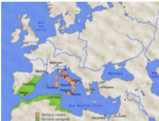
Ilustración 1. Final I Guerra Púnica

La ciudad de Cartagena, situada en la provincia de Murcia, al sureste de la Península Ibérica, fue fundada con el nombre de Qart Hadasht, hacia el año 227 a. de C. por el general cartaginés Asdrúbal sobre el núcleo de población anterior que se relaciona con la Mastia, que aparece recogida en la Ora Marítima escrita por el romano Rufo Festo Avieno en el siglo IV a. de C. La presencia cartaginesa en ella sería fugaz ya que en el 209 a. de C., en el transcurso de la Segunda Guerra Púnica, fue conquistada por el romano Publio Cornelio Escisión.