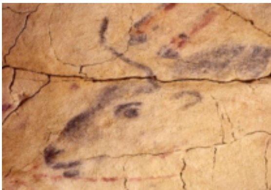
Ilustración 8. Cabeza de toro en Altamira.

Son muchos los especialistas en tauromaquia, que han demostrado que los inicios del hombre con el toro se remontan a la prehistoria. El origen de esta relación se encuentra presente en las paredes de las cuevas prehistóricas. En las pinturas rupestres del norte de España, el toro bravo está representado muerto, como objeto de valor material o como símbolo preciado de un logro victoriosos de lucha a muerte entre él y el hombre; mientras que en las paredes de las cuevas francesas y el levante español, el toro aparece formando parte de grupos numerosos, en movimiento y en actitud muy activa.