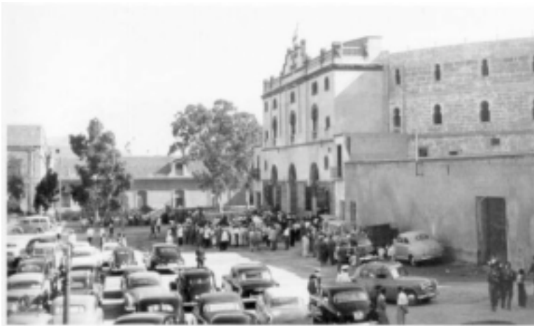
Ilustración 6. Primeros años de la plaza