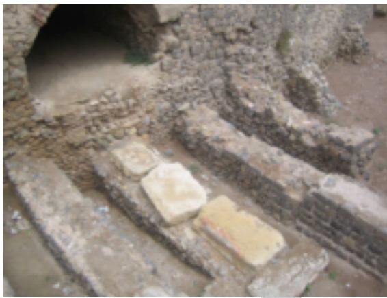
Ilustración 3. Contrafuertes anfiteatro

El edificio fue construido en el s. I d.C., previsiblemente, sobre un primitivo anfiteatro de época republicana. En tiempos de la Dinastía Flavia se levantó el actual y para su construcción se aprovecharon de parte de la ladera del Monte de la Concepción debido a su desnivel, y otras partes se construyeron con la técnica romana de los contrafuertes, utilizando para ello piedras de tabaire de las cercanas Canteras de Cartagena, así como también andesitas del Cabezo Beaza. Presenta una planta elíptica con 96,60 metros de largo por 77,80 metros de ancho.