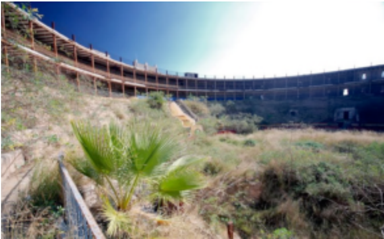
Ilustración 7. Estado plaza de toros.

3. En el tercer piso están los palcos altos y las gradas.