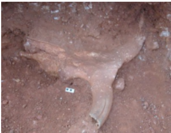
Ilustración 9. Cornamenta de Uro

Pero no sólo las pinturas demuestran la presencia del toro, también se han hallado restos fósiles como los encontrados en el valle del Manzanares, en Madrid, donde apareció un fragmento de cornamenta de toro primitivo perteneciente al Pleistoceno, por tanto, anterior a la aparición del hombre (aprox. 400.000 años).