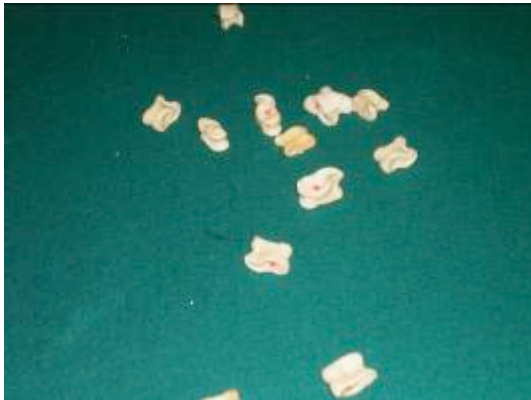
Imagen 4: Distintas tabas entre las que el jugado puede elegir para tirar.

entrar, esto es porque en éste el mínimo de apuesta eran 50 euros y nada más abrírnos la puerta nos la cerraron. Esto es porque a este último bar van gente con muchísimo dinero y que más o menos suele ser la misma todos los años y se juegan la revancha de un año a otro con grandes sumas de dinero encima de la mesa. Además llevan intentando quitar la taba por ser ilegal jugar con dinero en un local si no tiene licencia, pero lo que han hecho de momento es prohibir que en la mesa haya más dinero que el salario mínimo, cosa que visto lo visto, en este bar intuimos que se superaba con creces.