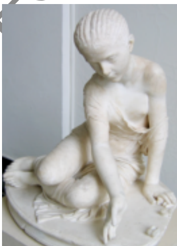
Imagen 1: Escultura jugando a la taba

Pero no sólo se usó en el mundo clásico: a día de hoy aún se usan en Mongolia, así como en la pampa argentina. Tampoco eran algo relegado al pueblo llano: hay textos históricos que relatan el apego que tenía Genhis Khan a sus tabas o que narraban las partidas de Augusto, primer emperador romano.