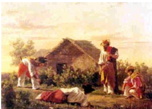
Imagen 2: Óleo de Juan Manuel Blanes mostrando a gauchos jugando a La taba.

Cuando la taba queda en posición vertical, lo cual se denomina pinino, puede pagarse doble o triple, si los jugadores han acordado previamente que esta posición valga.