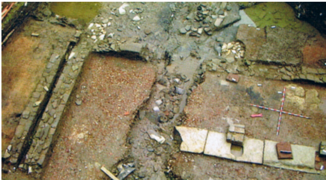
Foto 3: Excavación en el Jardín. El primer plano de la Basílica y al fondo la Palestra Las termas y los romanos.

Bajo el Imperio Romano, el termalismo ha desempeñado un rol social de innegable importancia: las termas eran además de un centro de cuidados, un lugar de intercambios sociales, culturales, comerciales, de reuniones y de diversión.