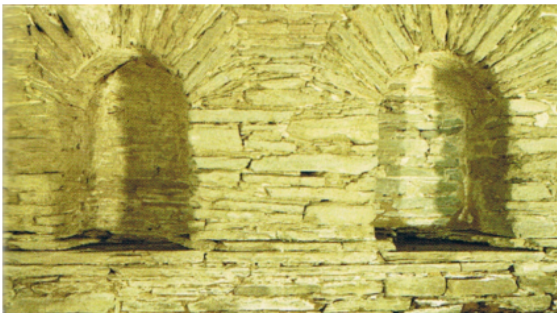
Foto 5: Detalle de los Nichos donde los bañistas guardaban su ropa.