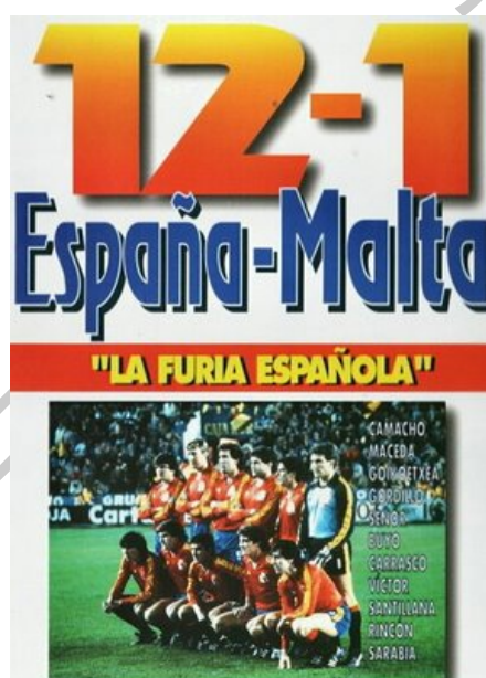
21. Crónica Periódico.

La construcción de los goles Norte y Sur en el año 1958. Posteriormente, se volvió a construir los goles Norte y Sur entre los años 1971 y 1973. Construcción de la Tribuna de Voladizo 1975. Y construcción de la Tribuna de Fondo en 1979. La construcción de la Tribuna de Preferencia en 1981 y la construcción del 1er Anfiteatro de la grada de preferencia en 1982. Queda el estadio, con una capacidad de 45.000 espectadores, 27.000 de ellos sentados. En él se juegan partidos del Mundial de España 82 y el famoso 12-1 de España a Malta que clasificó a la selección española para la fase final de la Eurocopa 1984.