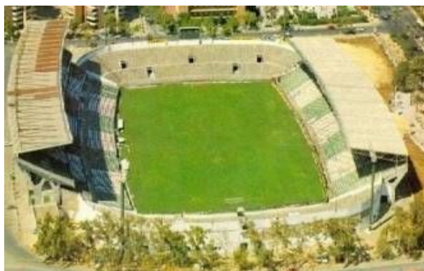
19. Benito Villamarin.

30 años de utilidad consentida, el estadio paso a manos de la institución verdiblanca.