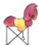
5. Real Feria del Prado de San Sebastián