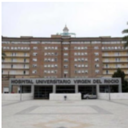
4. Hospital Virgen del Rocío

En 1955 se inaugura la Residencia Sanitaria Virgen del Rocío, denominada al principio como residencia García Morato. Durante esta etapa se produjo la mayor expansión urbanística de la ciudad, con la construcción de muchas barriadas, siendo el abanderado de este tipo de desarrollo urbanístico el barrio de Los Remedios, a donde se trasladó en 1973 el Real de la Feria del Prado de San Sebastián.