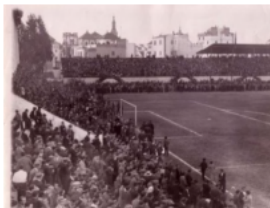
13. Campo Real Patronato Obrero.

Paralelamente a estos sucesos, en otra parte de la ciudad sevillana, a mediados de los años 30, en el Porvenir, el Real Betis Balompié reside en otras dependencias de propiedad municipal, conocidas como el campo del real Patronato Obrero. Durante esta época, y a pesar que el año 1935 gana la liga española, se ve inmerso en una crisis económica e institucional de gran escala.