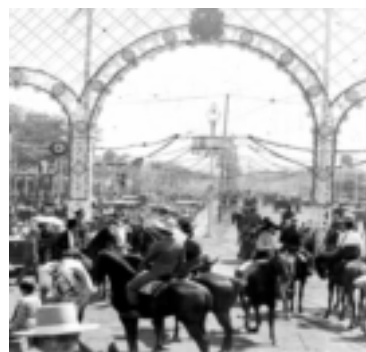
Portada feria de abril en el Prado de San Sebastián año 1927