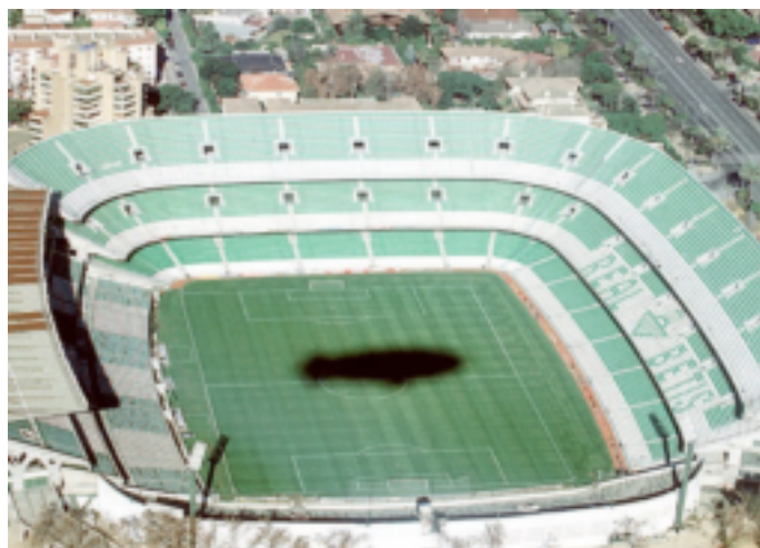
22. Estadio Actual.

Imagen del estadio actual del club Real Betis Balompié.