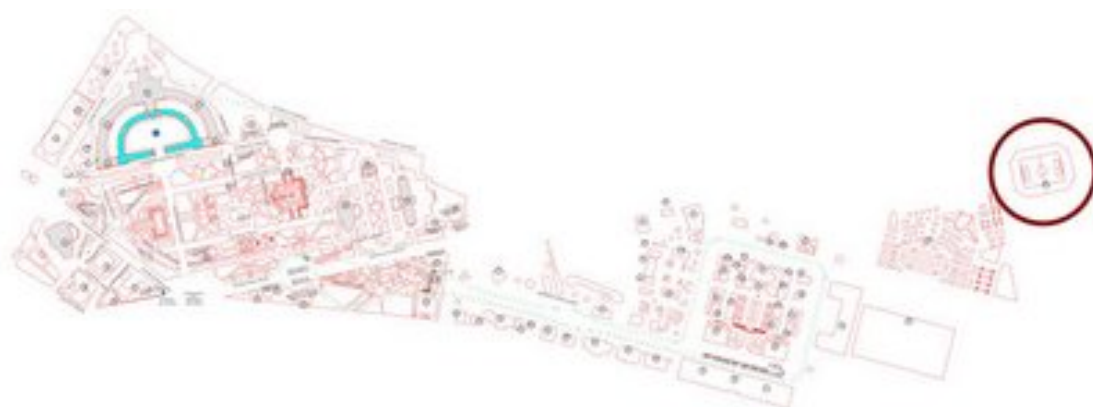
9. Mapa de la ciudad de Sevilla.

Sin embargo, y previamente a esta época y hasta el año 1928 existía en Sevilla en el conocido paseo de la Palmera, el estadio sevillista Reina Victoria, que se vería obligado a abandonar como consecuencia de esta celebración para ocupar así su tercer estadio de construcción propia: el estadio de Nervión. Este estadio que había sido dejado por el conjunto sevillistas, sería ocupado por las actividades lúdicas del evento, con la colocación de atracciones.