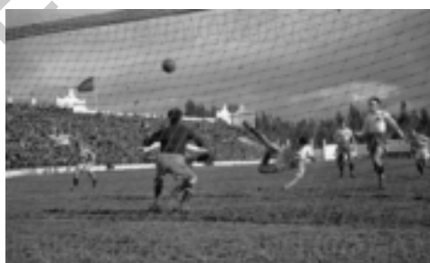
17. Imagen del encuentro.

En este partido inaugural, y coincidiendo con la puesta en marcha del campeonato liguero, se jugó contra el Sevilla FC. Obteniendo el Betis una victoria por un gol a cero.