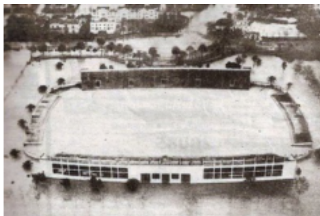
18. Inundación del estadio.

Inundación del estadio en 1948 como consecuencia del desbordamiento del río Tamarguillo, afluente del Guadalquivir.