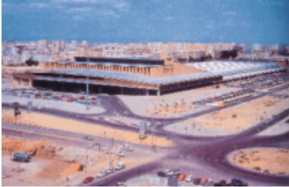
6. Santa Justa