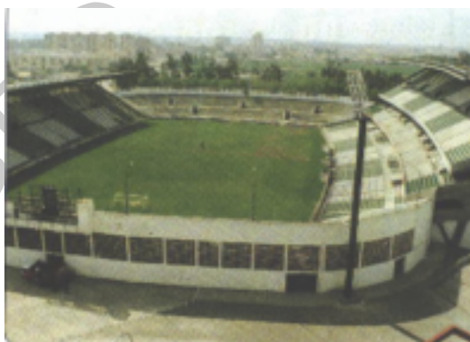
20. Con algunas remodelaciones.

Durante los años que el estadio estuvo construido fue sufriendo diferentes remodelaciones, en primer lugar comenzando por las gradas de los goles, que fueron ampliadas, produciéndose una gran remodelación como consecuencia del mundial de 1982. Es en esta fecha donde el estadio pasaría a llamarse Benito Villamarín.