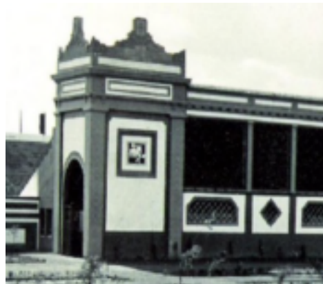
12. Campo de "La Exposición".

Pero nadie en ese momento podría imaginarse cuál sería el destino que podría tener el mismo. El ayuntamiento sevillano no fue capaz, durante un largo periodo de tiempo, de darle a este espacio abandonado y vacío, una utilidad práctica, teniendo en cuenta los gastos que por sí solo generaba y la atención que un recinto de estas características necesitaba.