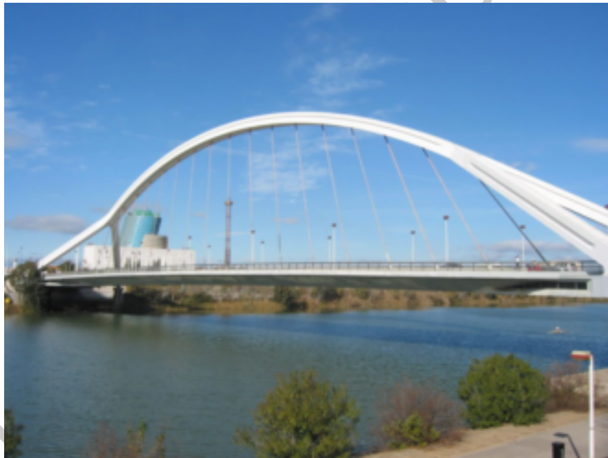
8. Puente de la Barqueta.