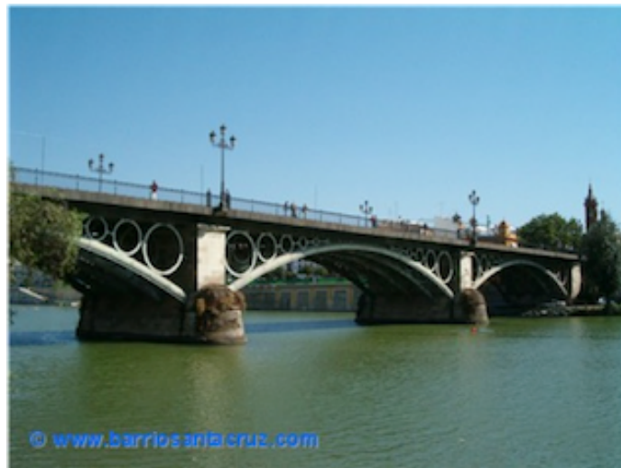
2. Puente de Triana

En los años que reinó Isabel II, la clase burguesa inició una etapa constructora sin igual en la ciudad. De aquella época data el puente de Isabel II (más conocido como puente de Triana).