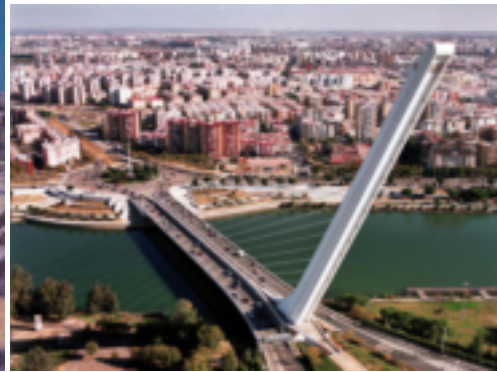
7. Puente del alamillo