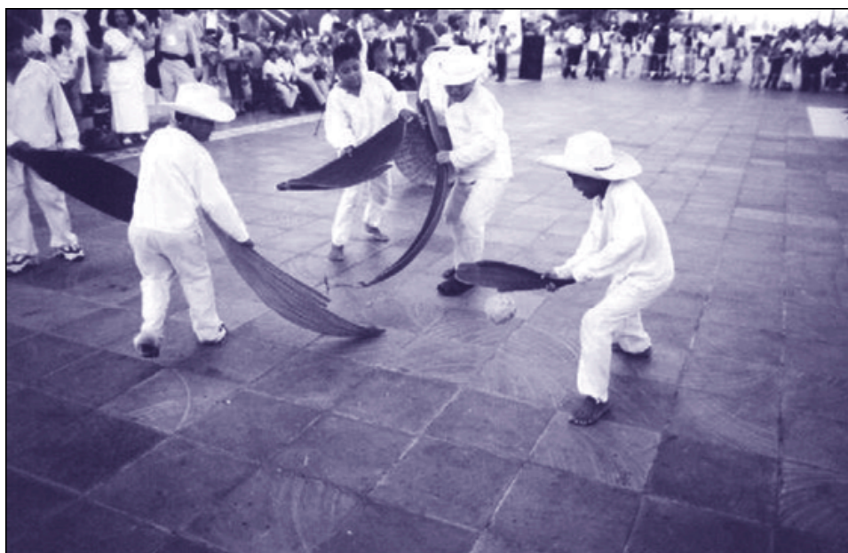
Foto 4. Jóvenes varones jugando al corozo.

Este deporte es practicado en el Sureste de México en el Municipio de Nacajuca, Estado de Tabasco, por niños y jóvenes del grupo étnico Chontal. En la ilustración 3 y 4 se puede ver la forma y el tamaño tanto de corozo como de la pelota y en la ilustración 3 además el cesto.