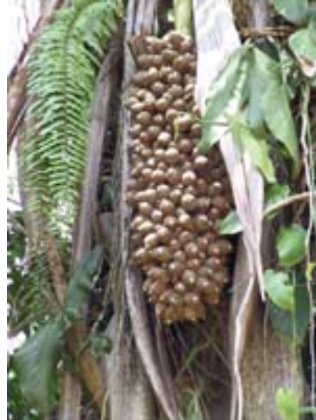
Fotos 1 y 2. Árbol de Palma fruto

Se denomina así porque el implemento utilizado proviene de una palma conocida con el nombre de "Corozo". Se utiliza la cubierta donde viene la flor de palma que después se convierte en corozo. La pelota se hace con una plantita llamada "cañita" se elabora con bejuco enredado hasta alcanzar un diámetro entre 10 y 12 cms., en chontal se pronuncia "Tapine" pelota cañita.