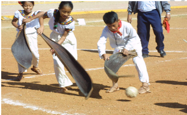
Foto 3. Niños jugando al corozo

Las dimensiones del campo de juego donde se produce el juego y la contienda se realiza en un espacio abierto de 50 a 60 mts. de largo por 20 de ancho, en los extremos de cada campo se cava la fosa o se coloca la cesta.