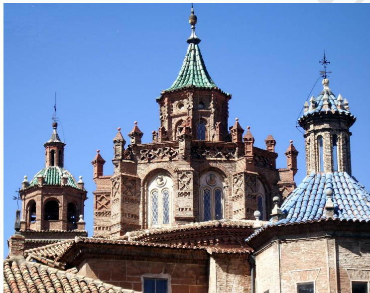
Foto 6. Catedral de Teruel

numerosos los retablos que contiene así como pinturas, la mayoría del siglo XVII y XVIII y entre las que destaca una tabla que representa la Virgen con el niño de finales del siglo XVI. También cabe citar diversas piezas y mobiliario litúrgico como custodias, arquetas, cruces, bustos, cozones, incensarios... de distintos materiales y épocas. Sin duda dos de sus elementos más admirables son la reja y la sillería del coro, realizadas en el siglo XV y XVII respectivamente (8).