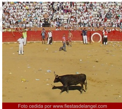
Foto 9. Imagen de la vaquilla en la plaza