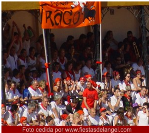
Foto 8. Graderío de la plaza toros

El domingo, tras una larga noche de principios de fiesta, a las 12 de la mañana se celebra la santa misa en los salones del Ayuntamiento en honor al Santo Ángel (patrón de la ciudad), presidida por el Rector de la iglesia de San Pedro y en presencia de la corporación municipal. Por la tarde, a las 6, se celebra la tradicional suelta de vaquillas y merienda en la plaza de toros. Algunos de los toros que salen al ruedo para su muestra, son los que posteriormente serán trasladados en la madrugada al centro histórico para ser ensogados y corridos el lunes por la tarde por algunas calles y centro de la ciudad.