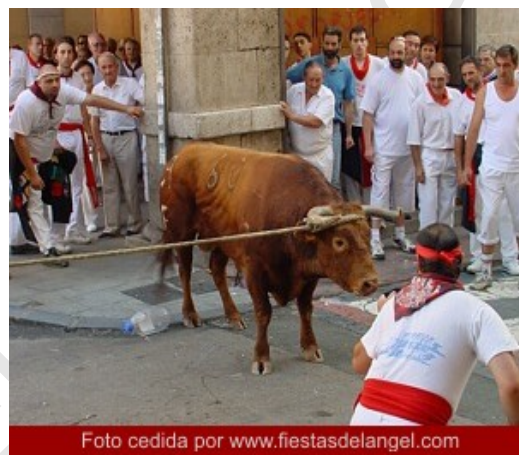
Foto 11. Toro ensogao II