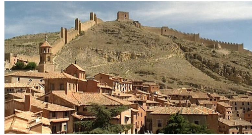
2. Teruel en la actualidad