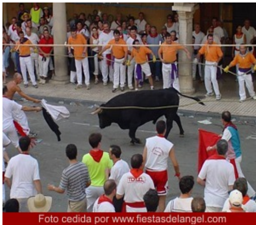
Foto 10. Toro ensogao

ensogadas y se desarrolla también en el centro de la ciudad ( Plaza del Torico y calles adyacentes). Por la tarde, a partir de las 6 y hasta casi las 10 de la noche, se dan cita los aficionados al toro ensogado. Los toros (4) son llevados con dos cuerdas (soga y baga) desde el matadero antiguo hasta la Plaza del Torico donde son corridos por todos los allí presentes (13).