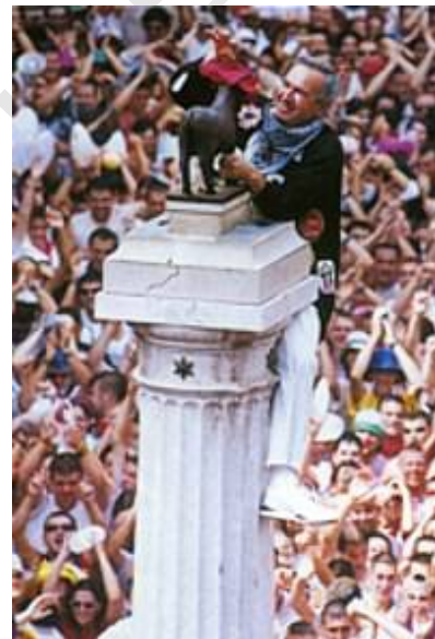
Foto 7. El Torico