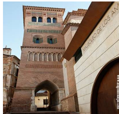
Foto 5. Torre San Pedro

3) Torre de San Pedro: Destaca por la armonía del conjunto mudéjar. El actual edificio fue construido entre 1319 y 1392. Su torre mudéjar posee una estructura similar a la de la Catedral, destacando por su decoración con elementos cerámicos morados, verdes; estos últimos son únicos en el mudéjar de Teruel. Algunos autores la consideran como la más antigua de las torres mudéjares de la Ciudad; recientes dataciones por termoluminiscencia (1103-95) podrían apuntar en esa dirección. La Iglesia es de una sola nave, con capillas laterales entre los