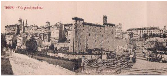
1. Teruel a finales del S.XIX