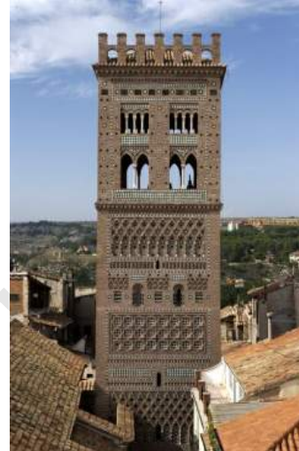
Foto 4. Torre del Salvador

2) Torre del Salvador: Tradicionalmente se considera coetánea o literalmente posterior a la Torre de S. Martín, fechas que se ajustan suficientemente a la dotación por termoluminiscencia. Las principales diferencias con la de S. Martín, son el uso de una bóveda de crucería en el pasaje que discurre bajo la misma y un mayor desarrollo de los paños ornamentales, con ausencia del paño de arcos lobulados entre cruzados. Ha sido objeto de diversas restauraciones, la última de las cuales, acometida en 1993, le ha devuelto una apariencia más próxima a la obra original. La Iglesia es barroca, de finales del Siglo XVII (6).