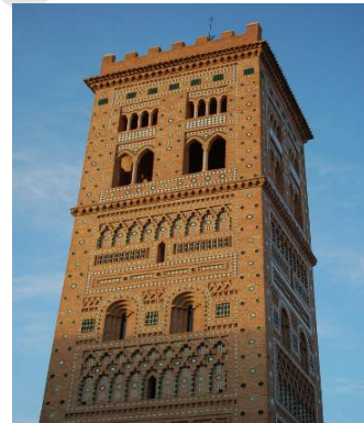
Foto 3. Torre de San Martín