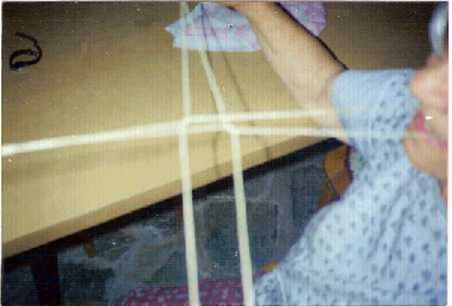
Rosa Capettini, 80 años, jugando al "Serrucho" con su hija Stela, Italo 2003.