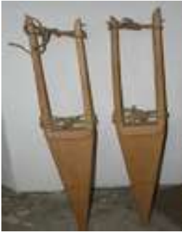
34 ZANCOS DE PIE