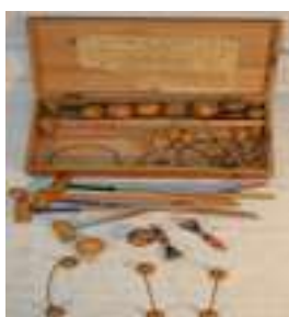
8 CRIKET 1