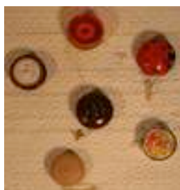
11 YO YOS (6)