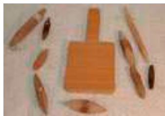
3 LA BILARDA