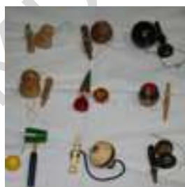
14 BOLICHES (9)