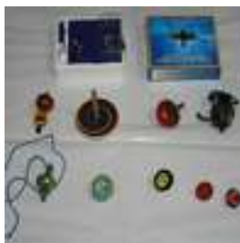
17 PIRINDOLOS (12)