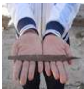
23 LA LIMA