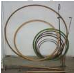
38 8 JUEGOS DE ARO