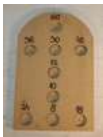
5 JUEGO DE LANZAMIENTO DE PRECISIÓN