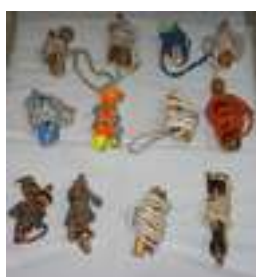
20 LA COMBA