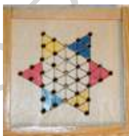
46 DAMAS CHINAS