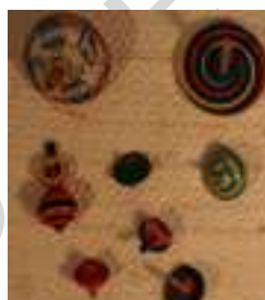
12 PIRINDOLO S (8)