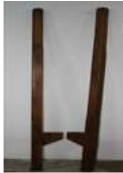
35 ZANCOS DE MANO