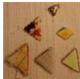
19 LOS BONIS