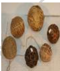
26 TIPOS DE PELOTA 2