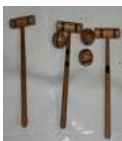
9 CRIKET 2