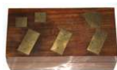
47 JUEGO DE DOMINÓ 1