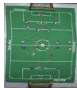
28 JUEGO DE CHAPAS