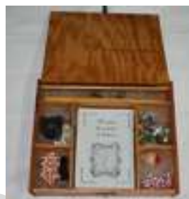
24 ELS LLOCS DE SUECA