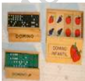
48 3 JUEGOS DE DOMINÓ