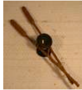
31 EL DIÁBOLO