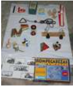
29 JUEGOS DE INGENIO