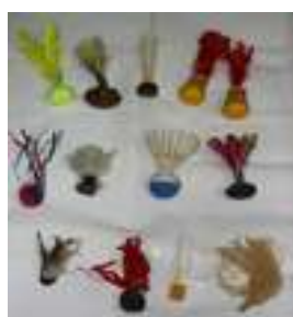
21 EL VOLANTE