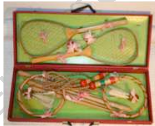
33 JUEGOS DE BADMINTON, SALTADOR Y AROS