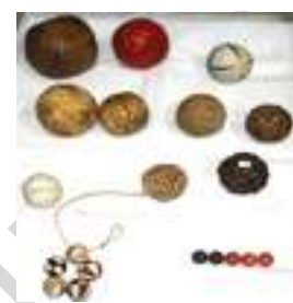
22 JUEGOS DE PELOTA