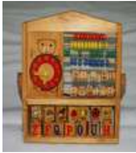
30 LAS PRIMERAS LETRAS