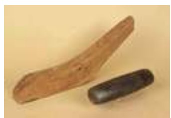
4 LA CALVA