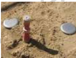
2 EL CHITO