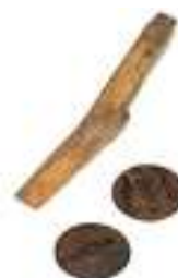
7 LA CALVA