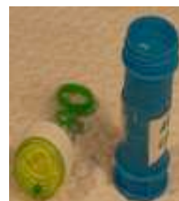
25 POMPAS DE JABÓN