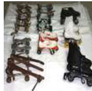
40 10 PARES DE PATINES