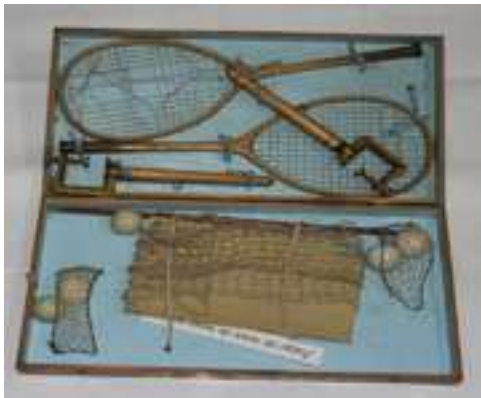
32 JUEGO DE TENIS DE MESA