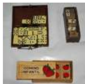
50 3 JUEGOS DE DOMINÓ