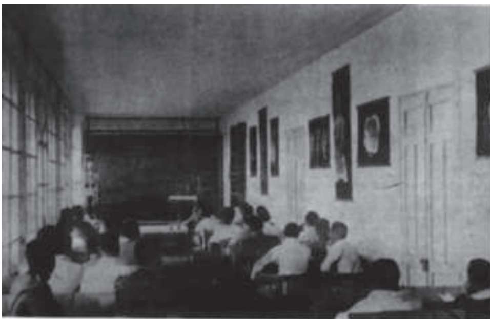
Foto nº 3 Memoria académica del año 1929 de la Escuela Central de Educación Física de Toledo