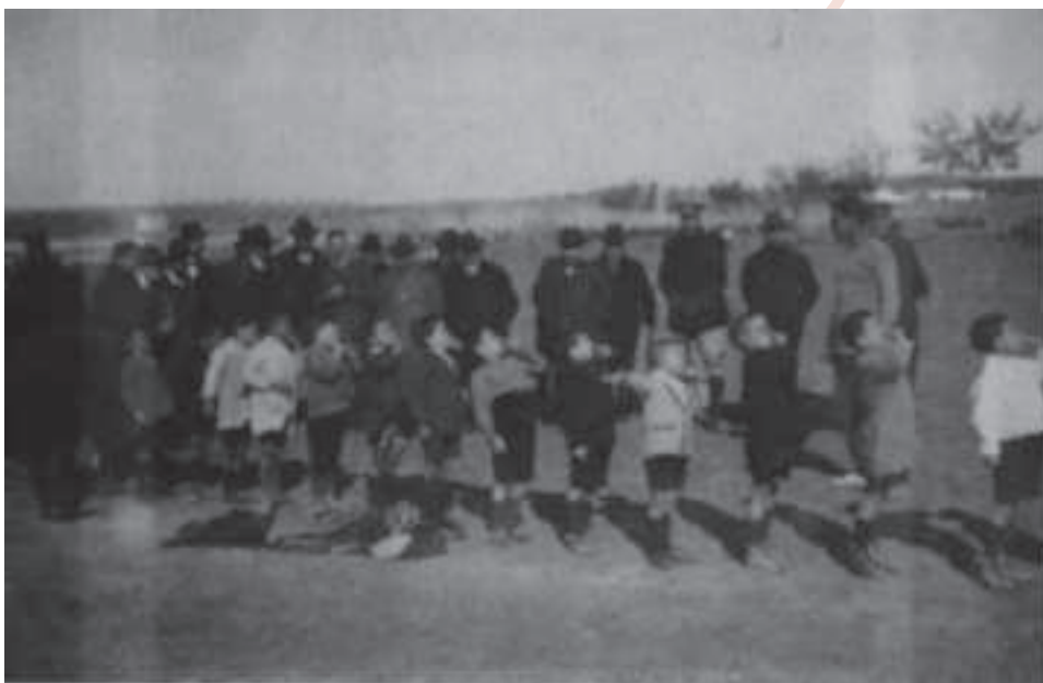
Foto nº5 Memoria académica del año 1924 de la Escuela Central de Educación Física de Toledo