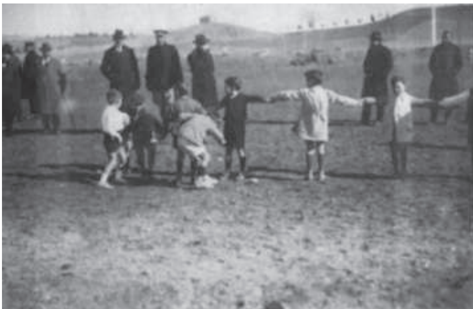
Foto nº 4 Memoria académica del año 1924 de la Escuela Central de Educación Física de Toledo