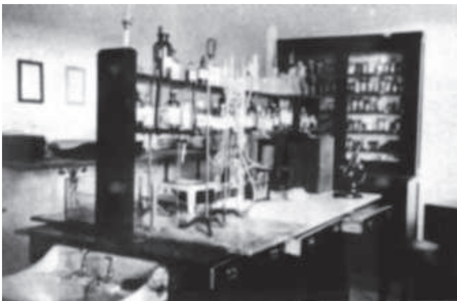
Foto nº 7 Memoria académica del año 1930 de la Escuela Central de Educación Física de Toledo