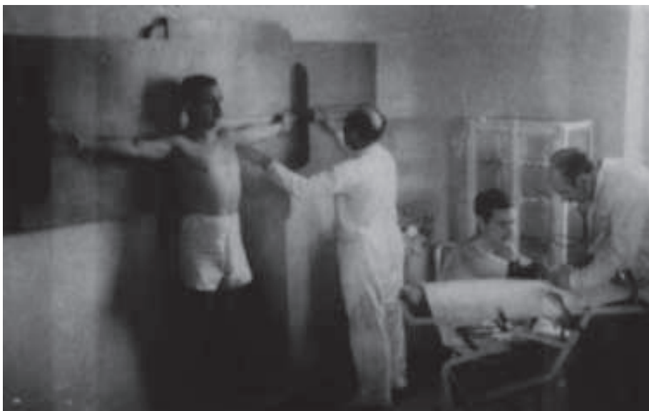
Foto nº 6 Memoria académica del año 1930 de la Escuela Central de Educación Física de Toledo