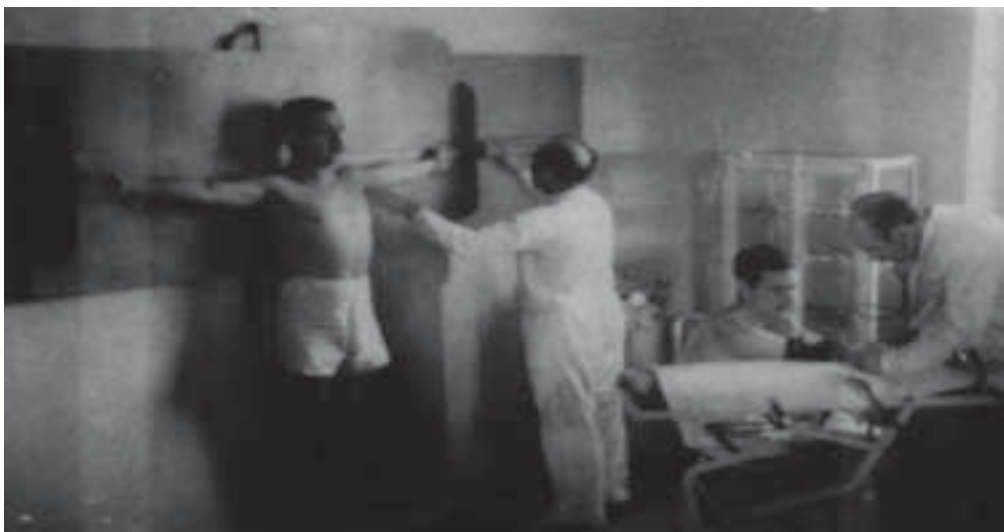
Foto nº 13 Mediciones Antropométricas.