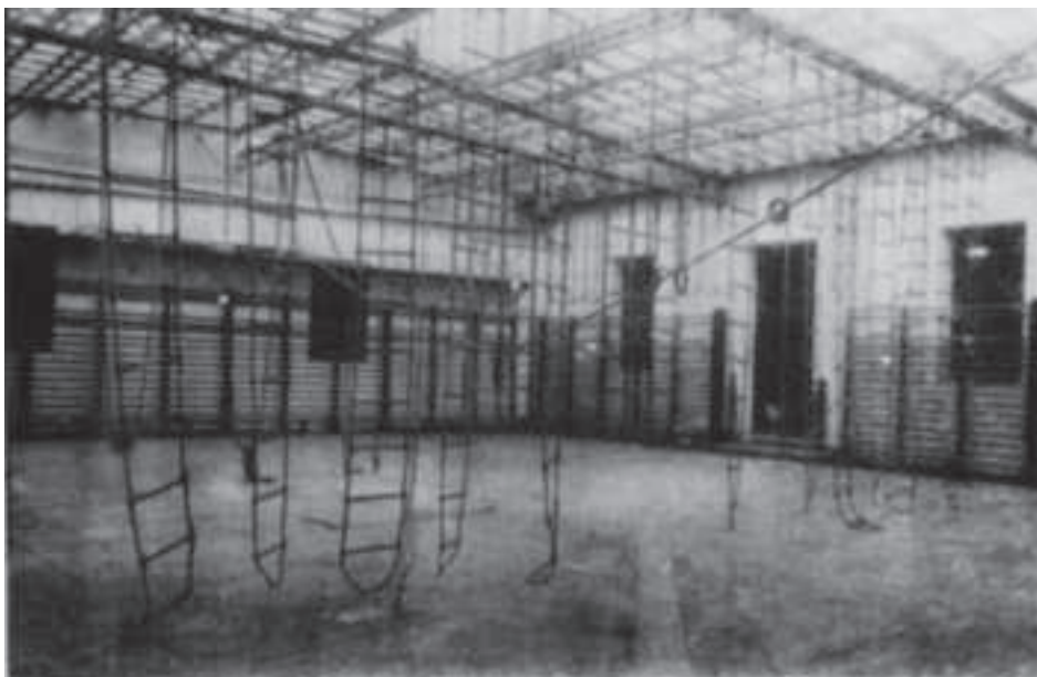
Foto nº 2 Memoria académica del año 1929 de la Escuela Central de Educación Física de Toledo