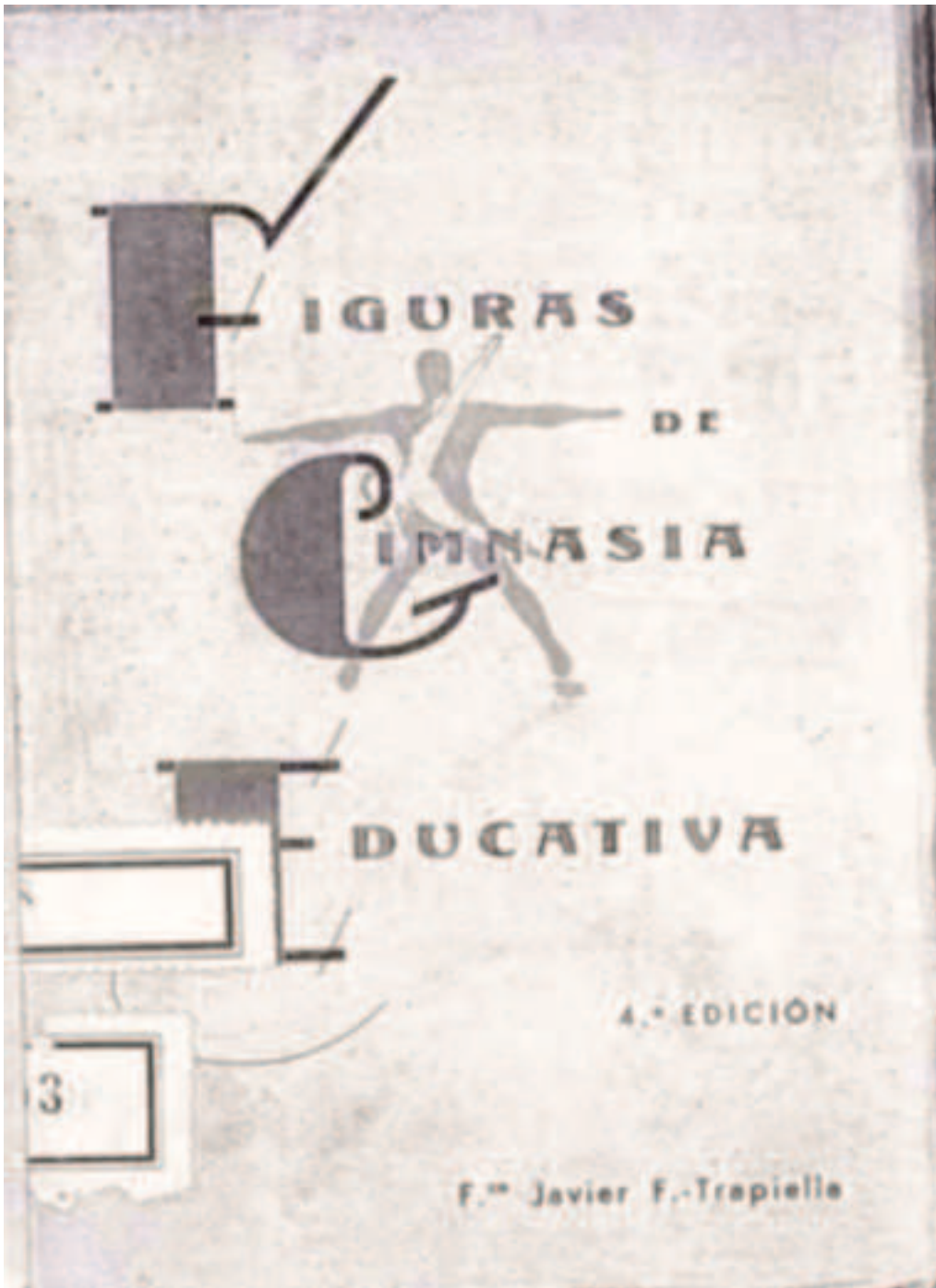
Foto nº 1 Biblioteca de la Escuela Central de Educación Física de Toledo