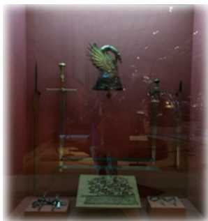
1. Cimera, espada y vainas manto y acicats de Fernando III

El Tesoro Real fue un antecedente de la Real Armería. Entre otras armas custodiaba las espadas G.180, G.22 y G.21, atribuidas al Cid, a Alfonso X y a Fernando III, a quien también pertenecieron el fragmento del manto N.9 y los acicats F.159-F.160. El valor dinástico es manifiesto en la cimera D.11, divisa real de Aragón conocida como Drac Pennat, y en los