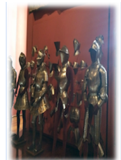
10. Inventario iluminado.

Las armas encargadas por los personajes más importantes del Renacimiento solían responder a modelos exclusivos. Las armaduras de Carlos V introdujeron ingeniosas soluciones constructivas y nuevos patrones decorativos. En los siglos XVI y XIX