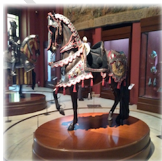
4. Barda de Carlos V

La tradición religiosa y la mitología clásica fueron los pilares del pensamiento armas como virtudes deseadas para sus propietarios. Esta espléndida barda representa, parcialmente, los