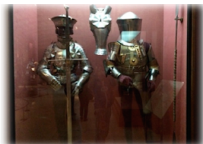
3. Armadura, testera, jabalina

La política matrimonial de los Reyes Católicos supuso la introducción de la Casa de Austria en España gracias a la boda, en 1496, entre la princesa Juana de Castilla (1479-1556) y el archiduque Felipe de Borgoña (1478-1506), hijo del emperador Maximiliano I de Austria, que reinaría como Felipe I de Castilla, el Hermoso.