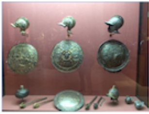
12. Cascos, Escudos para los juegos de cañas