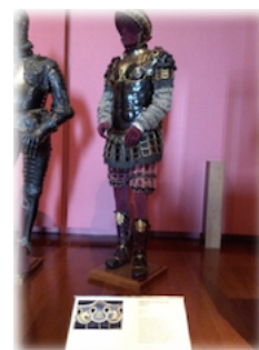
7. Armadura a la romana

Las armaduras a la romana fueron una de las mejores expresiones del gusto renacentista por revivir la antigüedad, ya que evocaban las corazas de aristócratas de la antigua Roma. Esta coraza es la única de su género que se ha conservado de forma completa.