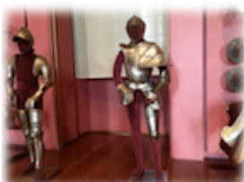
8. Armaduras de Felipe II