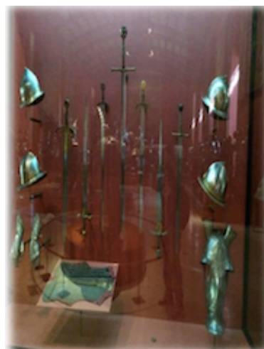
2. Estoque de ceremonia, espadas Maximiliano I

El reinado de los Reyes Católicos marco el tránsito entre el medievo y el renacimiento. El estoque real de ceremonia recoge sus emblemas: el haz de flechas de Isabel y el yugo con el tema Tanto monta de Fernando. Los Reyes Católicos impulsaron la creación de la nación española mediante una incesante actividad diplomática y militar,