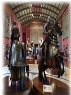
6. Inventario iluminado

La barda de esta armadura ecuestre se encuentra entre las armas pertenecientes a Carlos V consignadas en el inventario iluminado. Destaca frente a las bardas restantes por su extraordinaria sobriedad, ya que carece de cualquier tipo de decoración. En origen era de color negro por efecto del pavonado protector que recubría toda su superficie.