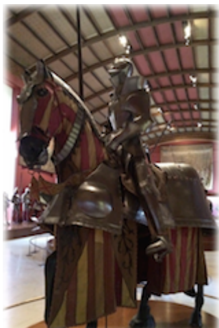
5. Barba del emperador Maximiliano I de Austria