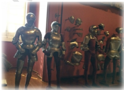
11. Inventario iluminado.

La decoración reproduce los eslabones del collar del Toisón de Oro, orden de caballería fundada en 1430 por Felipe el Bueno, Duque de Borgoña y tatarabuelo