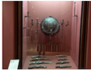
13. Armas portátiles